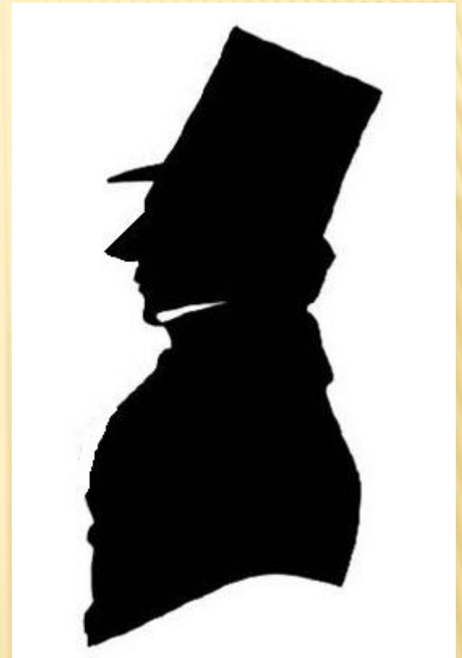
Этьен де Силуэт (1709 - 1767)

В таком рисунке не показывают черты лица или другие детали, находящиеся внутри пятна. Возродилось искусство силуэтного портрета во Франции в первой половине 18 в.