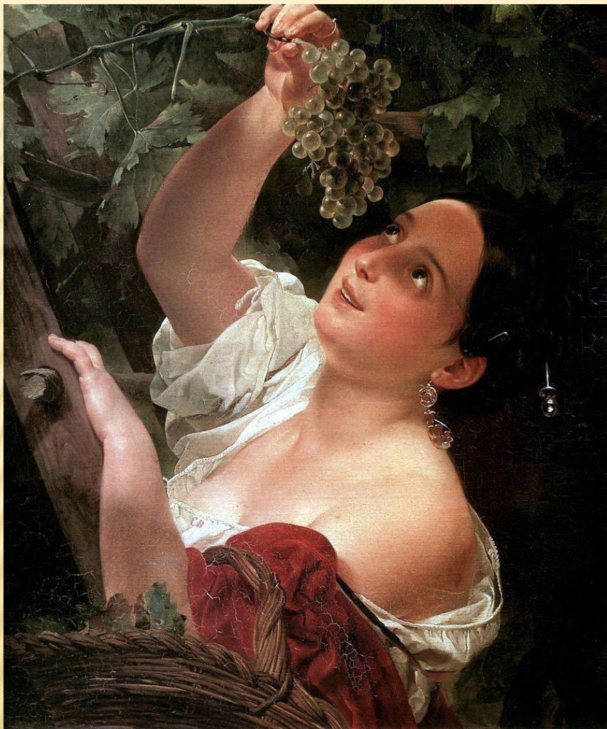
«Итальянский полдень» 1827 Русский музей