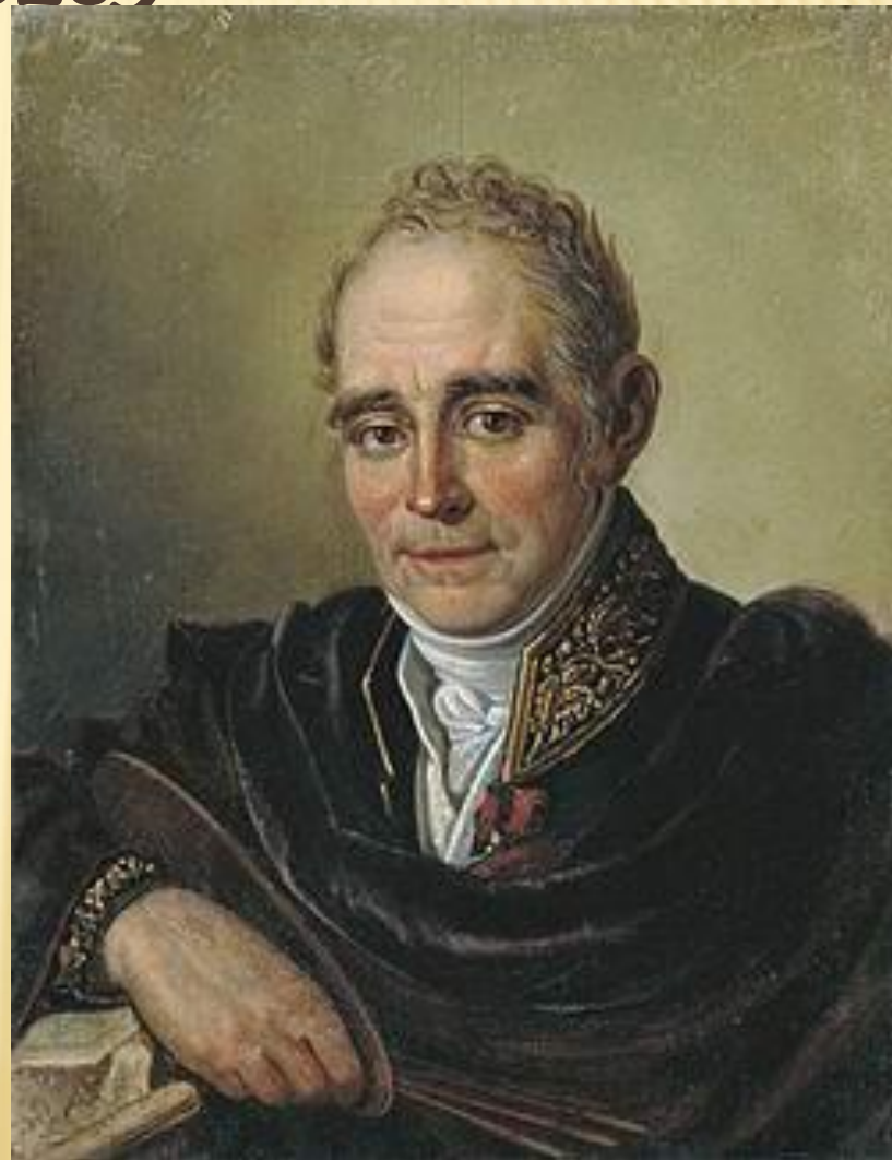
Автор-Иван Семенович Бугаевский-Благодатный

Русский художник портретист. Он внёс в русское портретное искусство новые черты: большой интерес к миру человеческих чувств и настроений. Обладая виртуозной живописной техникой, Боровиковский по праву может считаться одним из лучших русских портретистов.