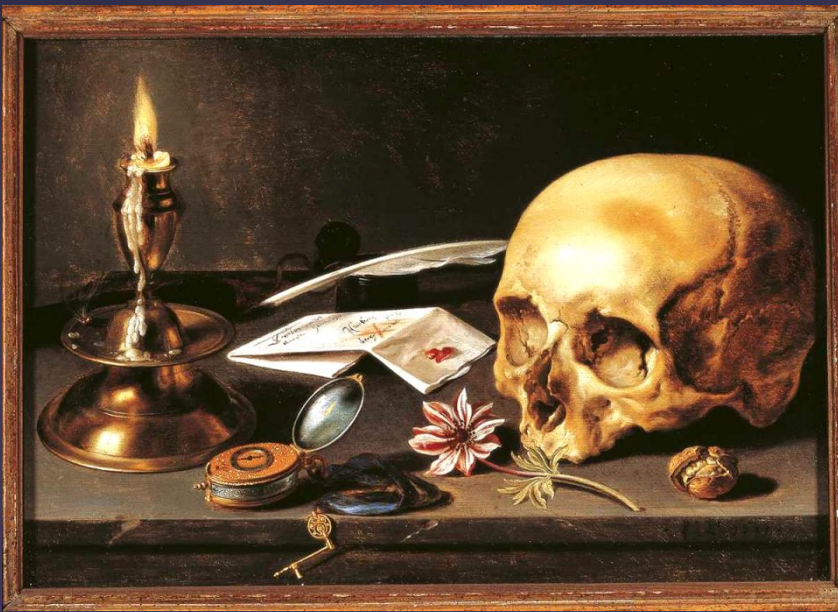
Питер Клас, «Vanitas». 1628 год.

Vanitas. (лат. vanitas , букв. — «суета, тщеславие») — жанр живописи эпохи барокко, аллегорический натюрморт, композиционным центром которого традиционно является человеческий череп. Подобные картины, ранняя стадия развития натюрморта, предназначались для напоминания о быстротечности жизни, тщетности удовольствий и неизбежности смерти. Наибольшее распространение получил во Фландрии и Нидерландах в XVI и XVII веках, отдельные примеры жанра встречаются во Франции и Испании.