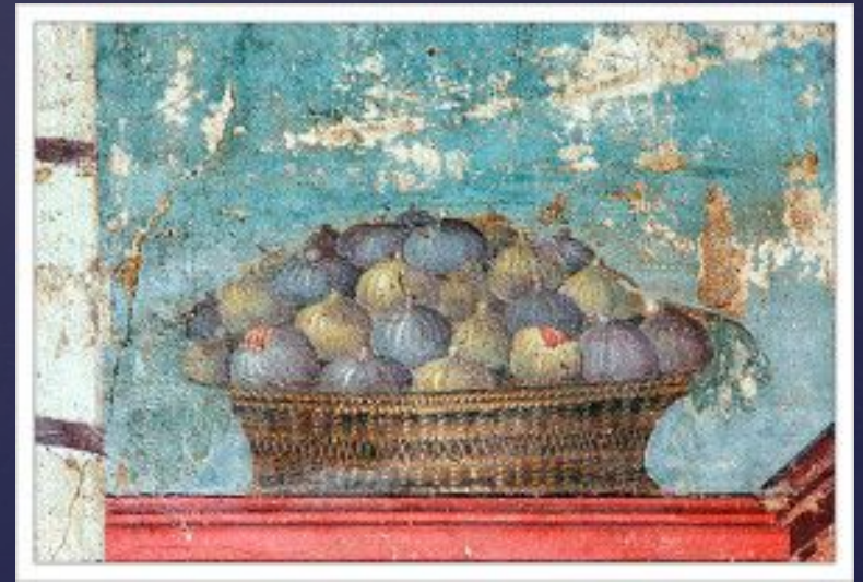
Натюрморт. Стеклянная чаша с фруктами. Фреска, около 70 г. н.э. Помпеи.