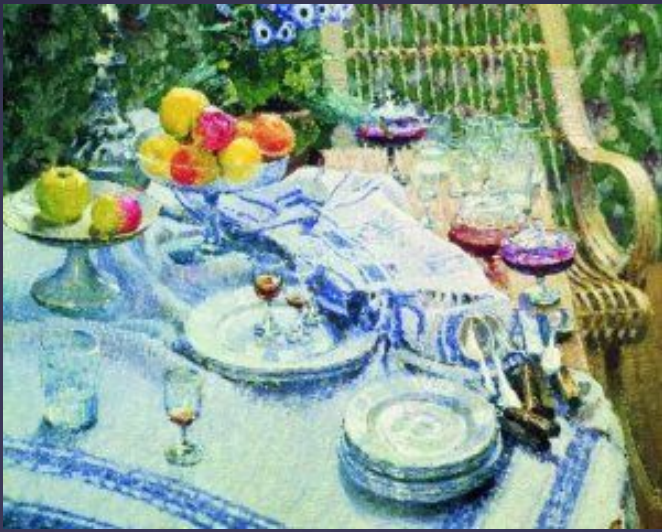
Неприбранный стол – Грабарь Игорь