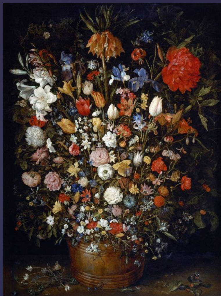
н Брейгель Старший. «Цветы в деревянном вазоне». 1606/07 гг.