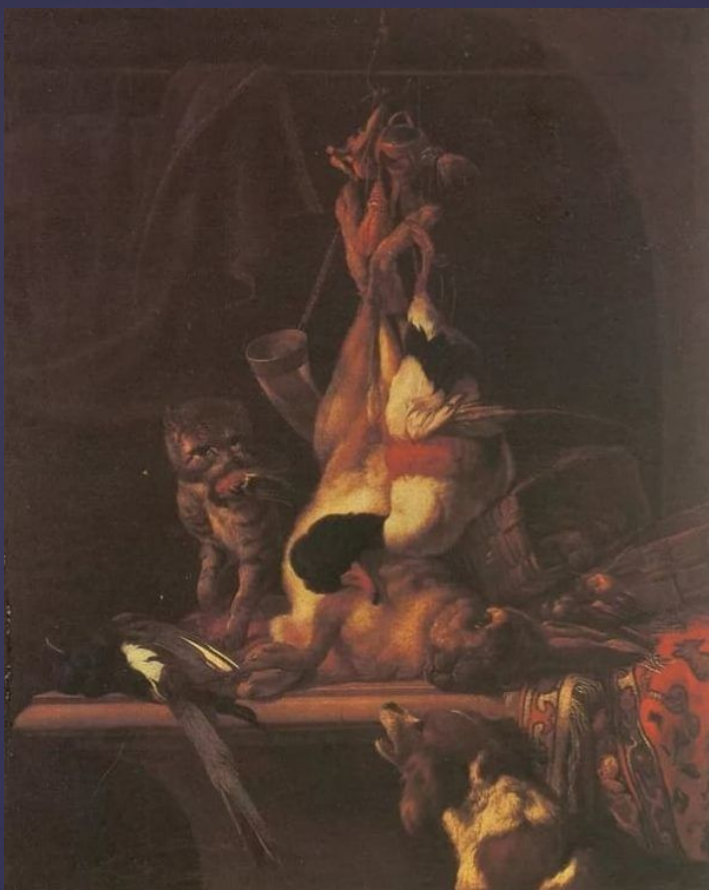
Мелхиор де Хондекутер «Охотничьи трофеи»