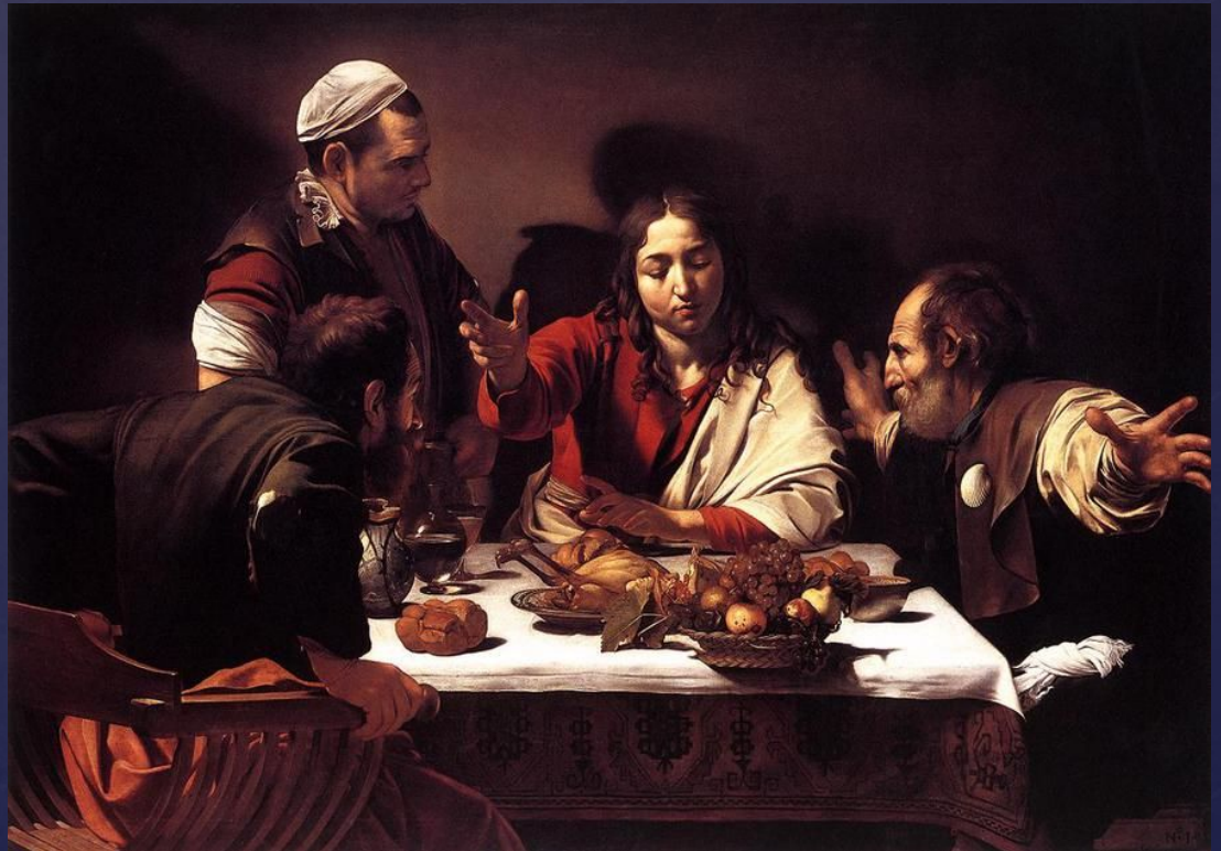
«Ужин в Эммаусе» 1601г, Караваджо

Становление натюрморта, как самостоятельного жанра начинается в 1500-х годах в Северной Европе. В средние 16 века искусство служило христианству, иллюстрируя сцены из Библии. Художники в 1500-х и 1600-х годах, такие как Ян Ван Эйк и Караваджо, включали композиции предметов как часть христианских сцен.