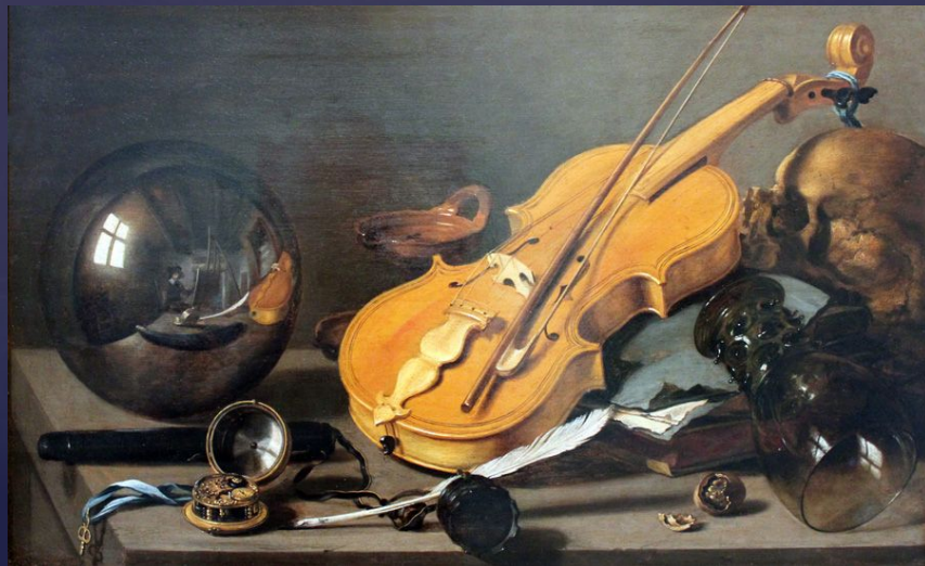
Питер Клас, «Vanitas» с автопортретом. 1628 год.