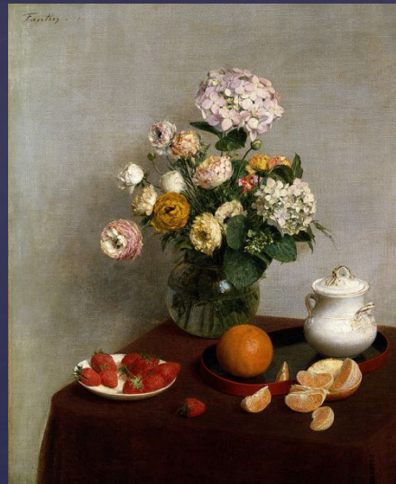
Анри Фантен-Латур. Гортензии в вазе