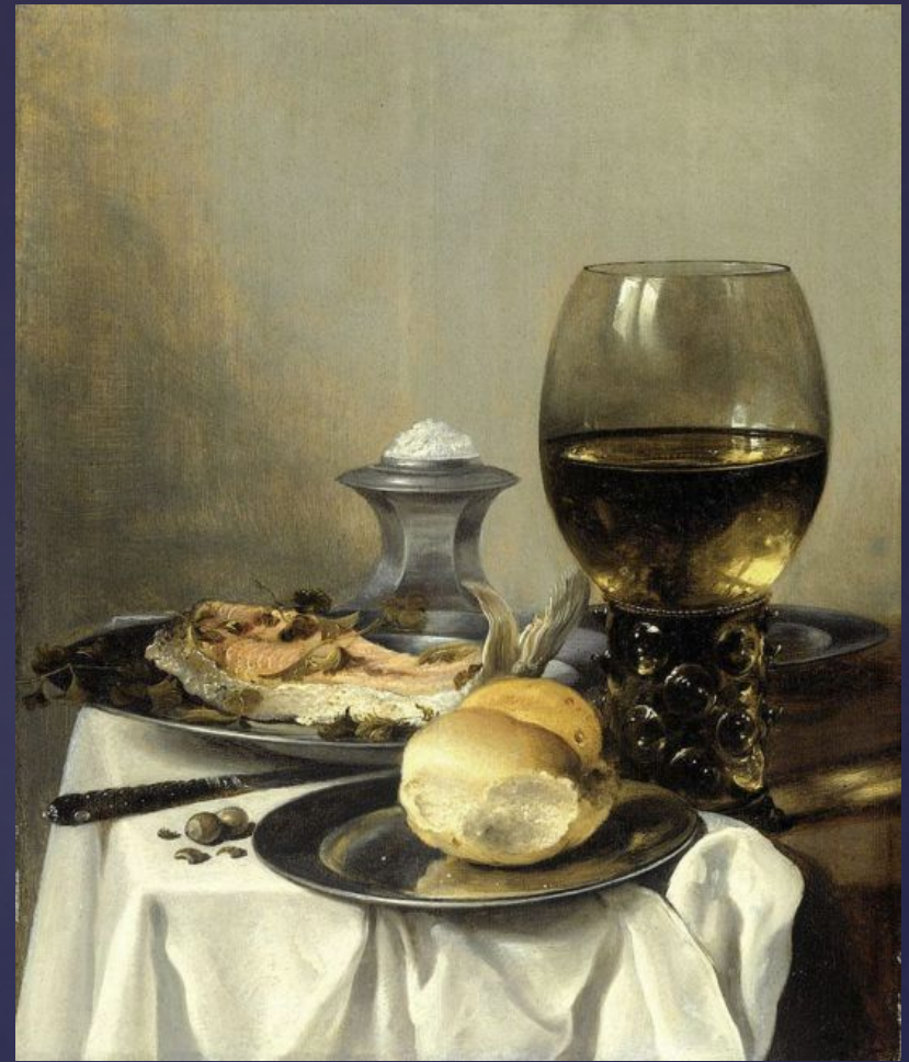
Питер Клас. «Натюрморт с солонкой». Ок. 1644