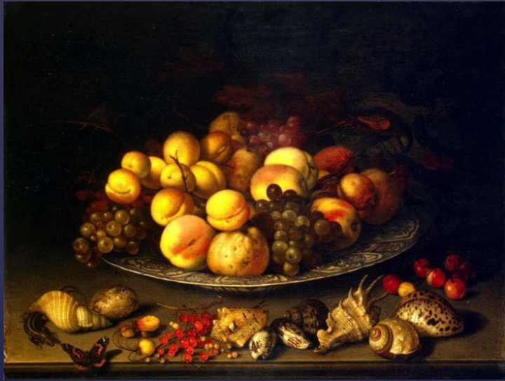
алтазар ван дер Аст «Тарелка с плодами и раковинами» 1630 г

Изображения предметов неодушевлённой природы встречаются в искусстве со времён античности. Однако именно в Голландии XVII века натюрморт впервые выделился в отдельный жанр изобразительного искусства. Голландский натюрморт имел большое количество разновидностей, среди которых можно выделить цветочный натюрморт, «учёный», «кухонный», а также так называемые «накрытые столы». Типично голландским видом натюрморта стали монохромные «завтраки», для которых характерны лаконизм содержания, сдержанность колорита и объединяющая роль световоздушной среды.