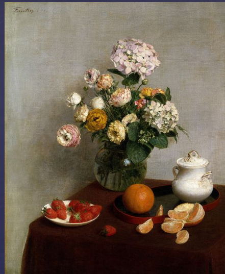
Анри Фантен-Латур. Гортензии в вазе