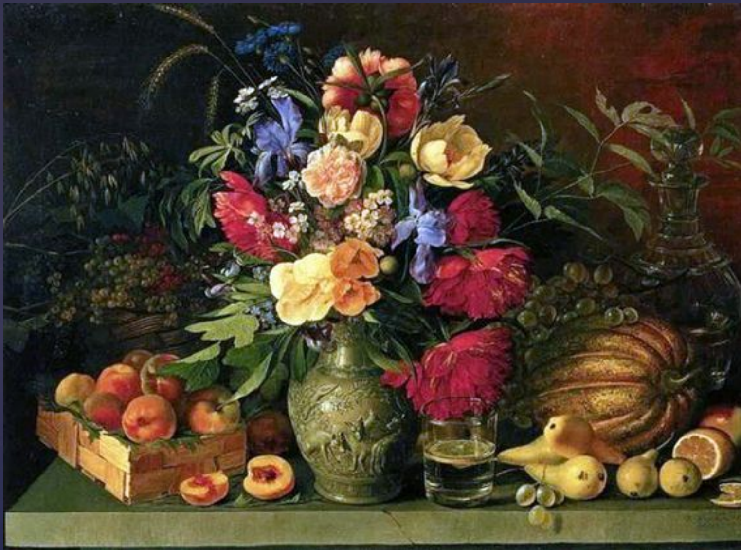
37. Хруцкий Иван "Цветы и плоды" 1830-1850