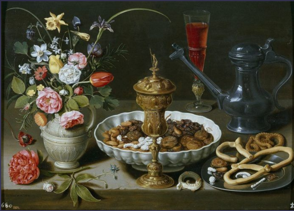
Клара Петерс. «Сервированный стол». 1611