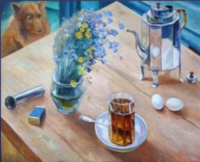
Петров-Водкин - Утренний натюрморт (1918)

Натюрморт как самостоятельный жанр живописи появился в России в начале XVIII века. Вплоть до конца XIX века натюрморт, в отличие от портрета и исторической картины, рассматривался в качестве «низшего» жанра. Он существовал как учебная постановка и допускался лишь в ограниченном понимании как живопись цветов и фруктов.