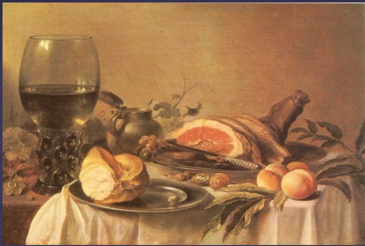
Питер Класс «Завтрак с ветчиной» 1647 г