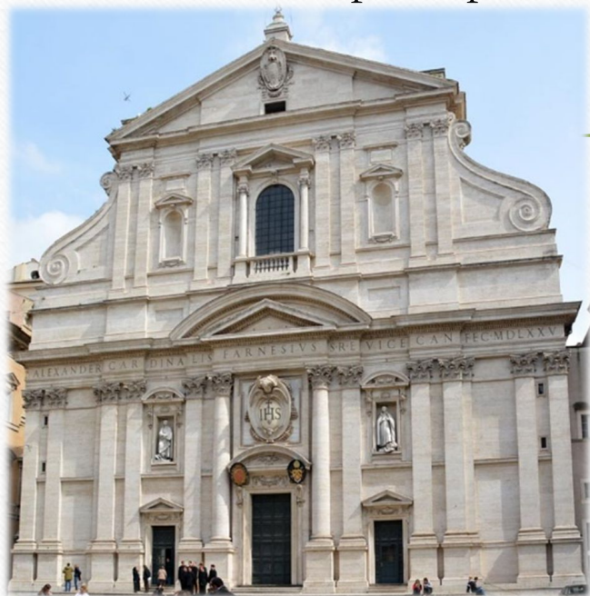
Церковь Иль Дезеу. Джакомо делла Порта Рим, 1575

Здание как трехмерный объем, органично вписанный в окружающее пространство.