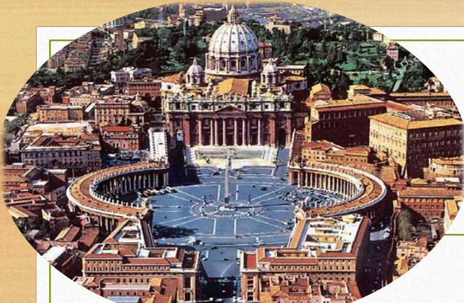
Площадь Св. Петра (1656-1667, Рим.)