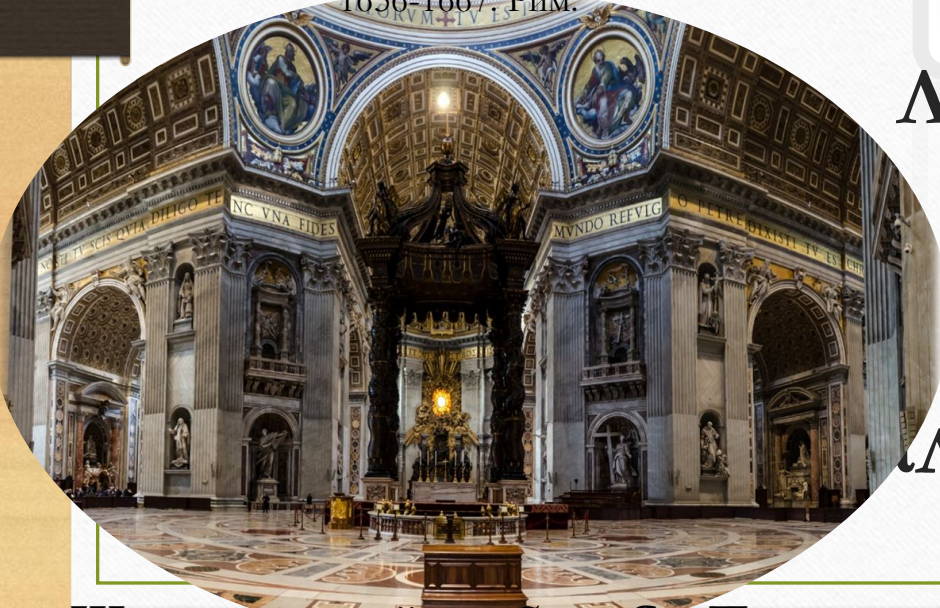
Шатер-киворий в соборе Св. Петра (1624-1633)