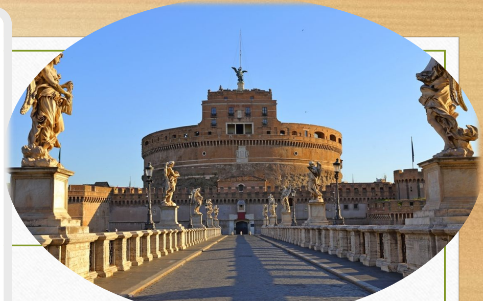
Мост Св. Ангела. (1669-1671)