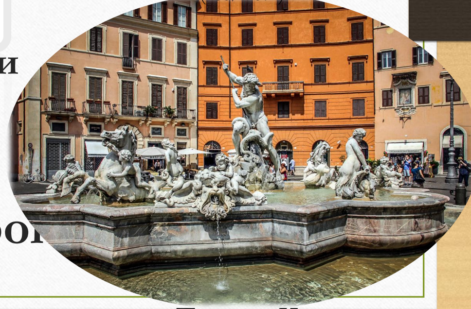
Площадь Навона (1648-1654)