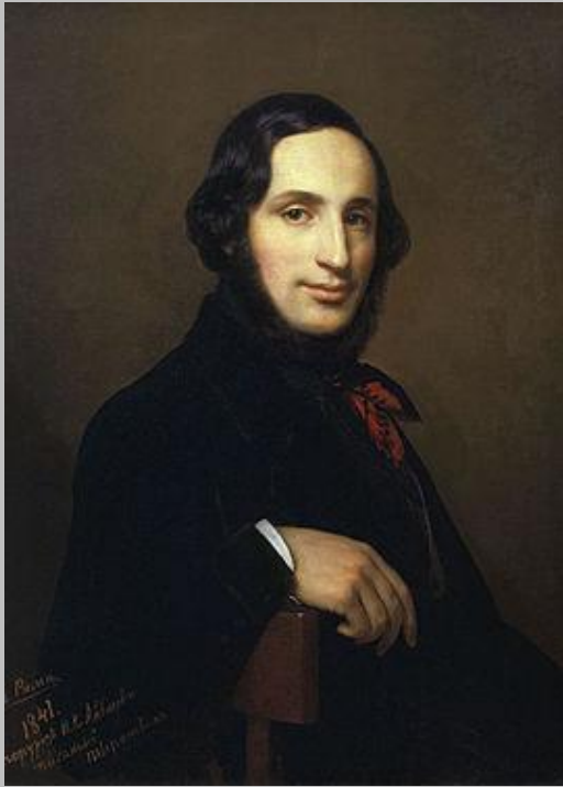
Айвазовский Иван Константинович художник - маринист