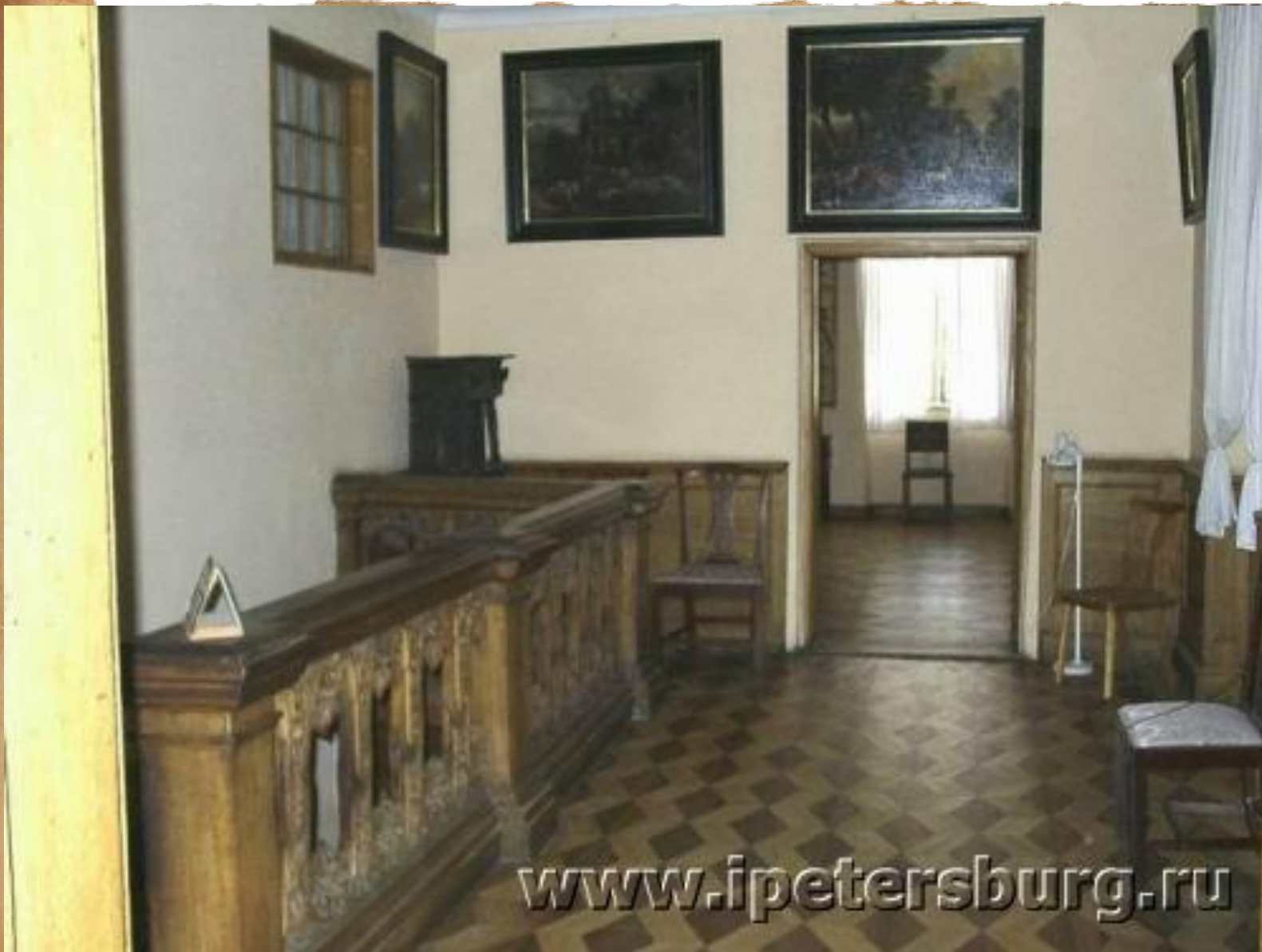
Лестница в покои императрицы Екатерины I.