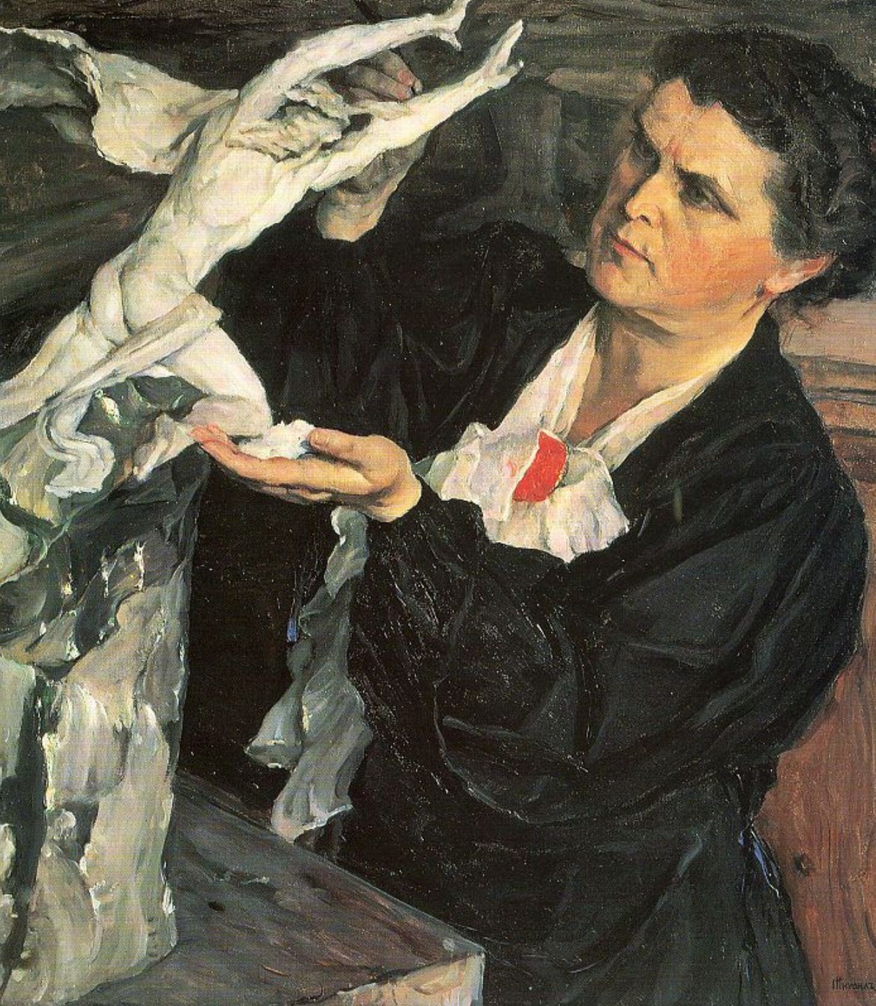
Вера Мухина. Портрет художника Михаила Нестерова