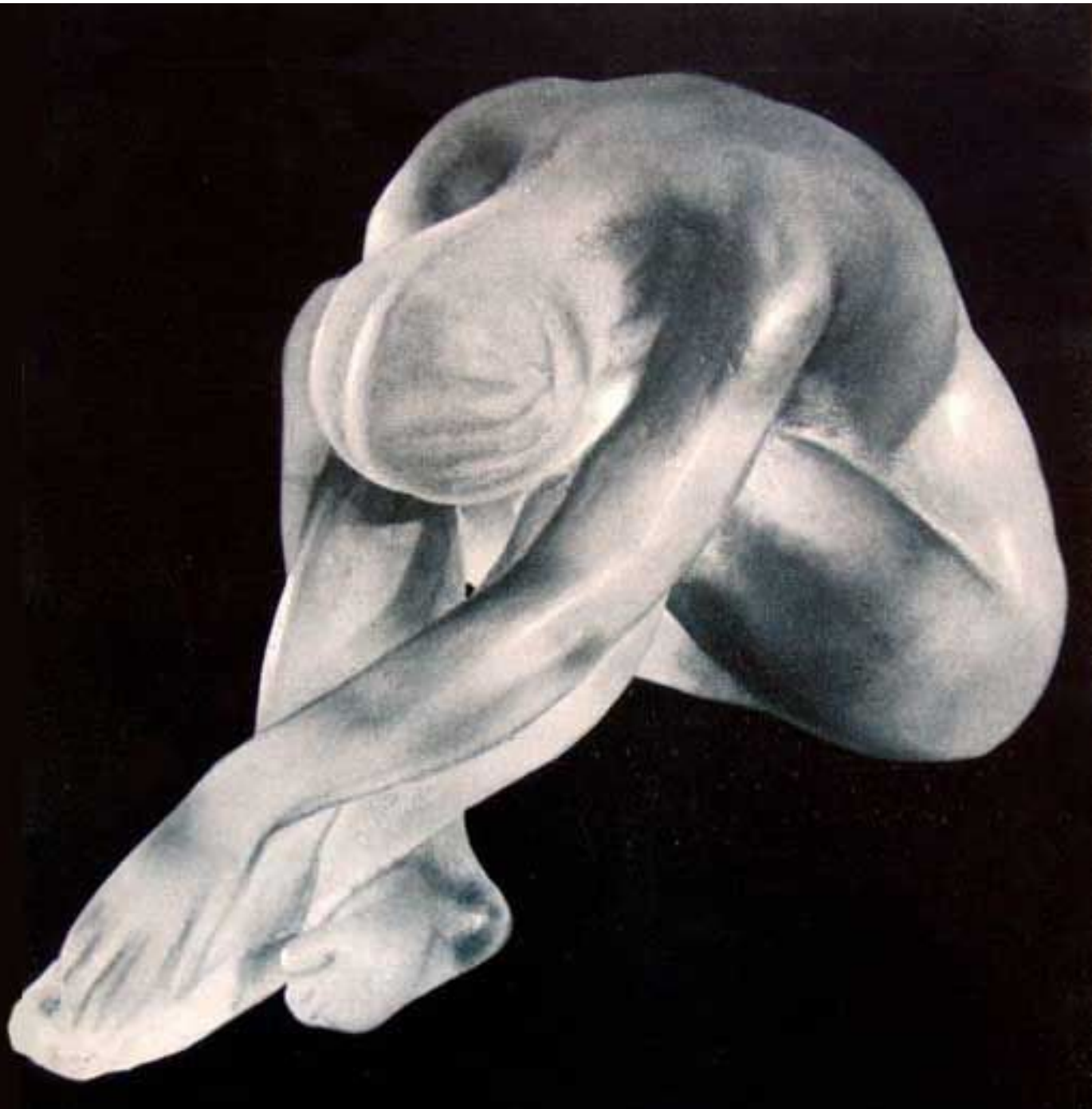
Сидящая фигурка. Стекло. 1947