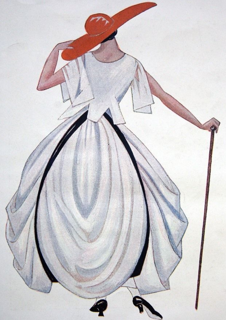
Рис. В. Мухиной. 1923 г.

Эстрадное платье. Драпированное из жесткого шелк-тафты и др.; комбинация голубого с черным. Верхняя часть обтянута по фигуре в виде жилета. Эта же модель может быть сделана из более темных тонов для вечернего платья.