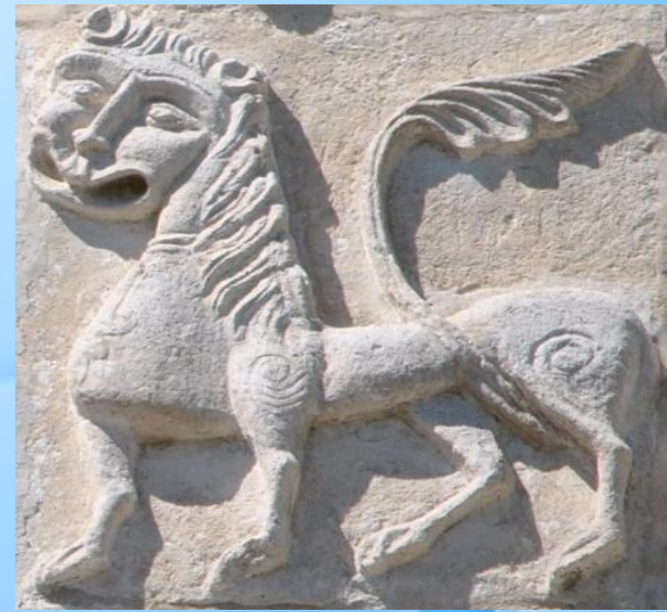
Лев белокаменная резьба