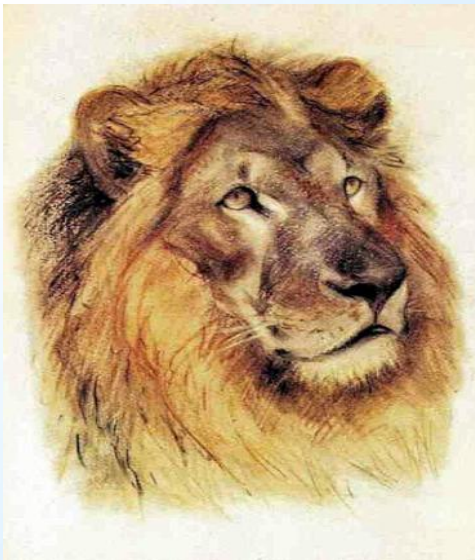
Лев худ. Вадим Трофимов

Но любое фантастическое животное рисуется на основе настоящих животных домашних и диких, которые живут в нашей стране и других странах.