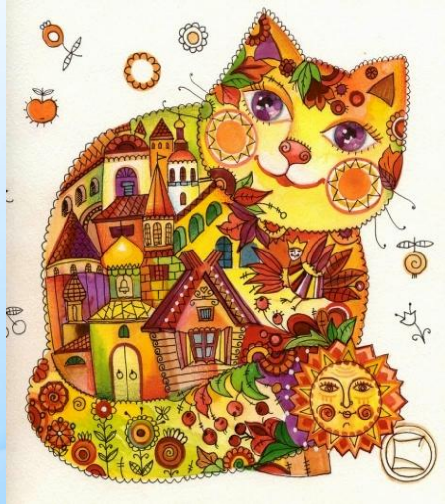
Русский кот Худ. Оксана Заика