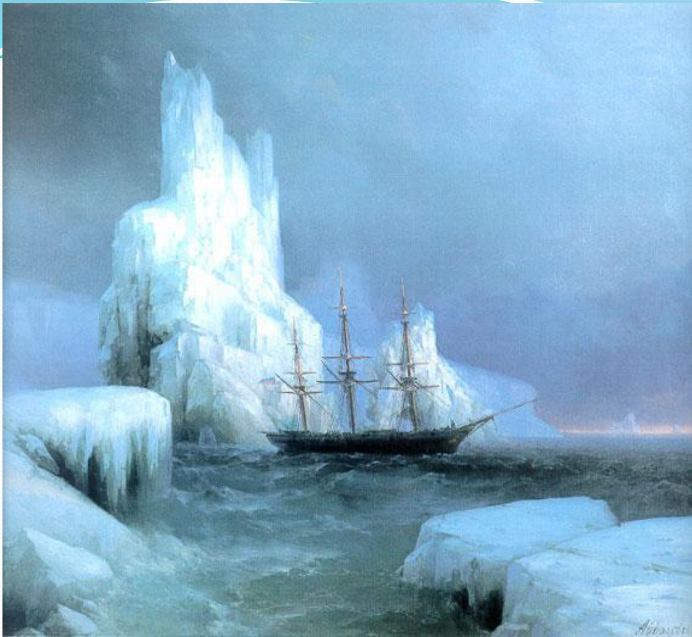
И. Айвазовск ий «Ледяные горы»