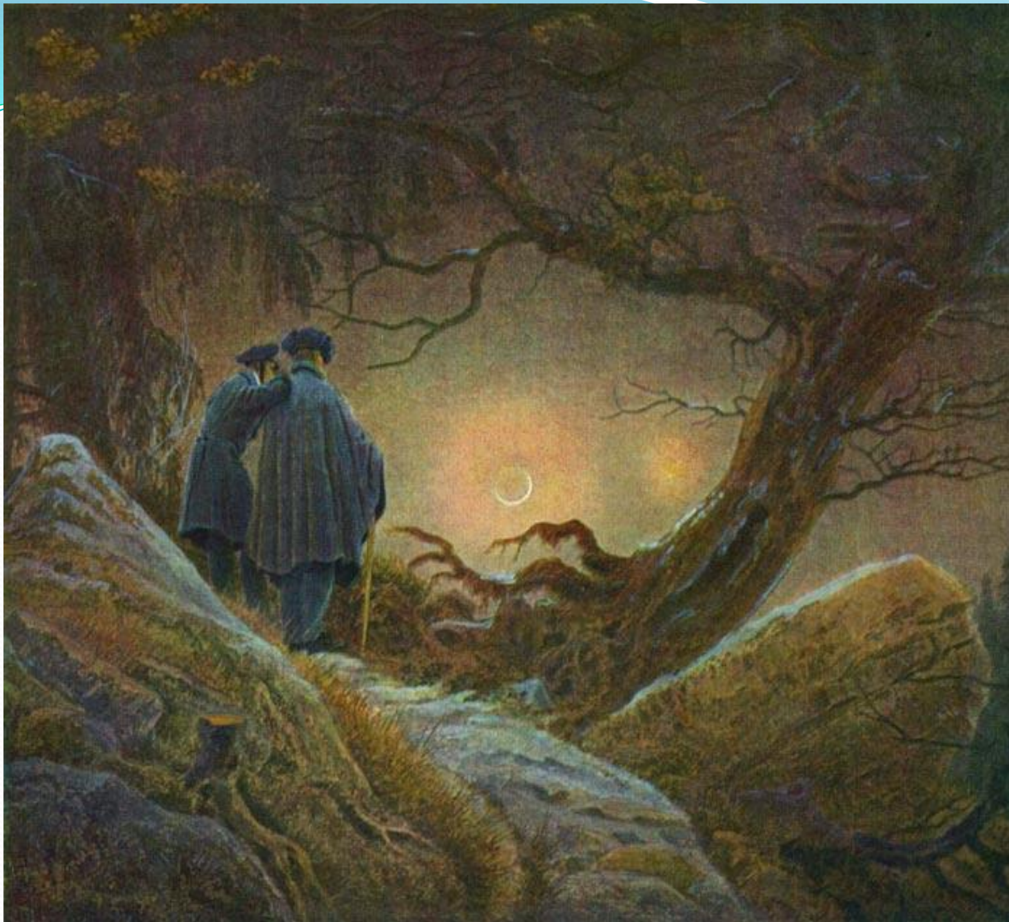
Фридрих К. Д. «Двое созерцающие луну»