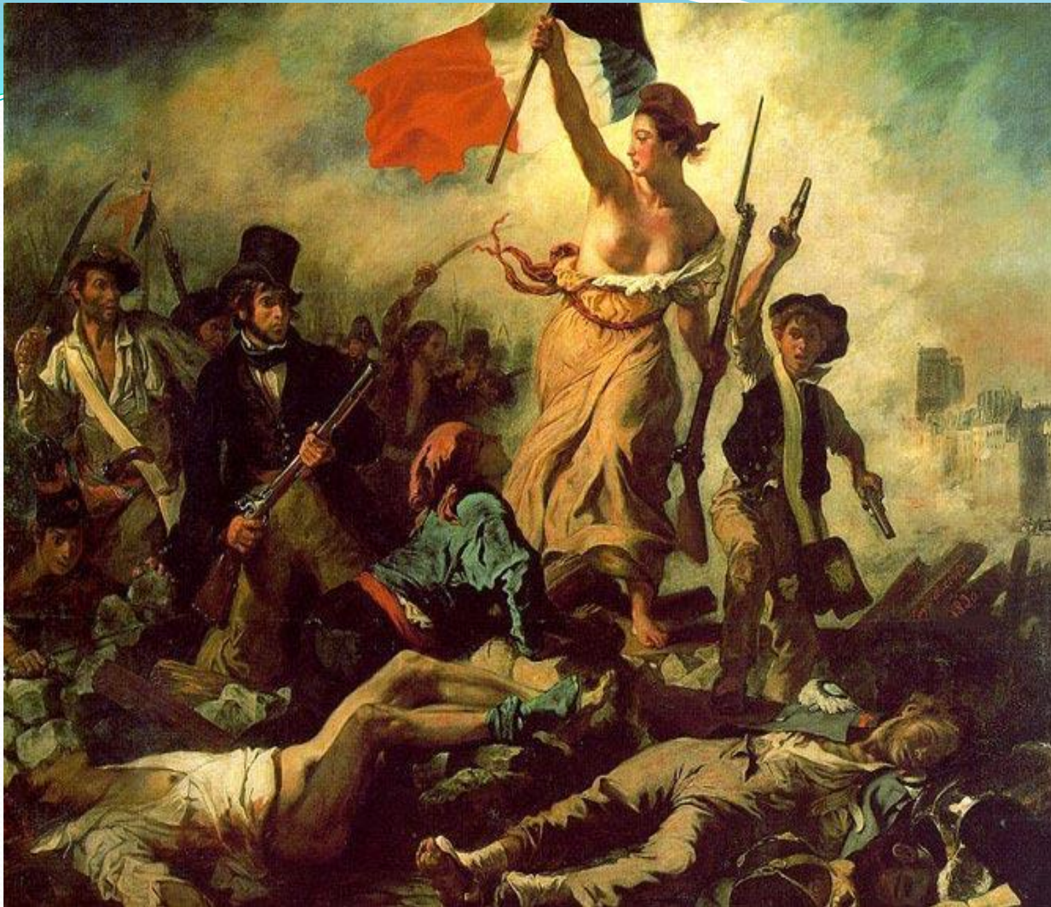
Эжен Делакруа «Свобода, ведущая народ»