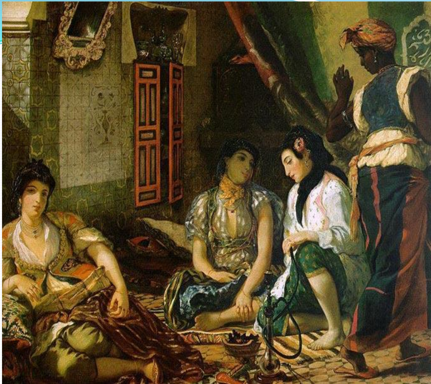
Э. Делакруа «Женщины Алжира в своих покоях»