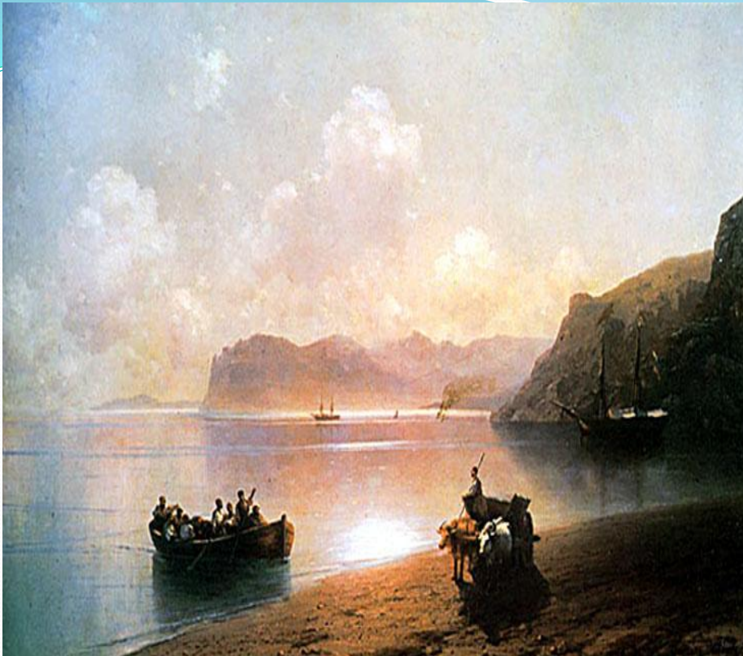
И. Айвазовски й «Утро в море»