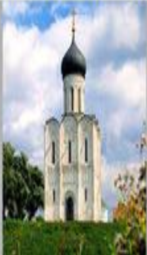
Храм Покрова на Нерли

Русская икона Храмы и соборы Древней Руси Декоративно- прикладное творчество Древней Руси