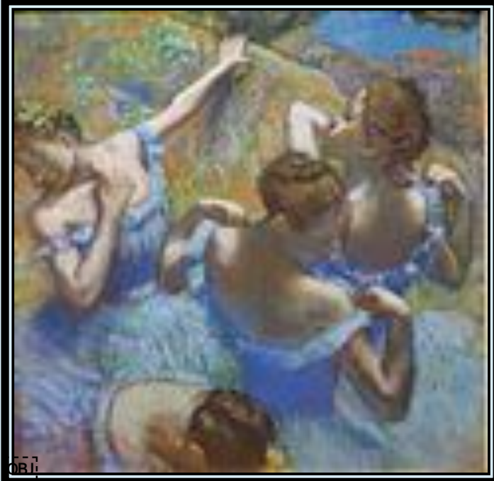
Голубые танцовщицы (1897), Музей искусств им. А. С. Пушкина, Москва