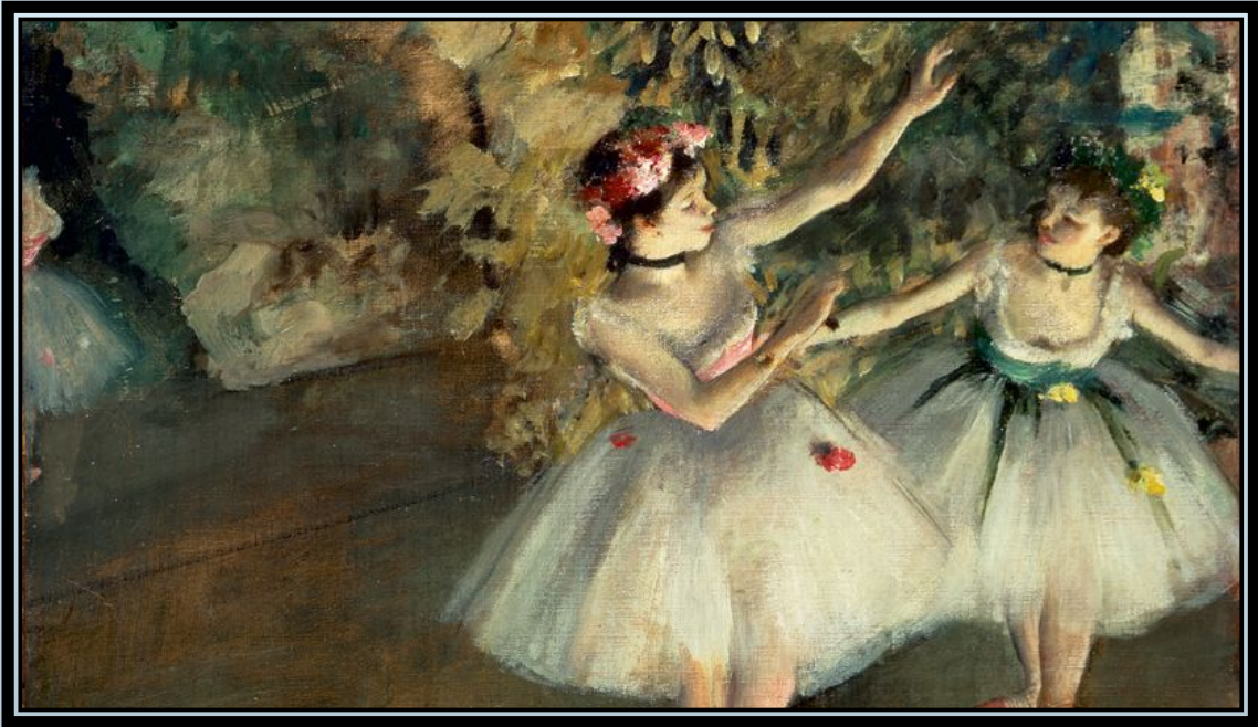
Degas and the Ballet: Picturing Movement.