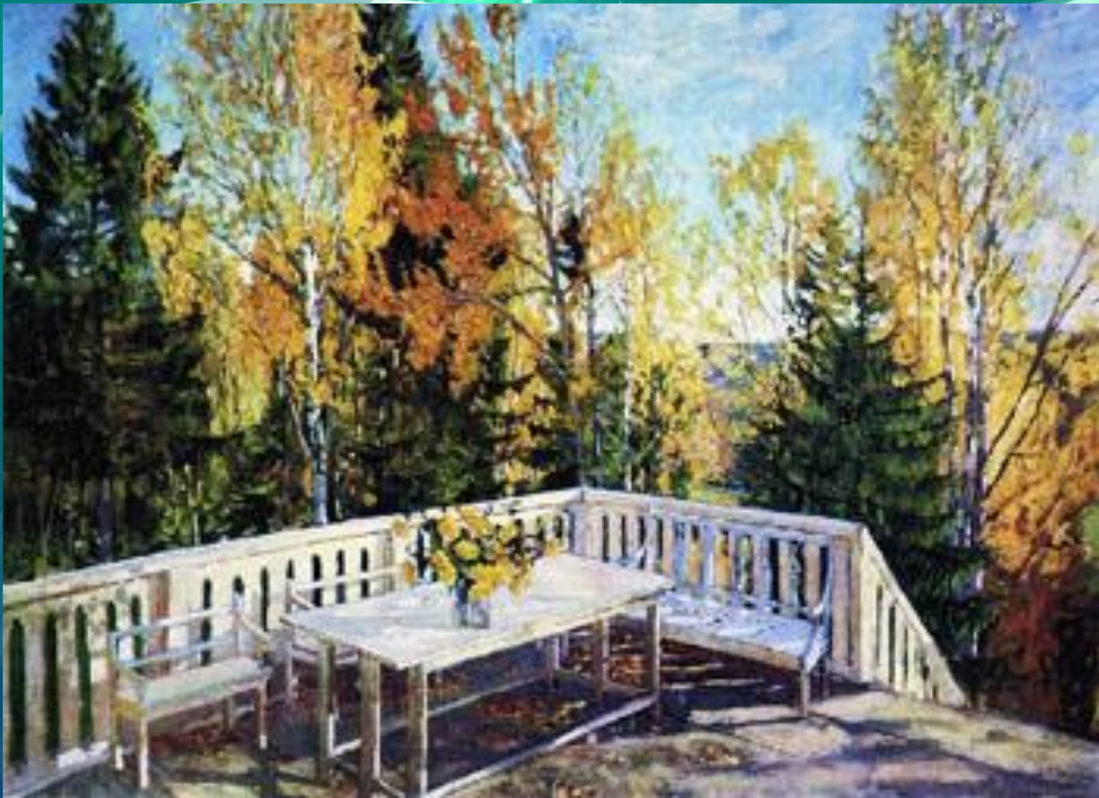
С. Ю. Жуковский "Осень. Веранда"