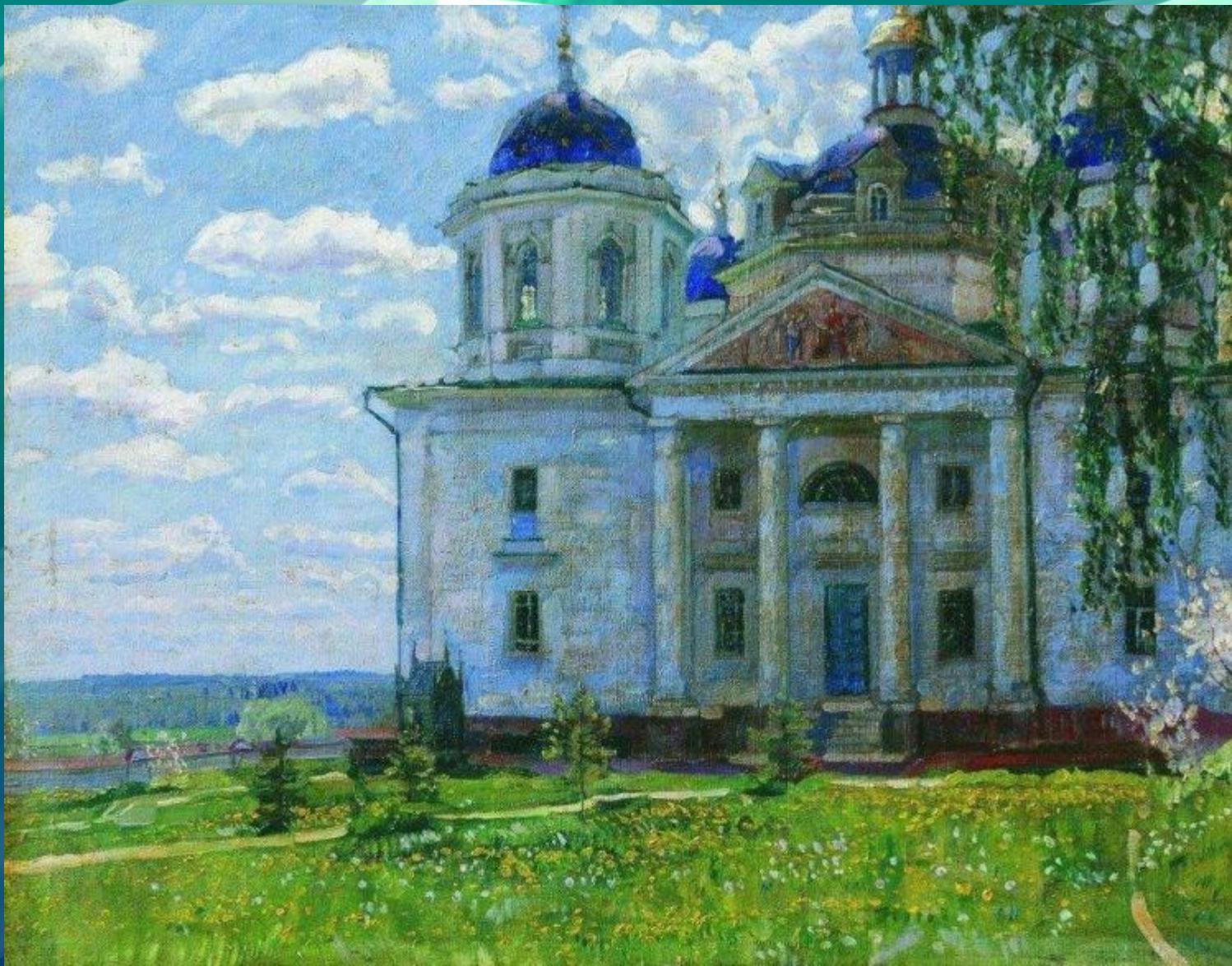
Пейзаж с церковью. Жуковский Станислав Юлианович