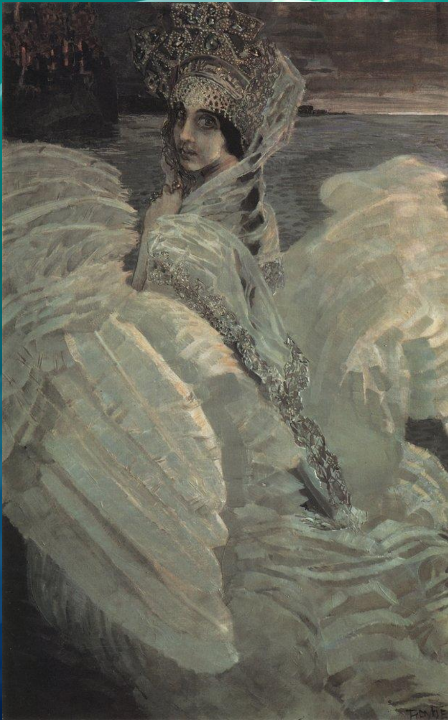
Михаил Врубель. Царевна- Лебедь. 1900, окончательный вариант