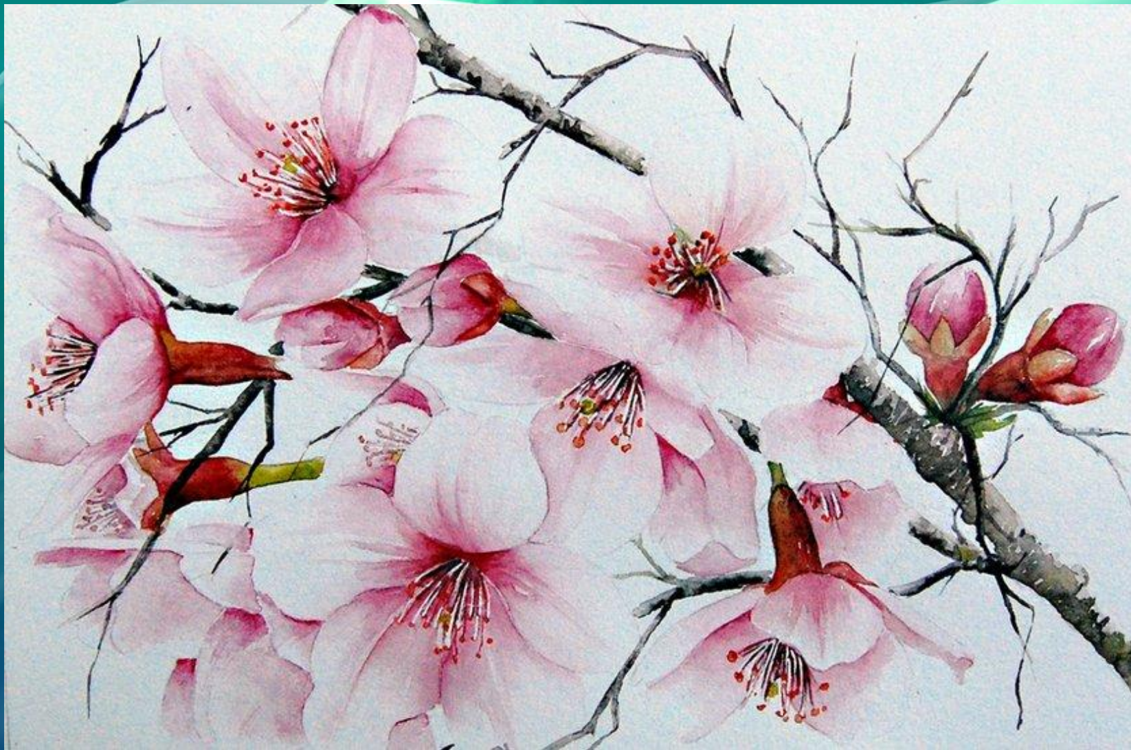
Художник-импрессионист Виллем Хенритс (Willem Haenraets). Цветущая сакура.