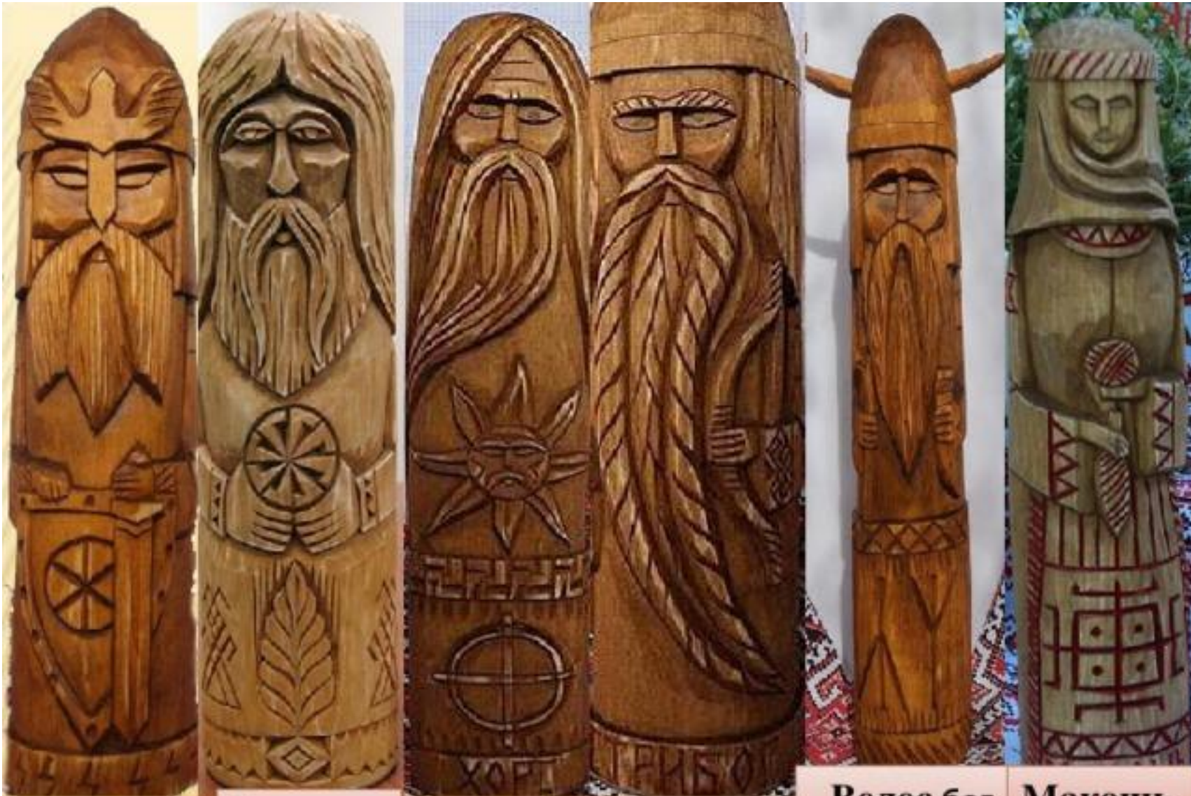
Перун бог грома молнии