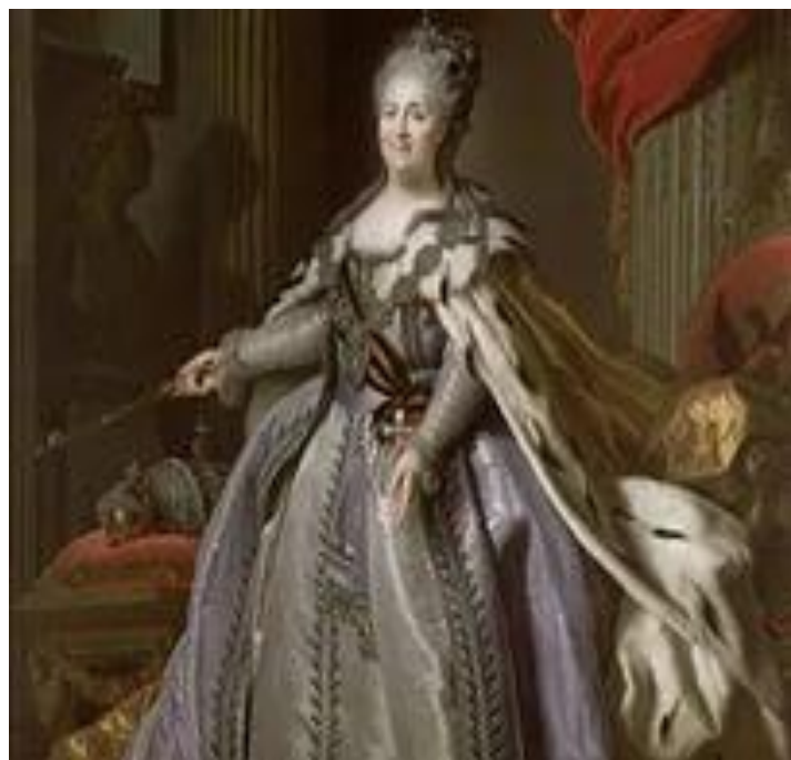
Портрет Екатерины II. Около 1780 г.