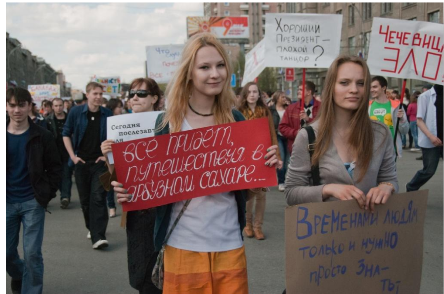
Монстрация в Новосибирске 1 мая 2011 года

Монстрация (от слова демонстрация ) – массовая художественная акция в форме демонстрации с лозунгами и транспарантами, которые участники используют как основное средство коммуникации со зрителями, друг с другом, как средство самовыражения, а также как художественную технику, при помощи которой они осмысливают окружающую действительность.