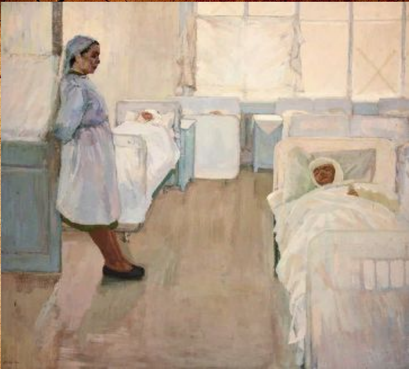
В.П. Кононов «В госпитале»