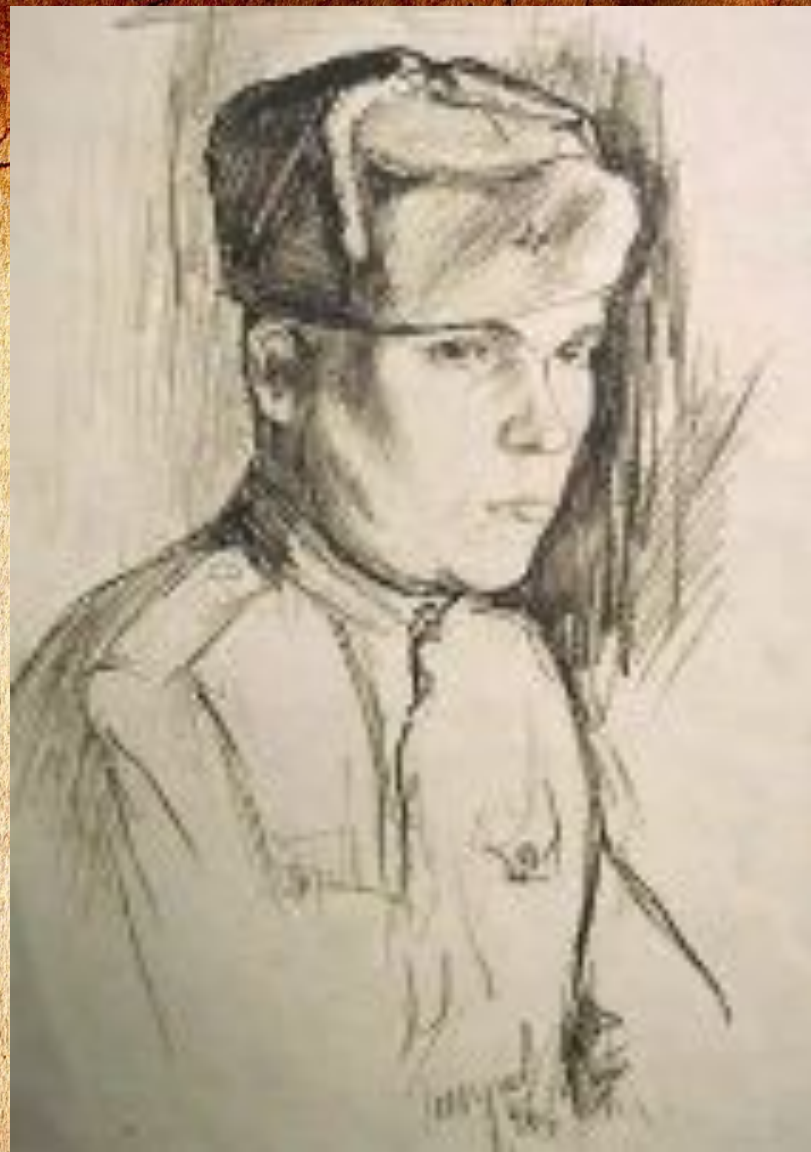
А.Н Безумов «Солдат Гайдуков», «Портрет товарища»,