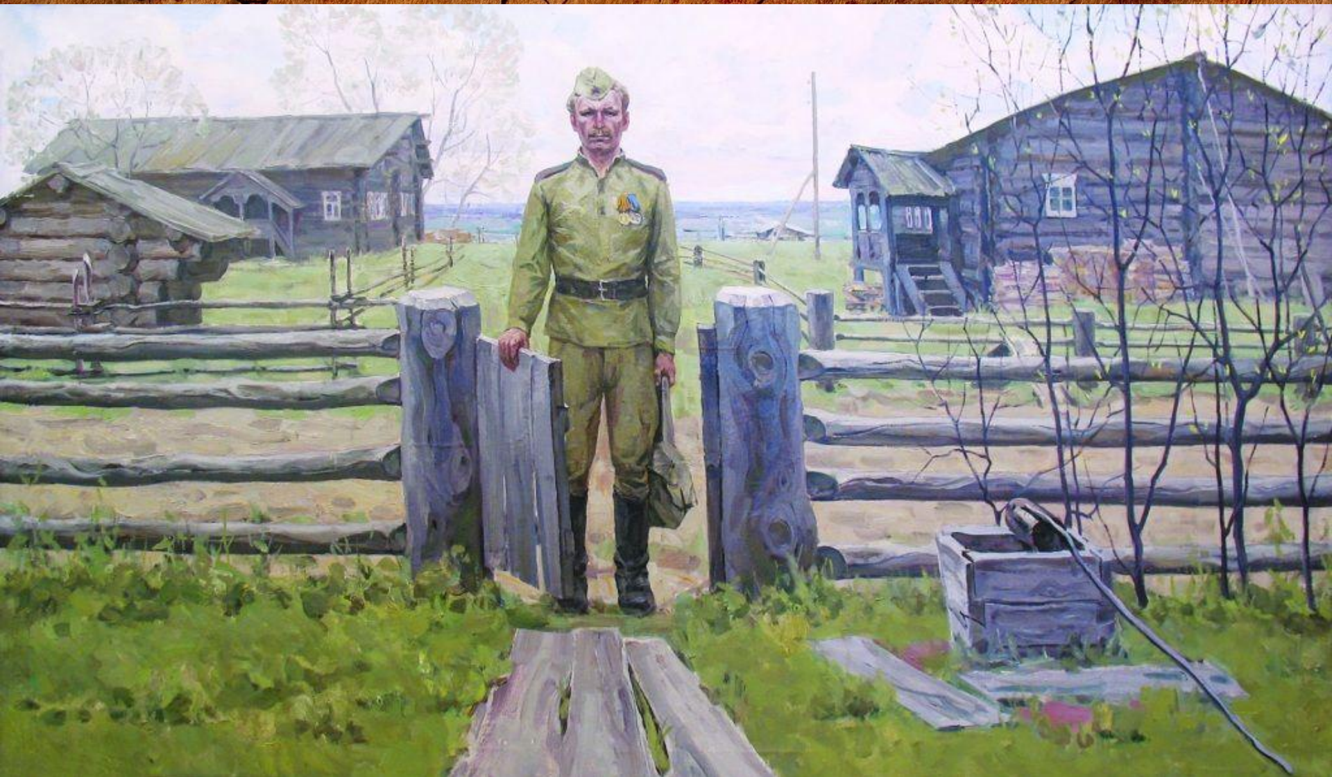
Р. Н. Ермолин «Май 1945»