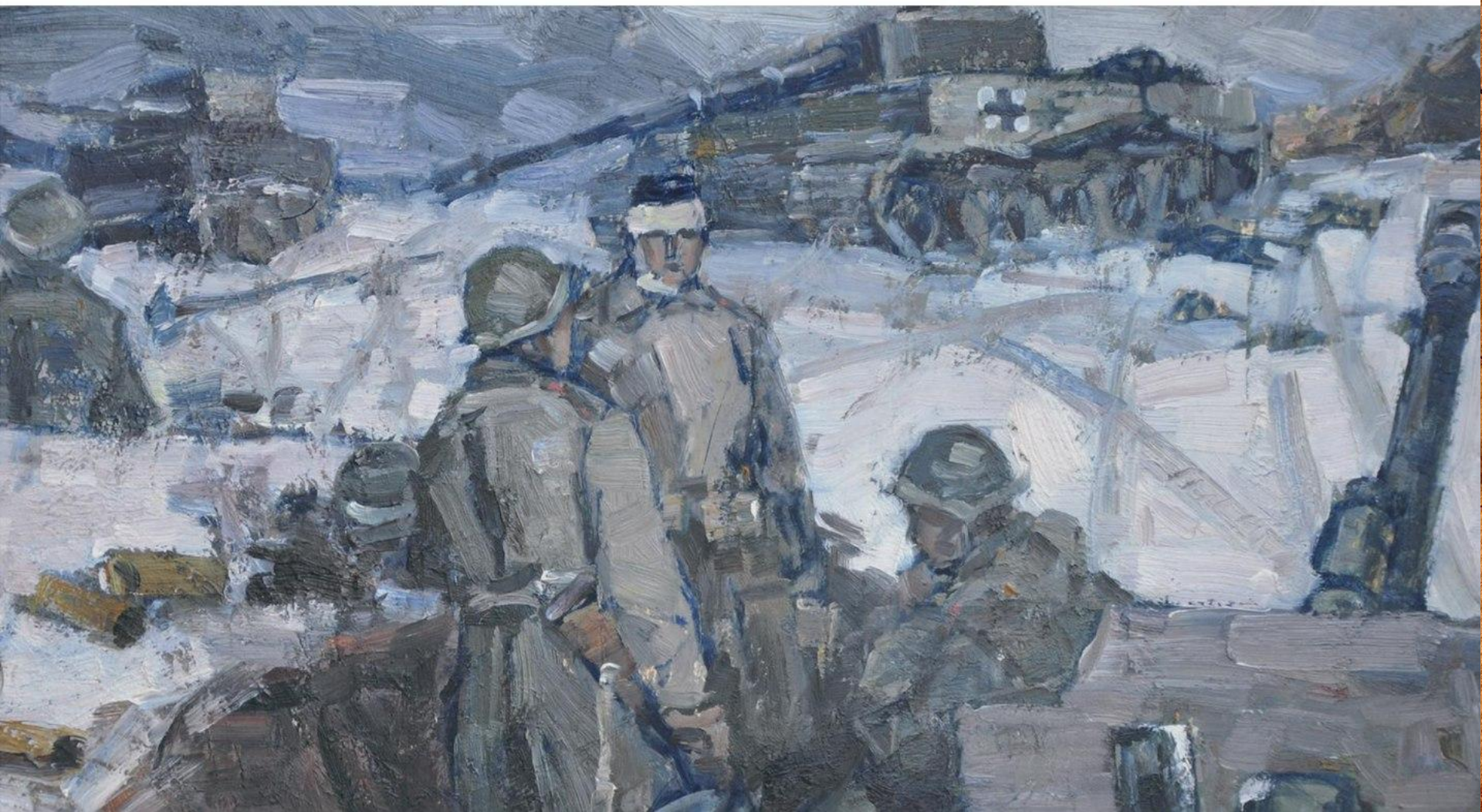
П.И. Семячков «Бой окончен»