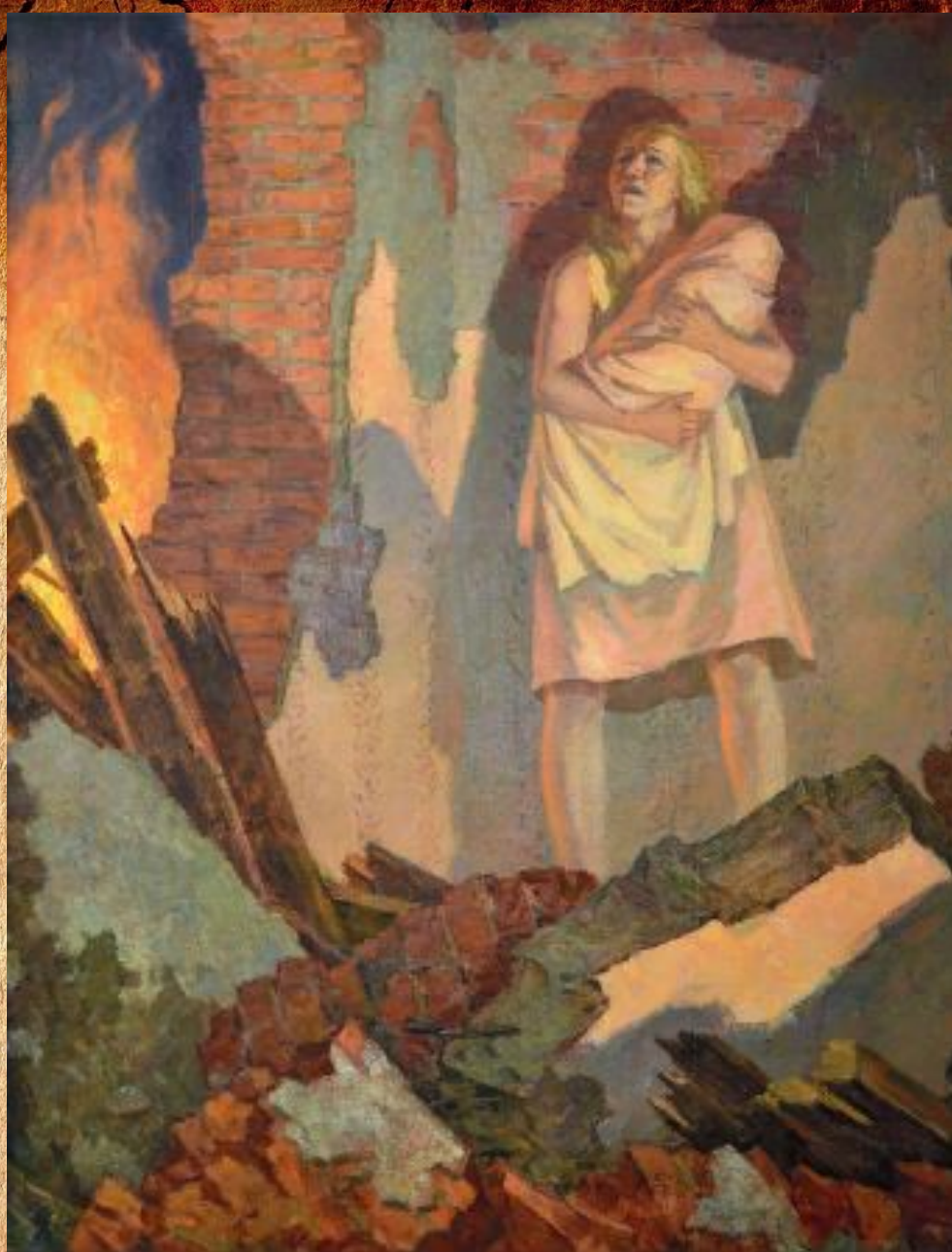
П.М. Митюшев «22 июня 1941 года»