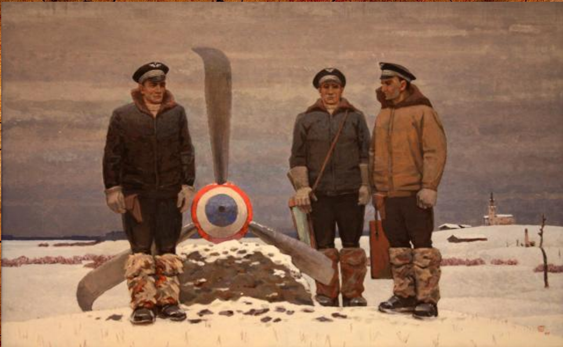
С.А. Добряков «На русской земле»