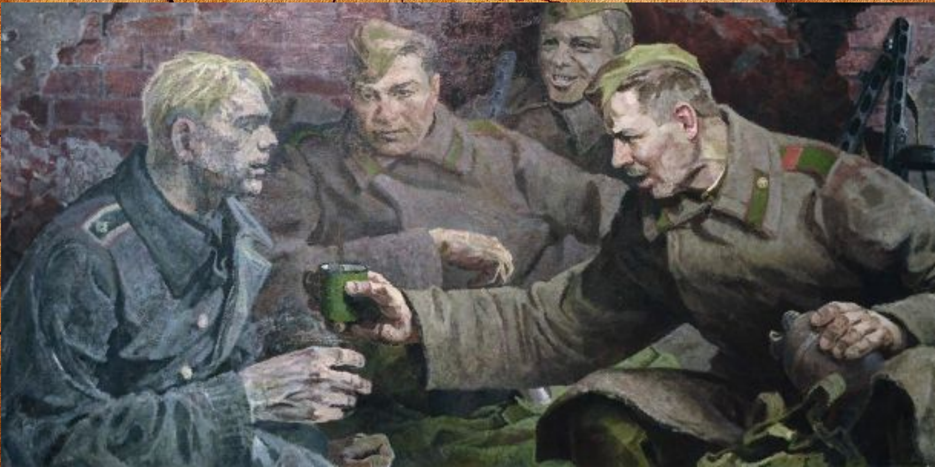
А.Н Безумов «Дороги войны»