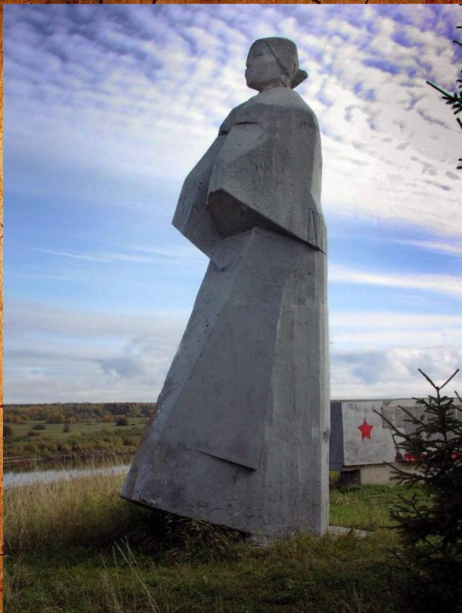
Ю.Г.Борисов «Ждущая. Ушедшим на фронт»