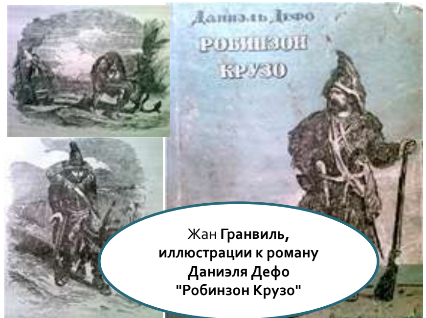
Жан Гранвиль, иллюстрации к роману Даниэля Дефо "Робинзон Крузо"