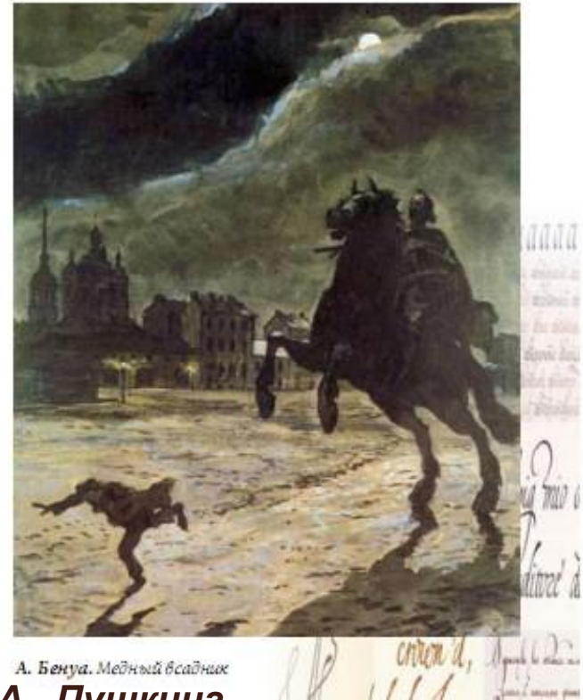
А. Бенуа. Медный всадник

В иллюстрациях А. Бенуа к произведениям А. Пушкина объединились большая эрудиция и безупречный вкус. Рисунки Бенуа к «Пиковой даме», «Медному всаднику», «Капитанской дочке» — явление высокой художественной культуры.