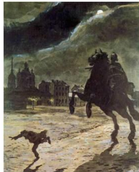
А. Бенуа. Медный всадник

В иллюстрациях А. Бенуа к произведениям А. Пушкина объединились большая эрудиция и безупречный вкус. Рисунки Бенуа к «Пиковой даме», «Медному всаднику», «Капитанской дочке» — явление высокой художественной культуры.