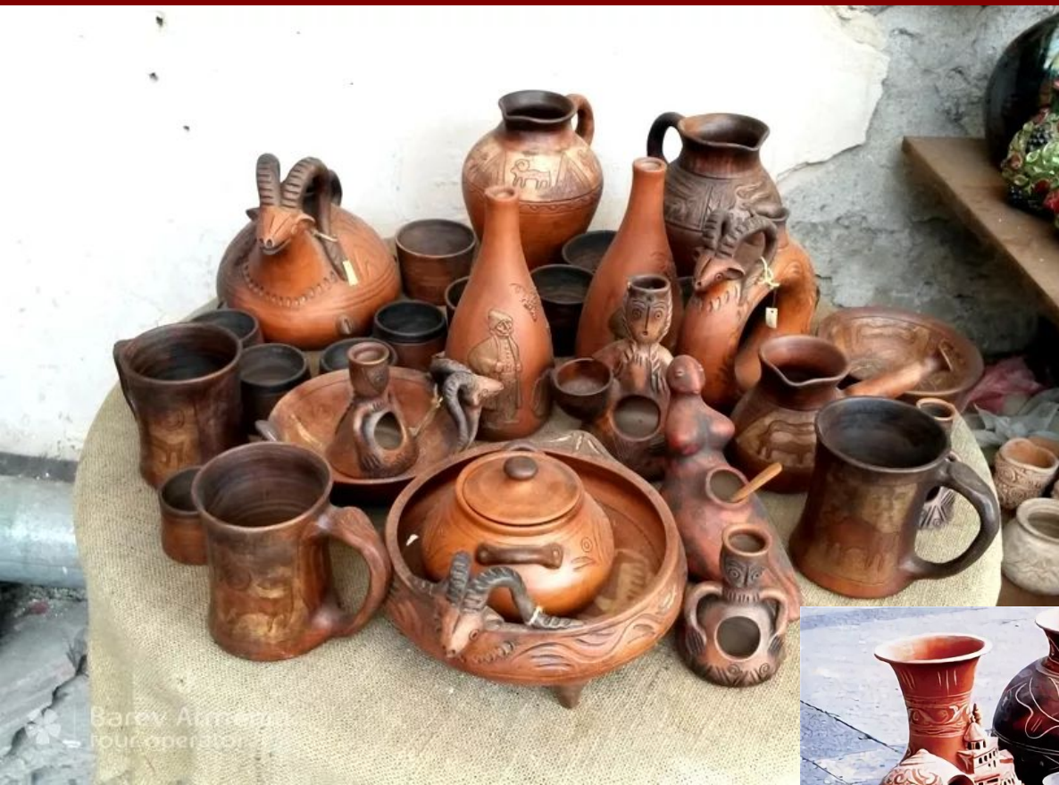
Bareilly four operators