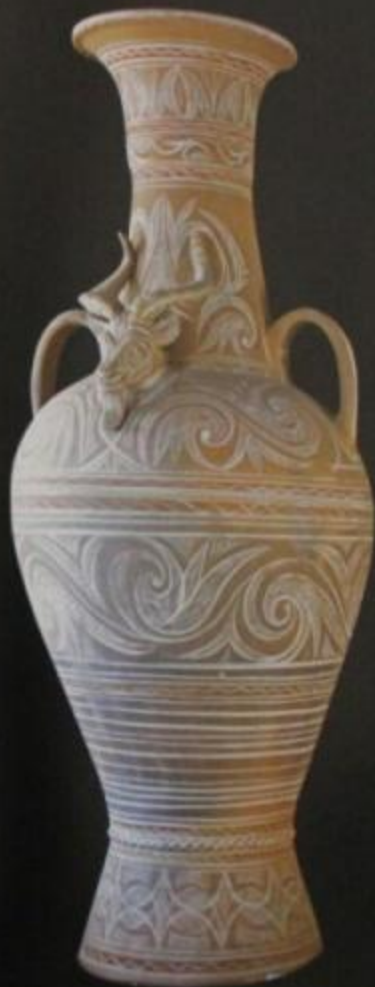
Декоративная высокая ваза

Сферные кувшины склеивают в нижней его части, сохраняя планую форму для бахадрием трех толщам лопатки. Высокий под острым углом к вертикали отполированный верх кувшина визуально уравнивает его ручку. После хит