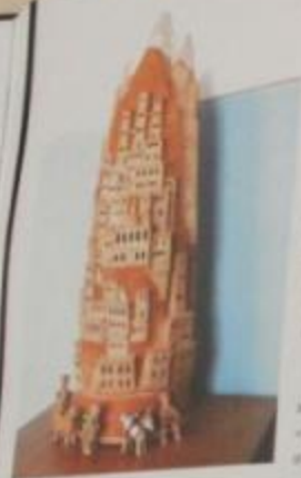
Декоративная высокая ваза