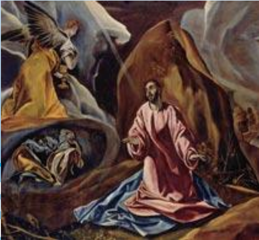
Эль Греко "Христос на Масличной Горе", 1605. Национ. гал., Лондон

Маньеризм (итал. manierismo, от maniera — манера, стиль), направление в западноевропейском искусстве 16 в., отразившее кризис гуманистической культуры Возрождения. Внешне следуя мастерам Высокого Возрождения, произведения маньеристов отличаются усложненностью, напряженностью образов, манерной изощренностью формы, а нередко и остротой художественных решений .