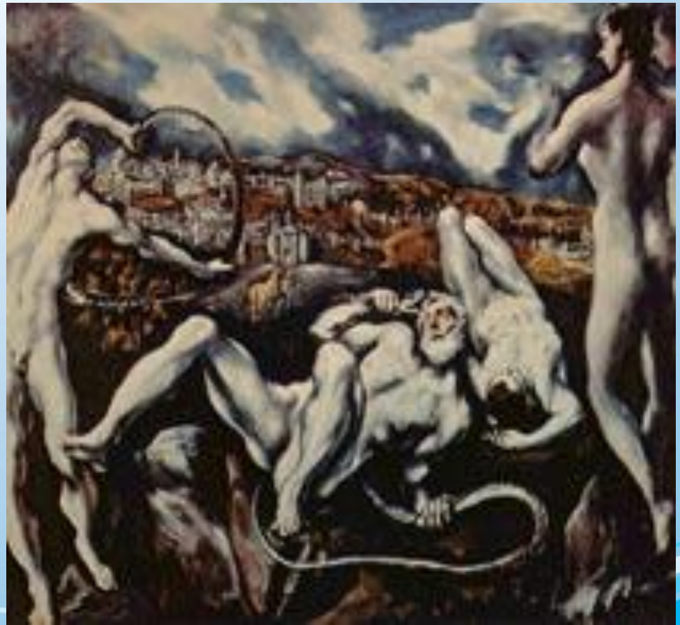
Эль Греко "Лаокоон", 1604-1614

Маньеризм охватывал различные виды художественного творчества – архитектуру, живопись, скульптуру, декоративно – прикладное искусство.