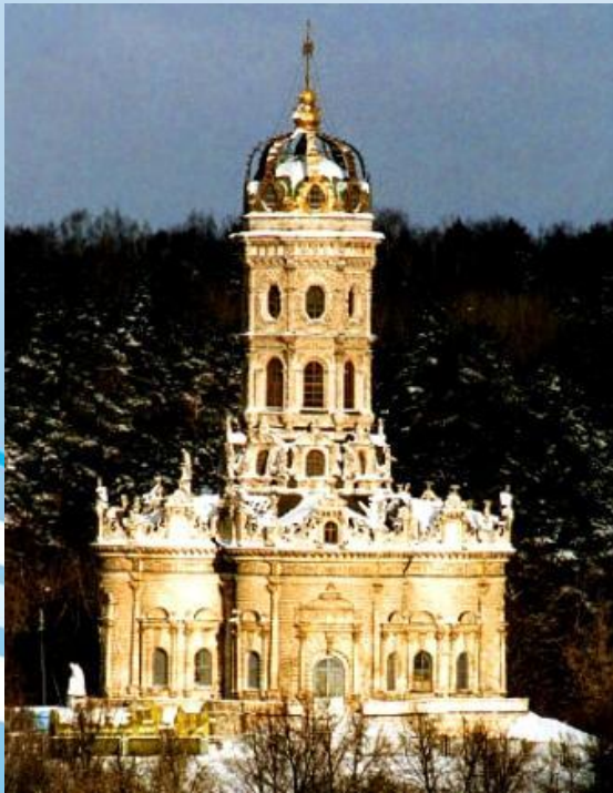
Церковь Знамени Богородицы в Дубровицах. 1690-1704. Москва.

Основные черты барокко - парадность, торжественность, пышность, динамичность, жизнеутверждающий характер. Искусству барокко свойственны смелые контрасты масштабов, света и тени, цвета, совмещение реальности и фантазии.