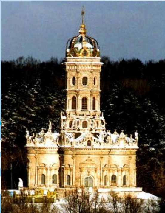
Церковь Знамения Богородицы в Дубровицах. 1690-1704. Москва.

Основные черты барокко - парадность, торжественность, пышность, динамичность, жизнеутверждающий характер. Искусству барокко свойственны смелые контрасты масштабов, света и тени, цвета, совмещение реальности и фантазии.