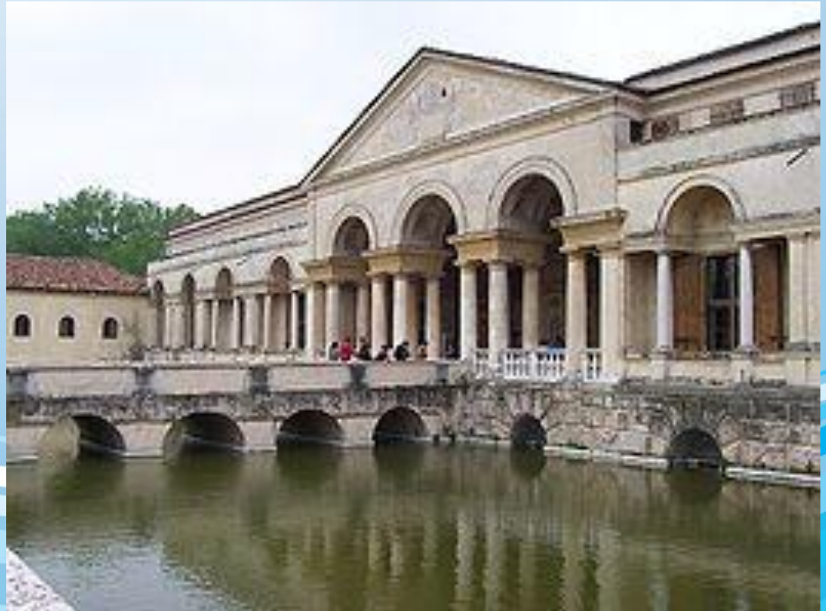
Палаццо дель Те в Мантуе