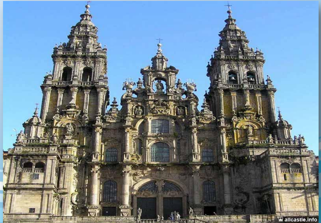
Кафедральный собор Сантьяго-де-Компостела