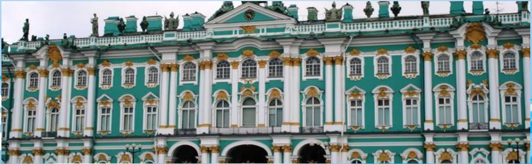
Зимний дворец в Санкт-Петербурге (1754-1762) - шедевр Бартоломео Франческо Растрелли