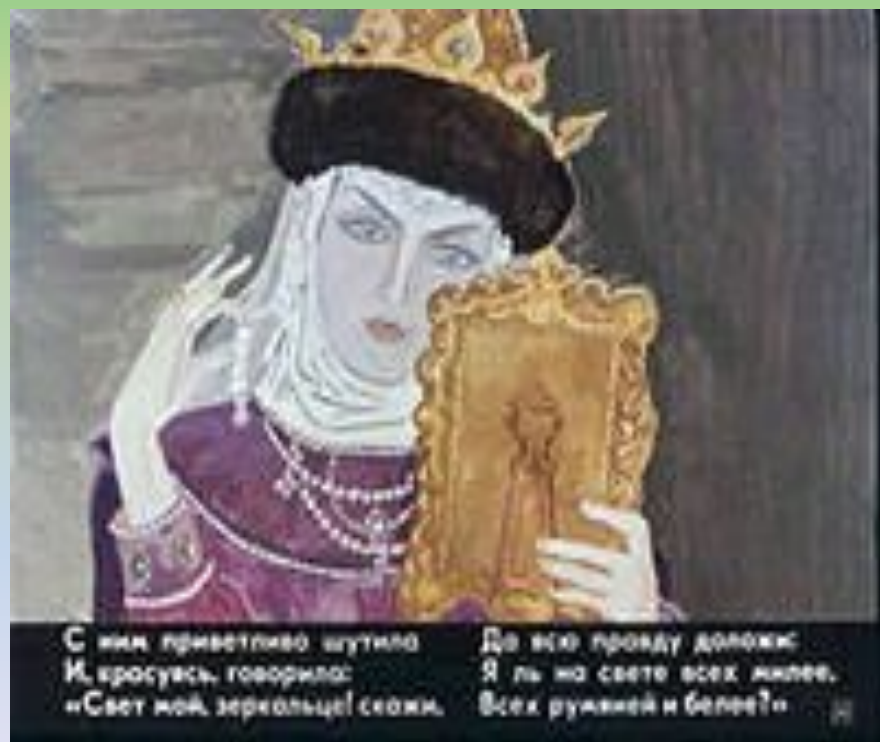
Молодая царица из сказки А.С.Пушкина