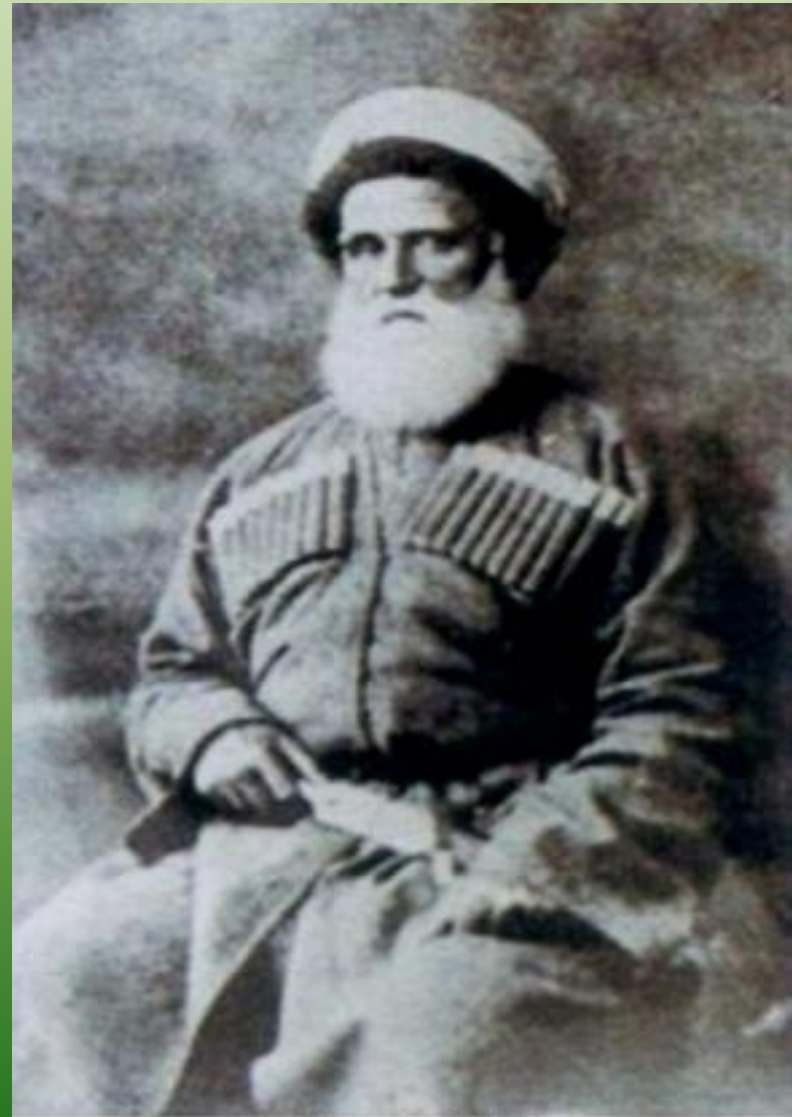
ünlü Ubyh Lideri Giranduk Berzeg

Территория современной Адыгеи была населена издревле. В Майкопском районе расположена Абадзехская палеолитическая стоянка, имеются памятники археологии эпохи неолита, энеолита. Большую известность получила Майкопская археологическая культура ранней бронзы. Позже появились катакомбная культура, северокавказская культура. В горных районах известны мегалитические памятники — дольмены. Известность получили уникальные находки скифо-меотского периода, сделаны при раскопках курганов близ аула Уляп Красногвардейского района.