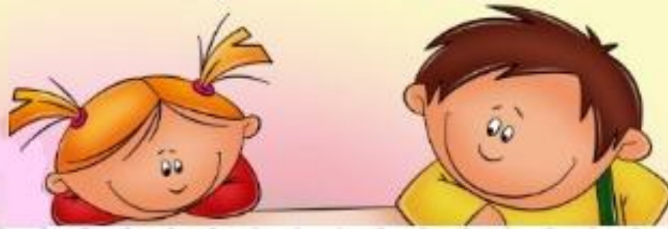
«Бабочки - красавицы»