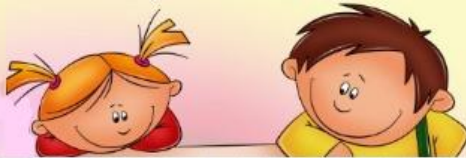
«Корзина с фруктами»