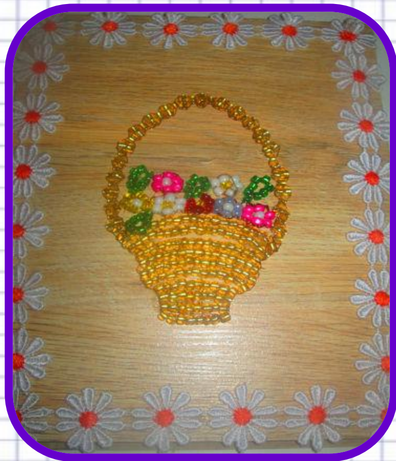
«Ваза с цветами для мамочки»