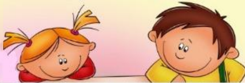
«Бабочки - красавицы»