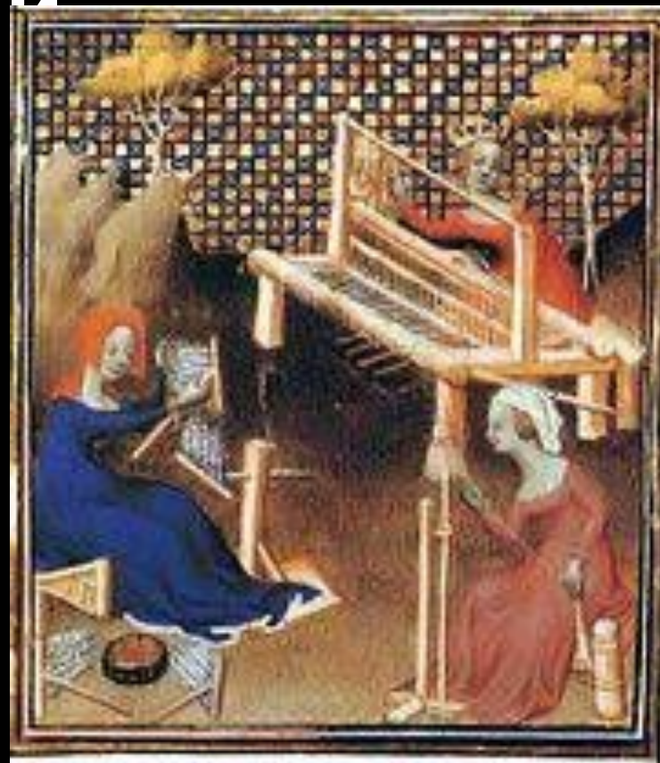
Женщины ткут, прядут и расчёсывают лён. Миниатюра из французской рукописи трактата Джованни Боккаччо «О знаменитых женщинах»