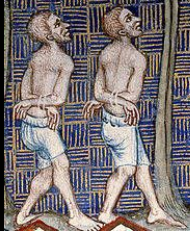
Фрагмент миниатюры из «Библии св. Женевьевы». 1370 год, Франция