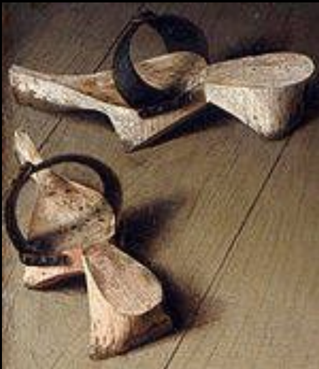
Туфли-patins. Фрагмент «Портрета четы Арнольфини» Яна ван Эйка, 1434