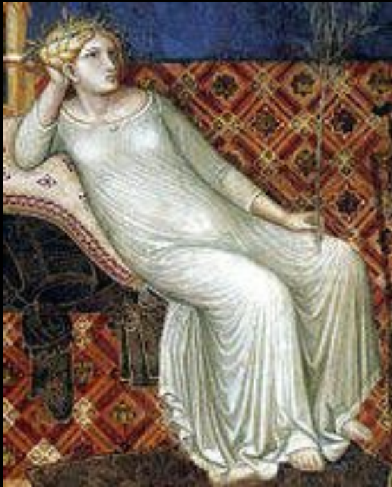
Женщина в камизе. Фрагмент фрески Амброджо Лоренцетти «Аллегория доброго правления», 1338—40 гг.