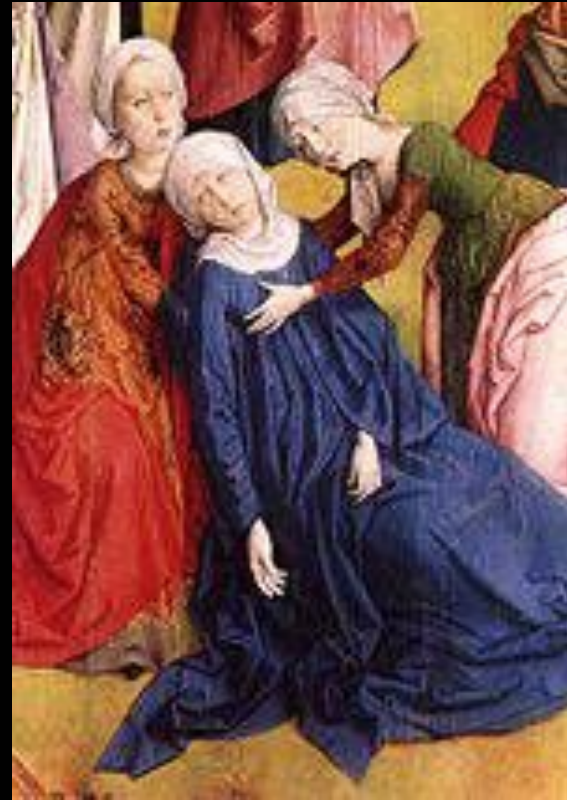
Дамы в котарди. Фрагмент «Триптиха Кальвани» Хуго ван дер Гуса, 1465—68 гг