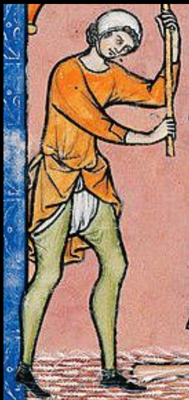
Фрагмент миниатюры из Библии Моргана, 1240-е годы, Франция