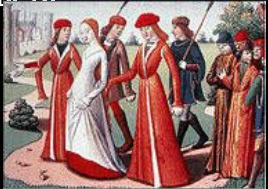
Жанна д'Арк и её судьи. Миниатюра из «Вигилий на смерть короля Карла VII» Марциала Оверньского. XV век