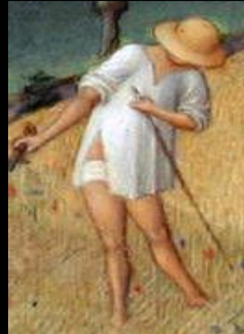
Жнец в камизе. Фрагмент миниатюры «Июнь» Поля Лимбурга из «Великолепного часослова герцога Беррийского», 1412—16 гг.