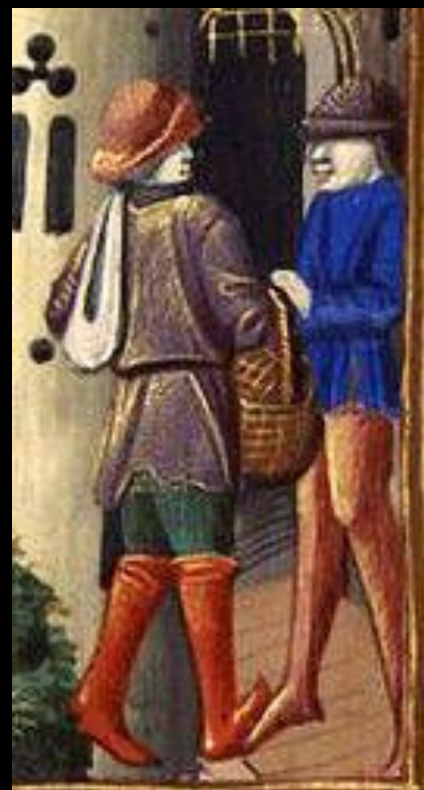
Фрагмент миниатюры из французской рукописи «Вигилий на смерть короля Карла