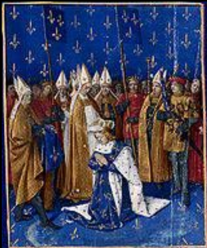
Миниатюра, изображающая коронацию короля Франции Карла VI. Миниатюра из «Больших французских хроник» Жана Фуке. XV век