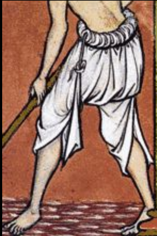
Фрагмент миниатюры из «Библии Моргана», 1240-е годы, Франция