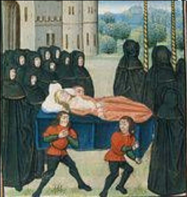
Погребение Анны Чешской. Миниатюра из французской рукописи «Хроник» Жана Фруассара, ок. 1483