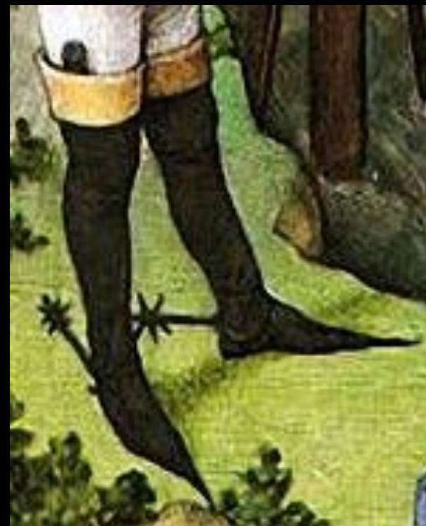
Высокие пулены со шпорами для верховой езды. Фрагмент миниатюры Бартеlemi д'Эйка из рукописи «Книги любви» Рене Анжуйского, 1460—67 гг.