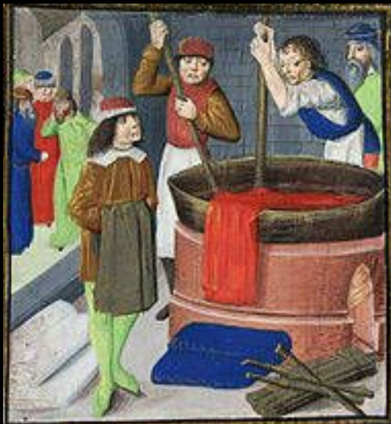
Крашение ткани. Миниатюра из фламандской рукописи трактата Бартоломея Английского «О свойствах вещей», 1482