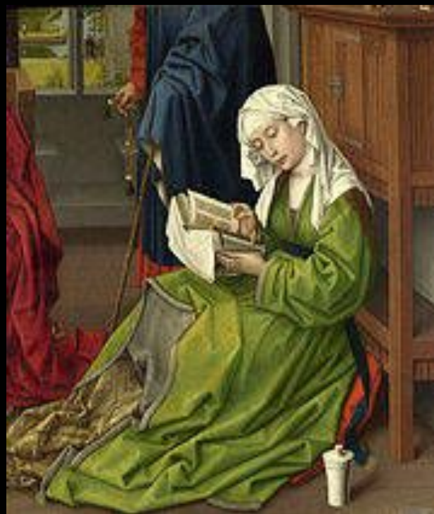
Мария Магдалина в уппеланде на запрестольном образе Рогера ван дер Вейдена «Читающая Мария Магдалина[ru]», до 1438 г.