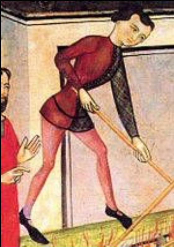
Мужчина в котарди. Фрагмент алтаря св. Викентия в Эстамариу, вторая половина XIV века