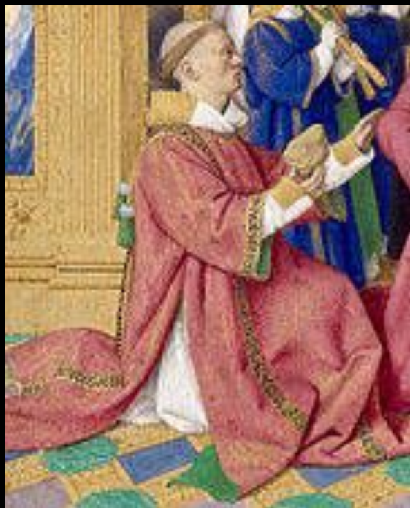
Св. Этьен в уппеланде. Фрагмент миниатюры из «Часослова Этьена Шевалье» Жана Фуке. 1452—60 гг