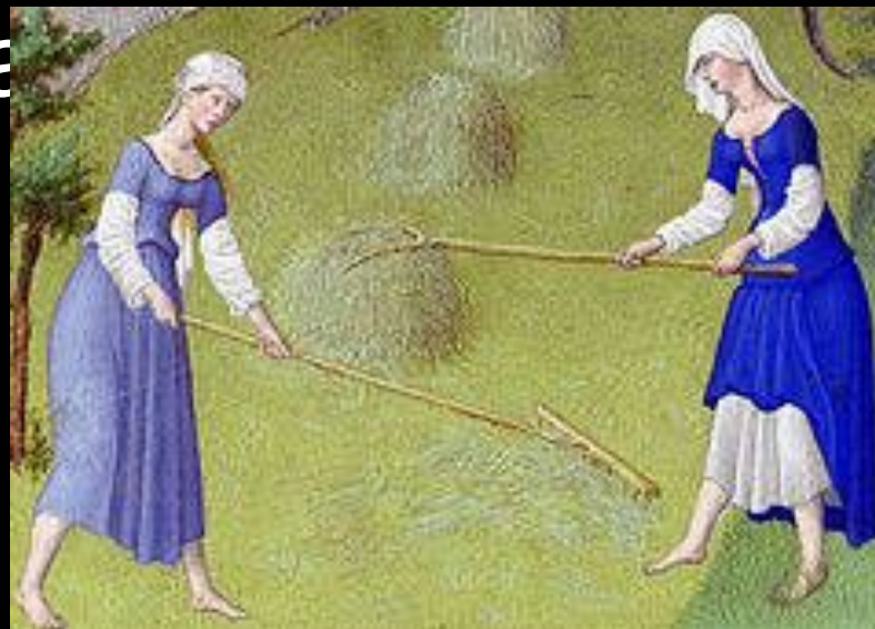
Косарки в коттах. Фрагмент миниатюры «Июнь»