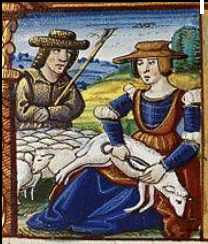
Стрижка овец. Миниатюра из часослова Жана де Люка, 1524 год