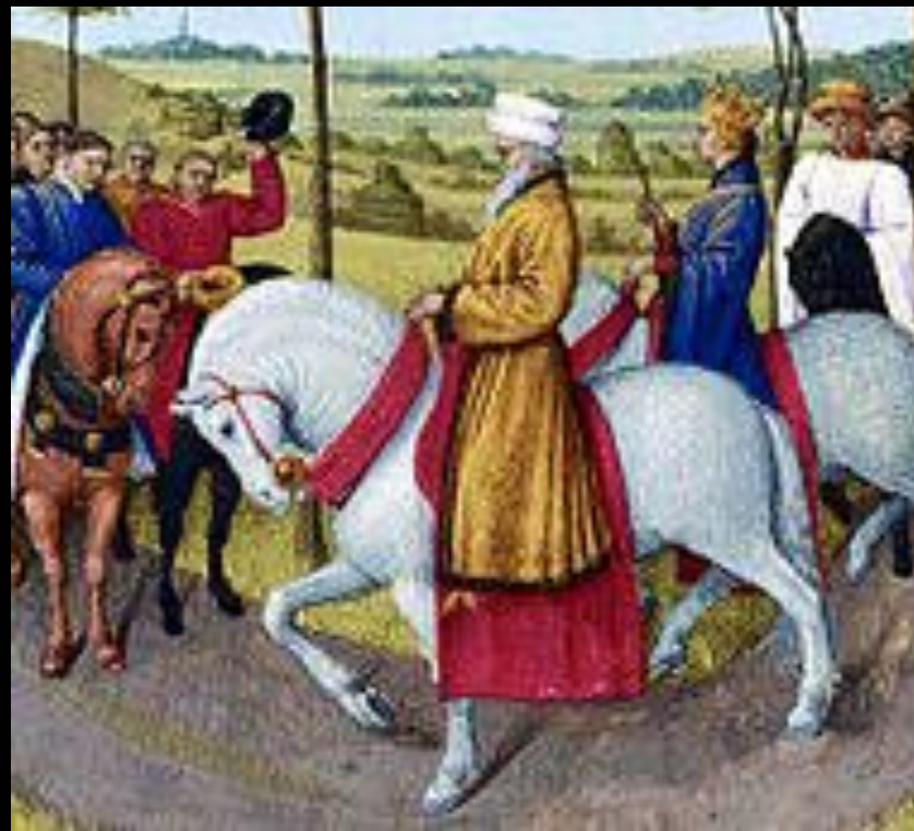
Император Карл IV. Миниатюра из «Больших французских хроник» Жана Фуке. XV век