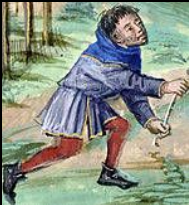
Охотник, на котором надета синяя котта. Фрагмент миниатюры из «Les Livres du roy Modus et de la royne Ratio»