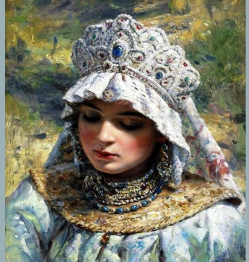
Константин Егорович Маковский «Русская красавица в кокошнике»