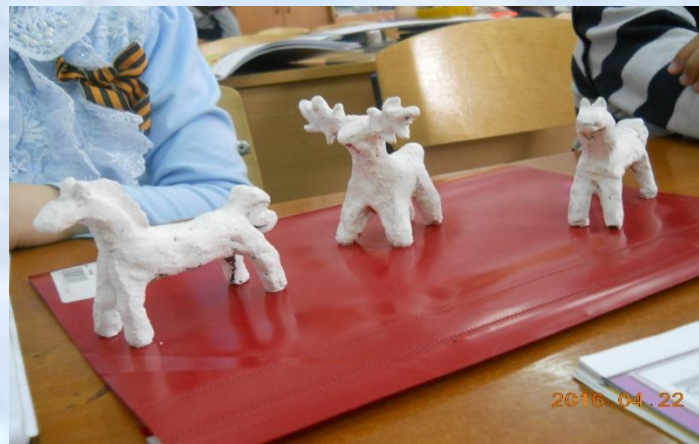
Поэтапное выполнение игрушки: лепка и грунтовка