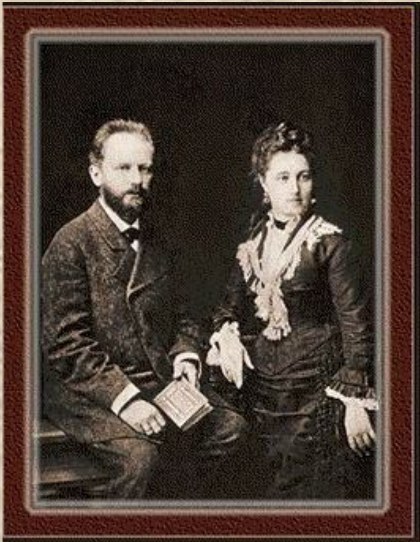
П. И. Чайковский с женой Антониной Ивановной (урожденной Милюковой).

Одной из отличительных черт творчества Чайковского этого периода было обращение к музыкальному фольклору разных народов. Так, он использует сербские напевы в сочинениях, посвященных событиям войны на Балканах (Славянский марш). Украинские напевы использованы в знаменитом Первом концерте для фортепиано с оркестром. В балет "Лебединое озеро" композитор ввел целую сюиту из танцев разных народов.