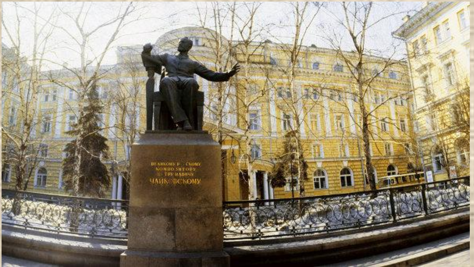
Московская консерватория им. П.И.Чайковского