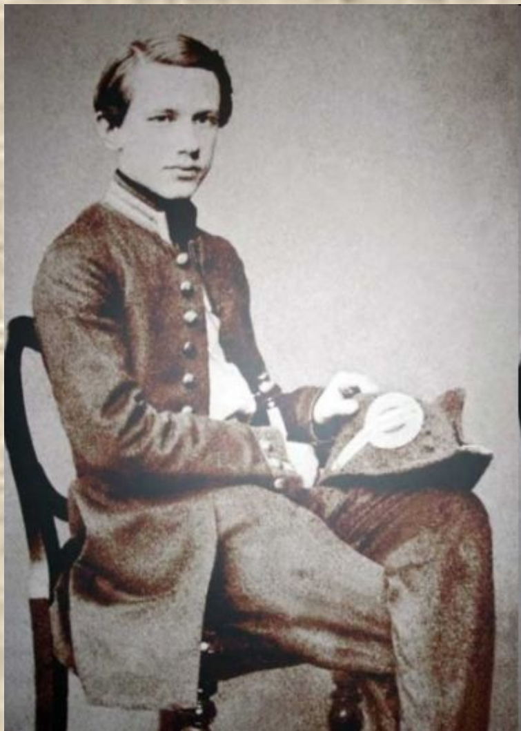
П.И.Чайковский в 19 лет.

С четырех лет проявилась музыкальная одаренность Чайковского, и его начали обучать игре на фортепиано. Тем не менее его отдали учиться в училище правоведения, готовя его в будущем к карьере юриста.