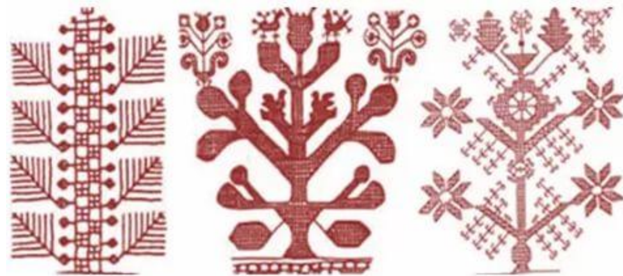
Образ «ДРЕВА ЖИЗНИ»