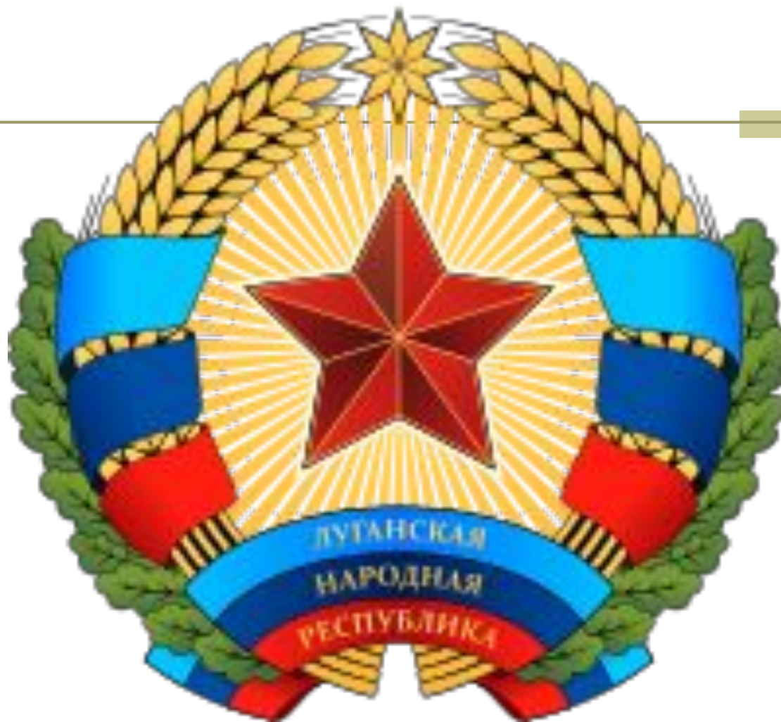
■ Герб ЛНР