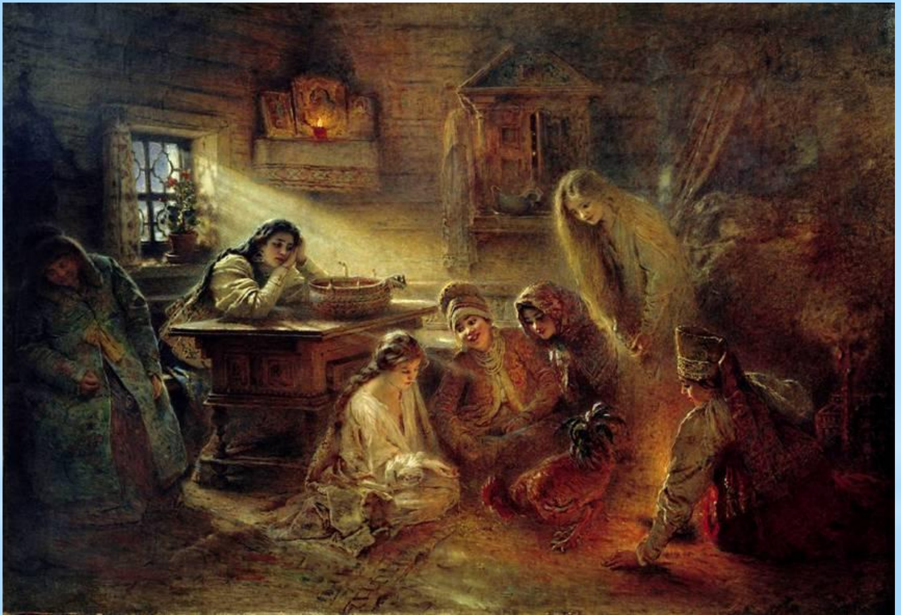
Композитор П.И. Чайковский. «Времена года». Декабрь. «СВЯТКИ»