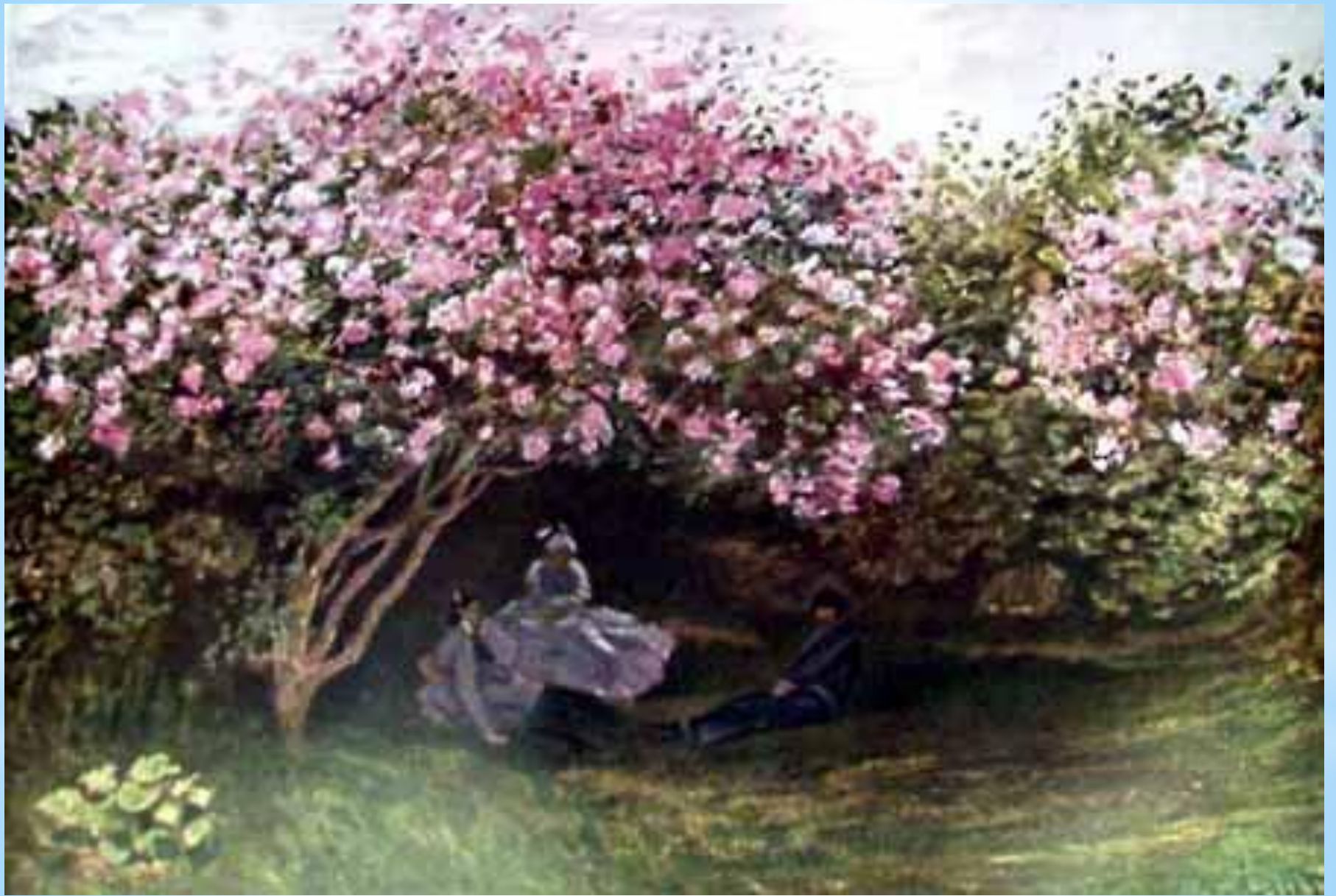
*Клод Моне. Отдых под сиренью.