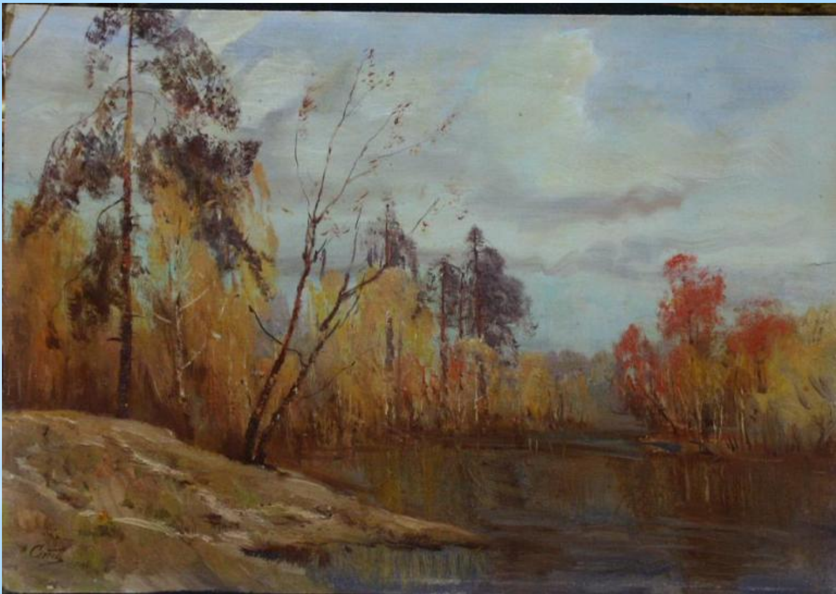
Композитор П.И. Чайковский. «Времена года». Октябрь. «Осенняя песнь»