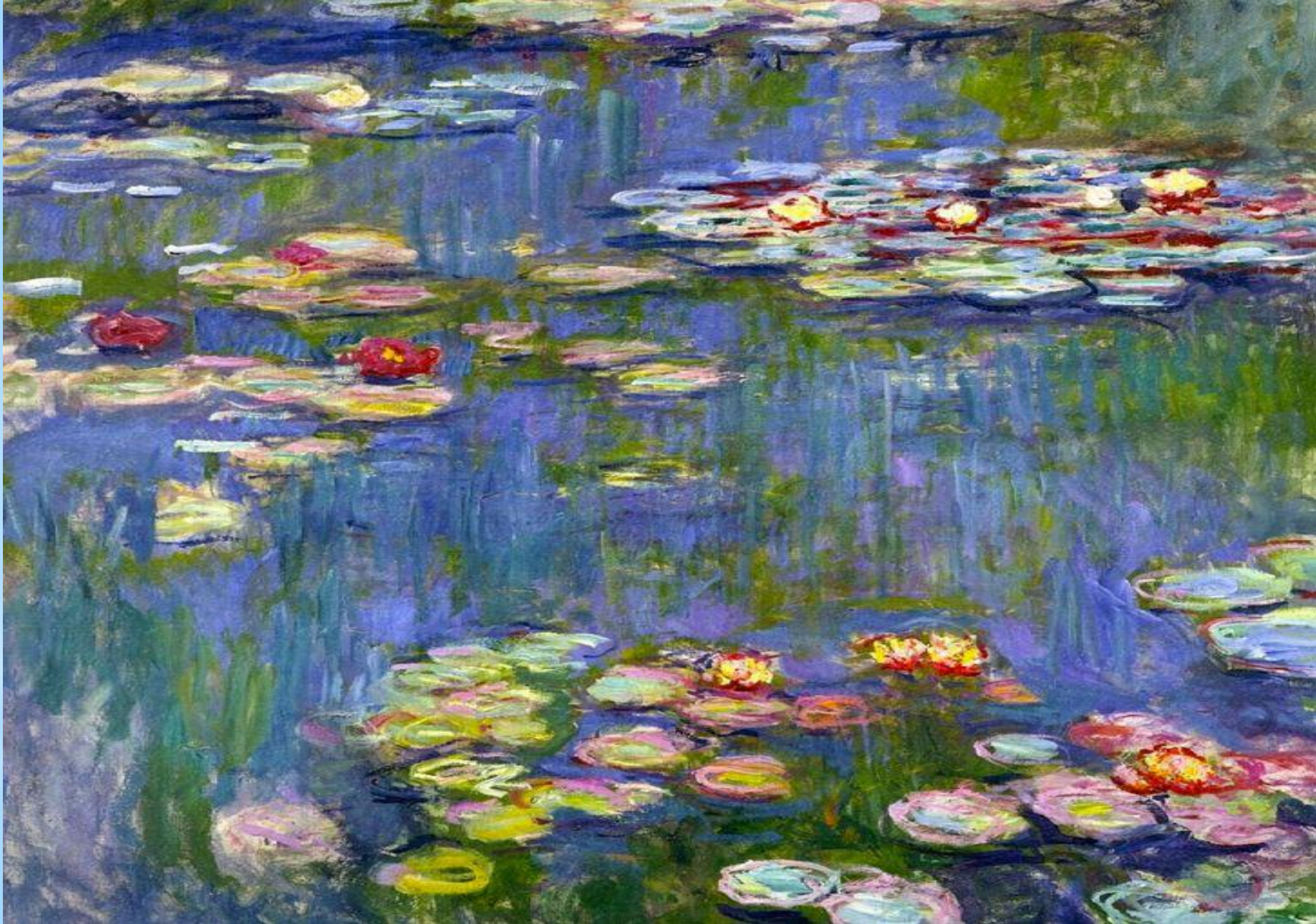
* Клод Моне. Кувшинки