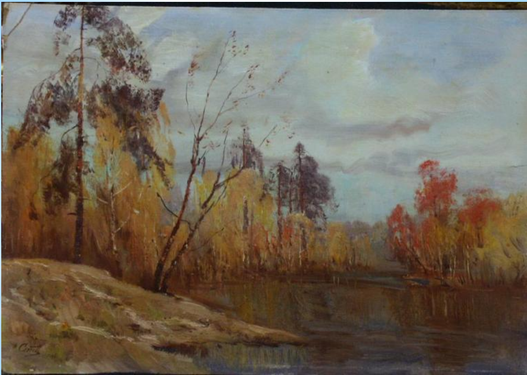
Композитор П.И. Чайковский. «Времена года». Октябрь. «Осенняя песнь»