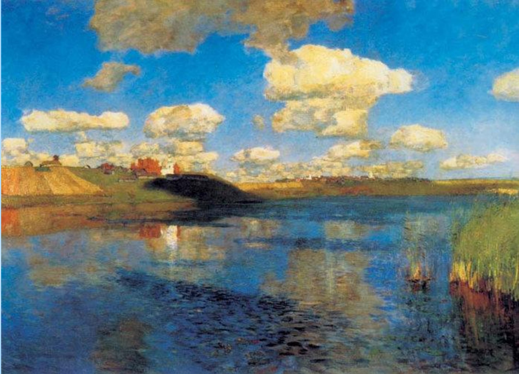
И. Левитан. Озеро. Русь.