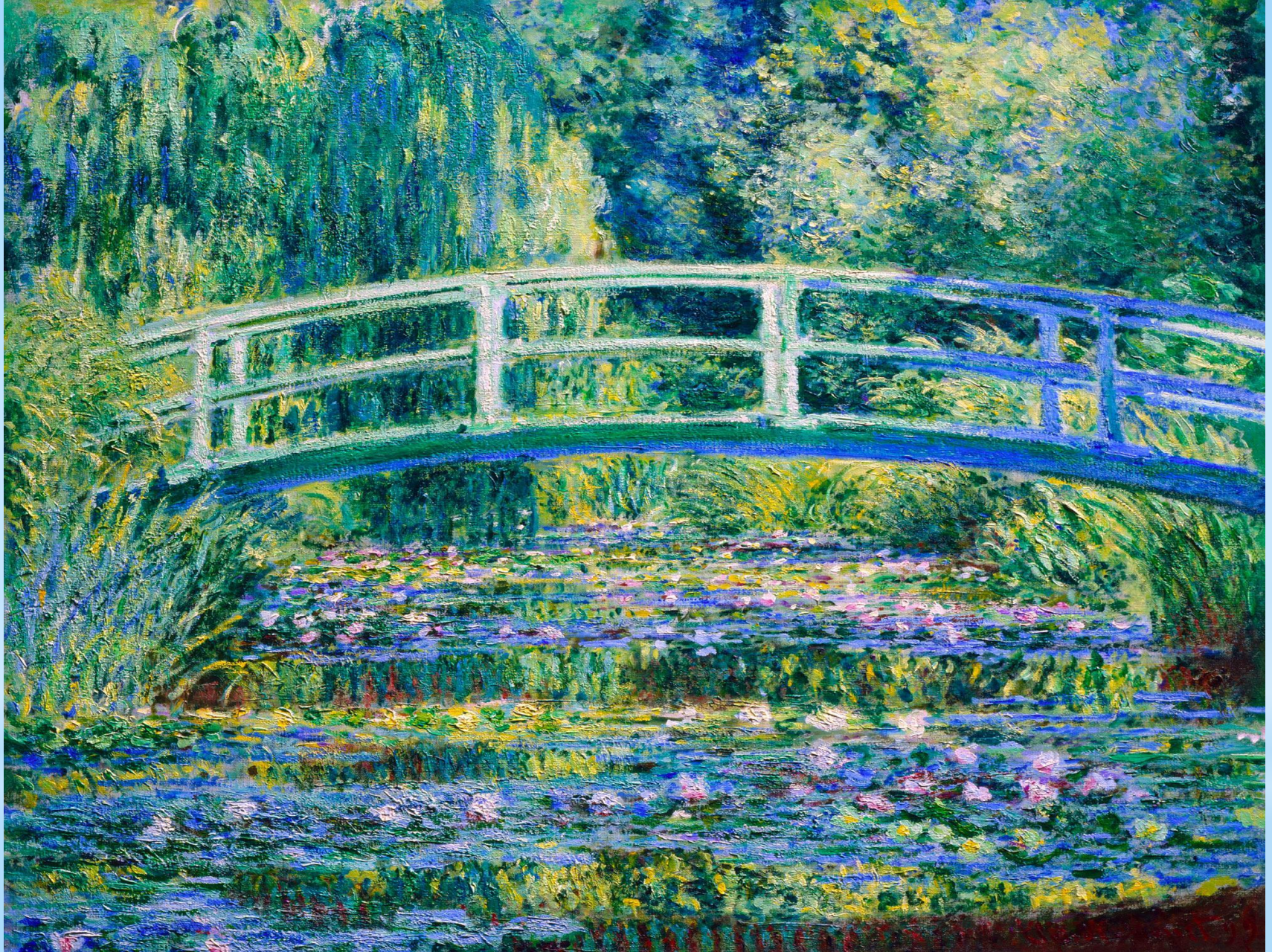
* Пруд с кувшинками.