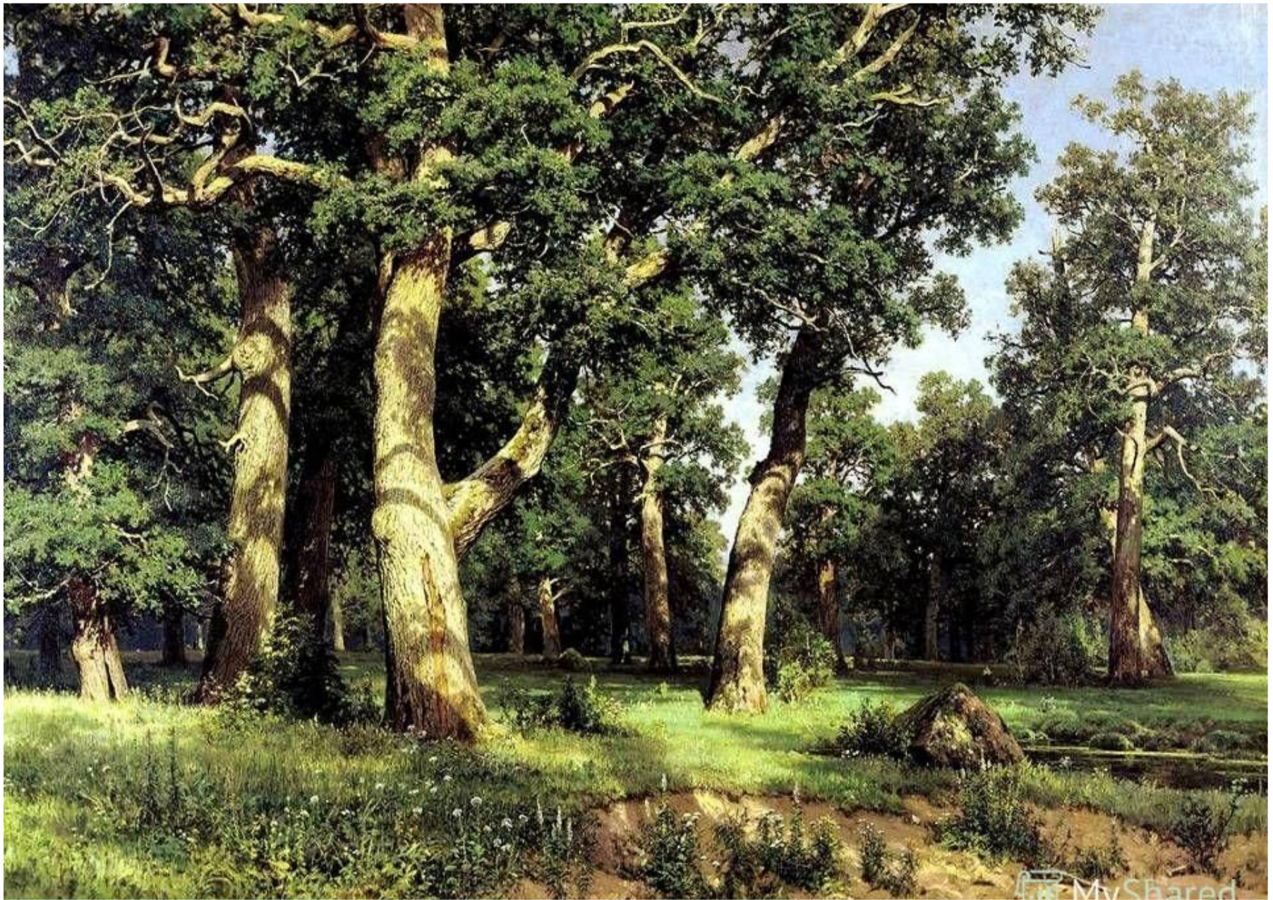
И. Шишкин. Дубовая роща