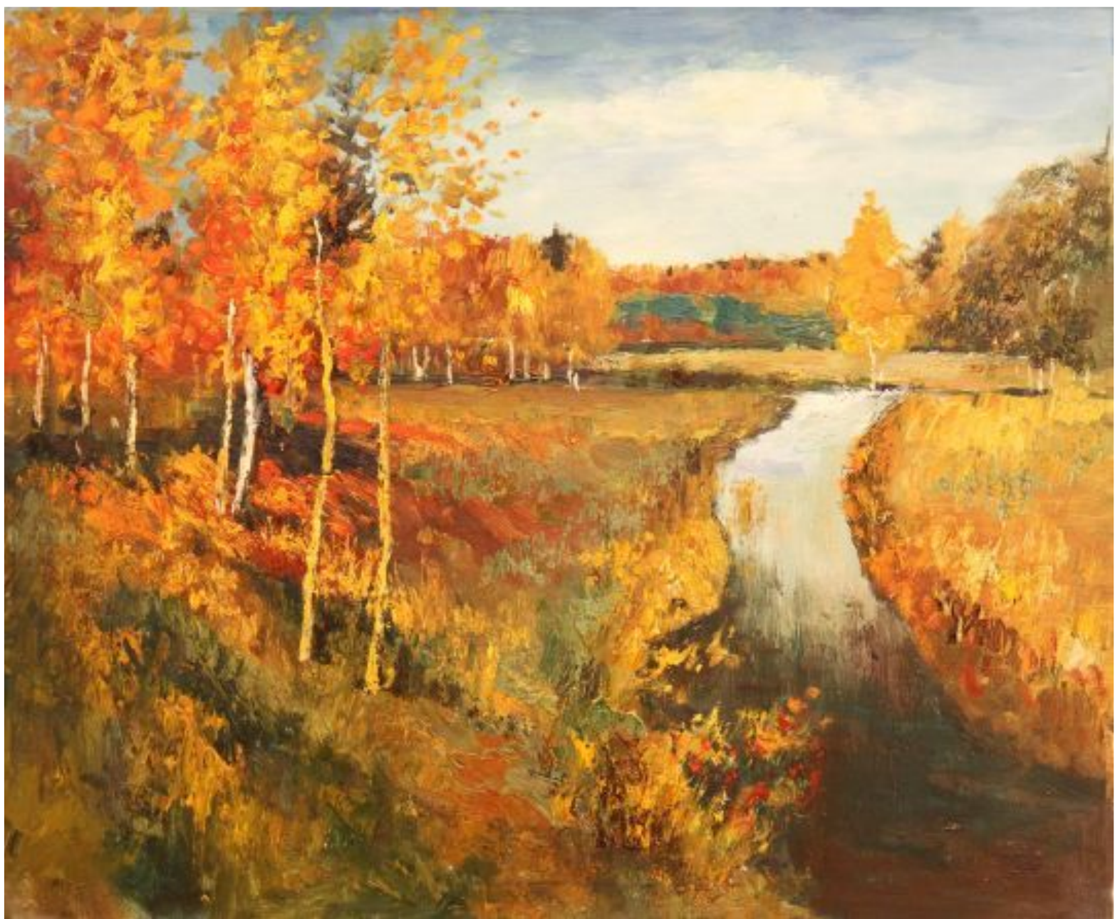
И. Левитан. Золотая осень