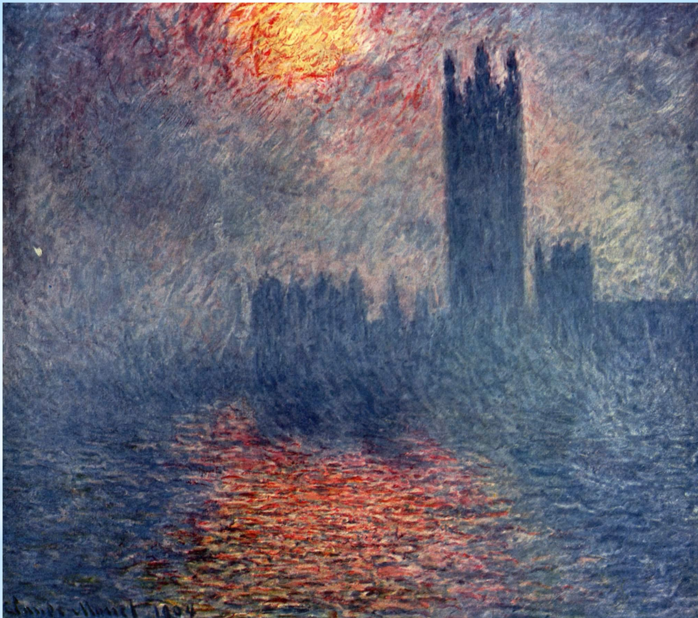
Клод Моне. Вестминстерское аббатство.