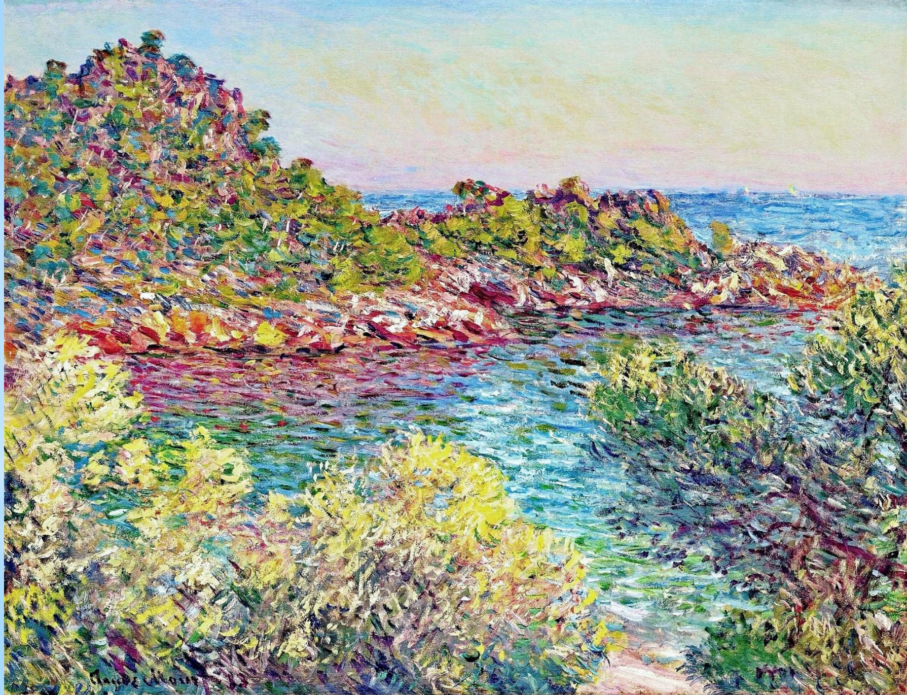
* Клод Моне. Пейзаж около Монте Карло.