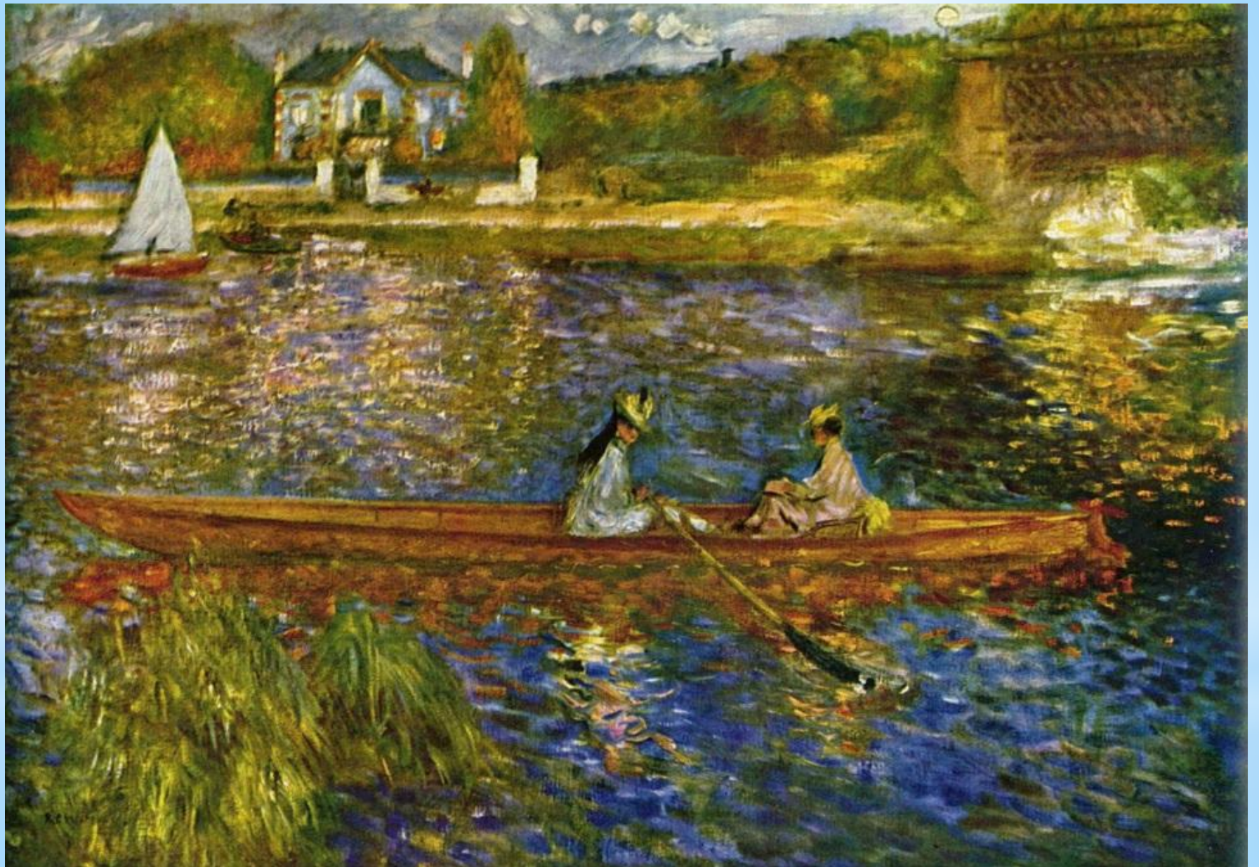
Клод Моне. Морские пейзажи.