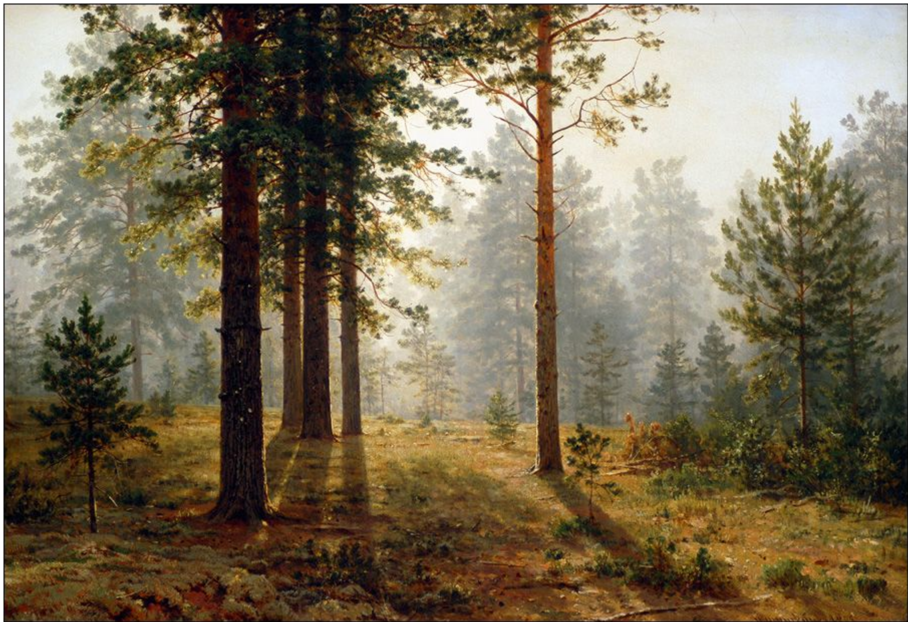
И. Шишкин. Утро в лесу