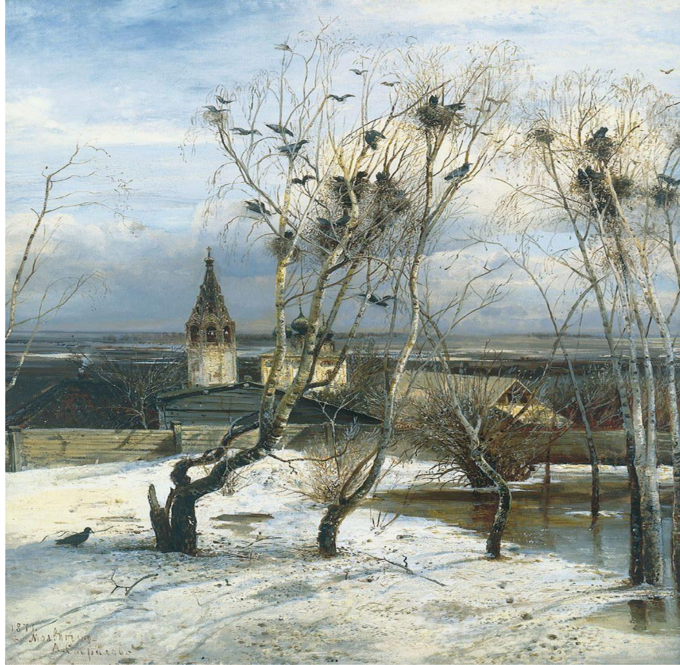
А. К. Саврасов. Грачи прилетели