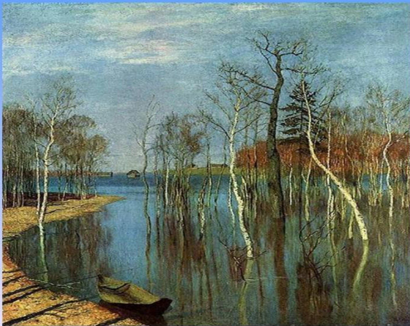
И. Левитан. «Весна. Большая вода»