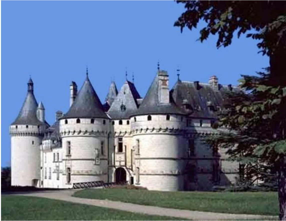
Замок Шомон, 10 век. Франция