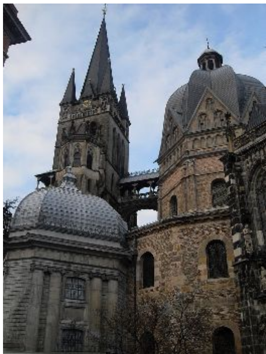
Капелла Карла Великого в Ахене