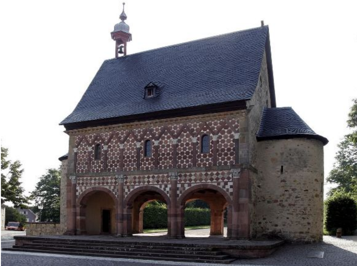
Бенедиктинское аббатство Лорш Основан в 852 году