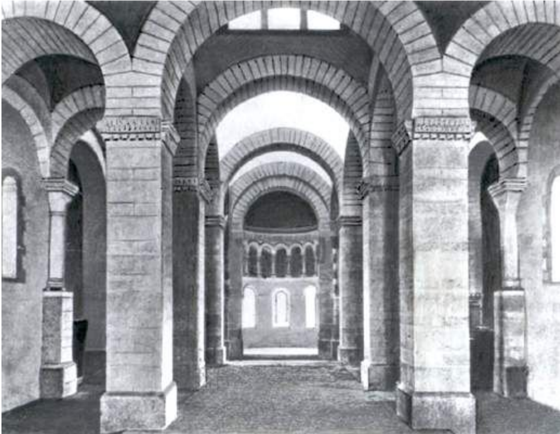
Ораторий в Жерминьи-де-Пре (Франция). После 806.