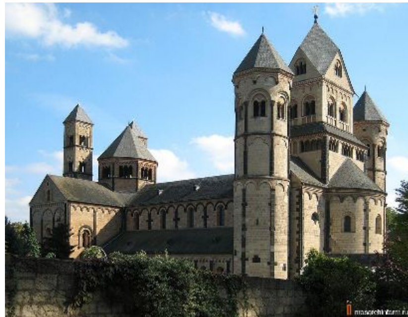
Аббатство Мария Лаах