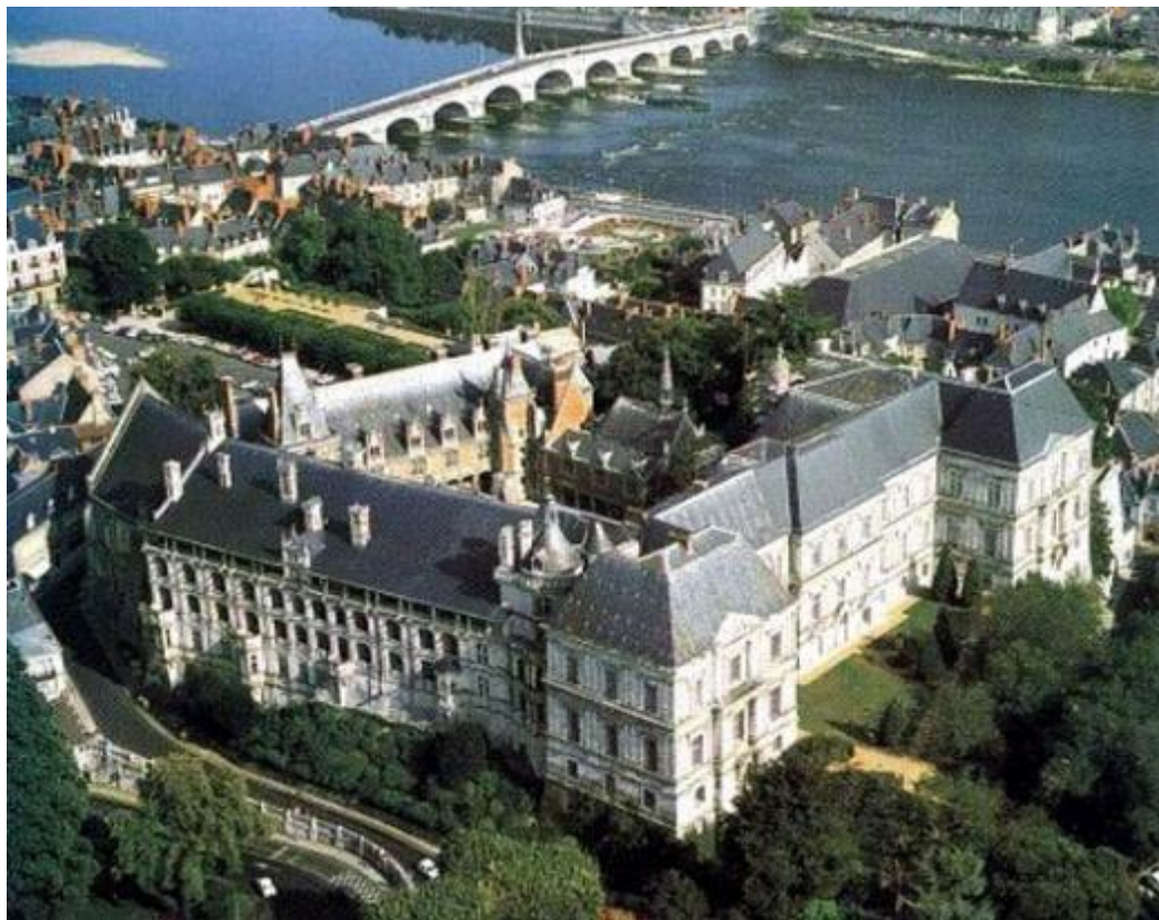
Замок Блуа, 9 век, Франция. Строители неизвестны.