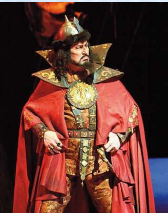
Сцена из оперы «Князь Игорь»