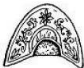
Кокошник. Владимирская губерния