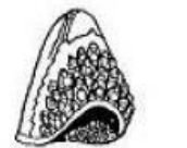
Кокошник. Псковская губерния