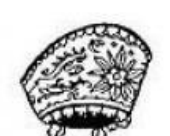
Кокошник. Московская губерния