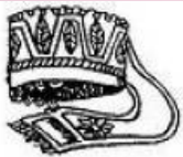
ДЕВИЧЬИ УБОРЫ Повязка