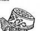
Кокошник. Олонецкая губерния