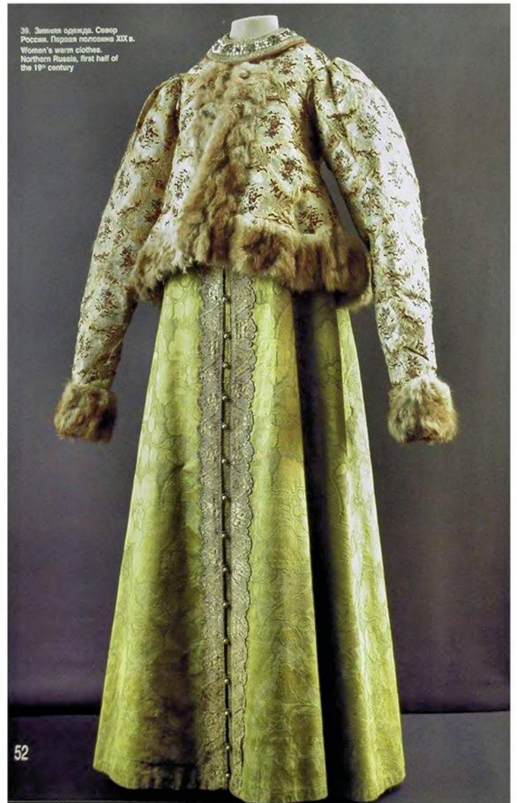
39. Зимняя одежда. Север России. Первая половина XIX в. Woman's warm clothes. Northern Russia, first half of the 19 th century