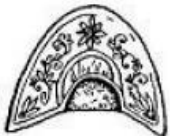
Кокошник. Владимирская губерния