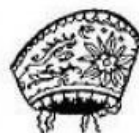
Кокошник. Московская губерния