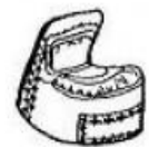
Кокошник. Курская губерния