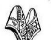
Кокошник. Курская губерния