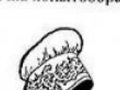
Кокошник. Орловская губерния