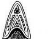
Кокошник. Нижегородская губерния