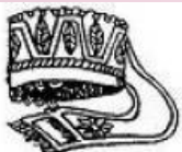
ДЕВИЧЬИ УБОРЫ Повязка