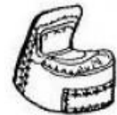
Кокошник. Курская губерния