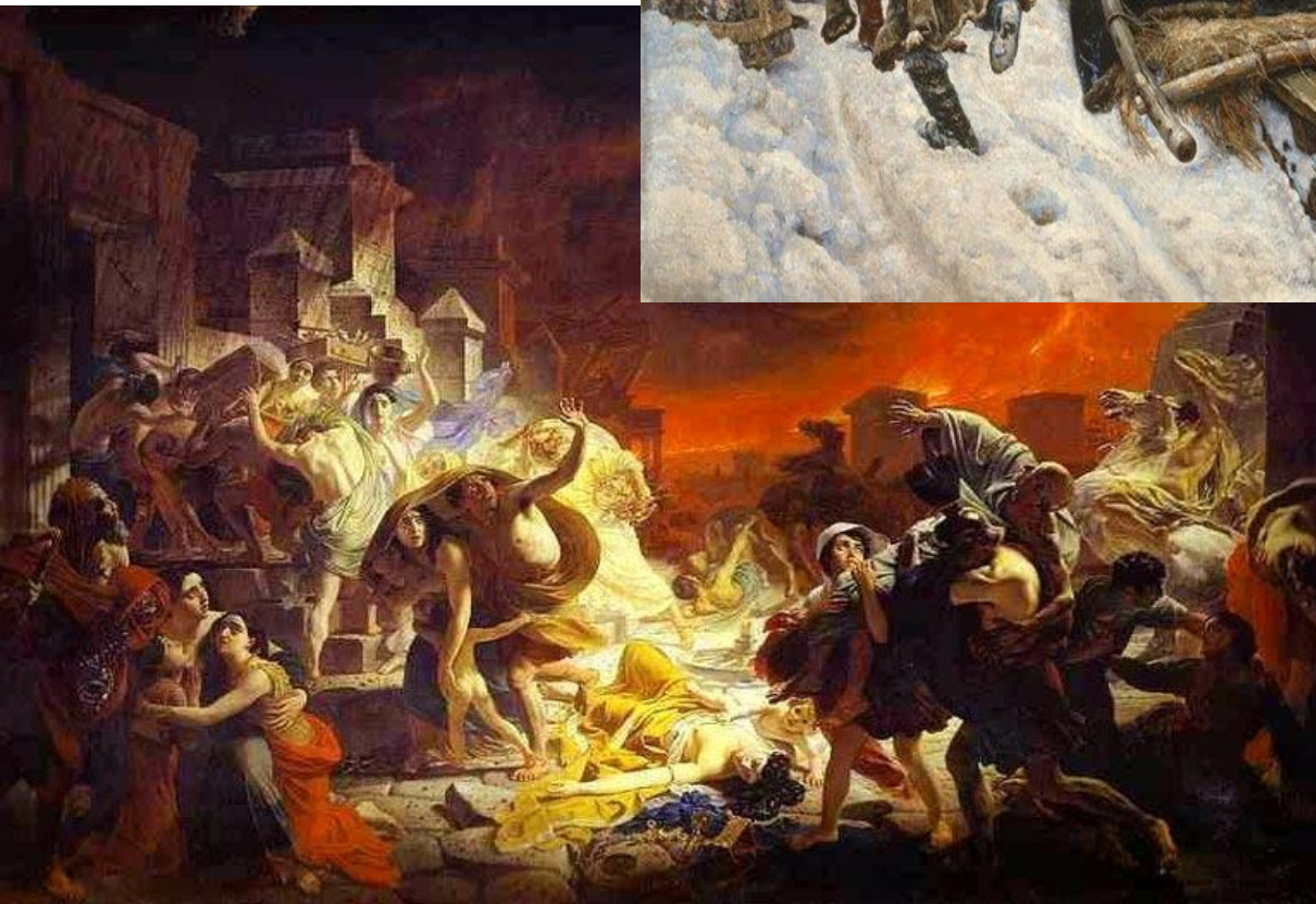
К. Брюллов «Последний день Помпеи» (1830)