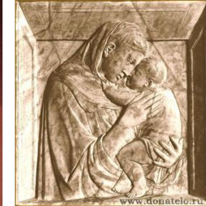
Донателло Мраморный рельеф «Мадонна Пацци» (1422)