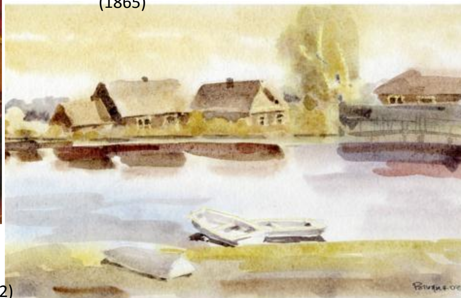
Е. Рындин. «Тишина». Акварель (2002)