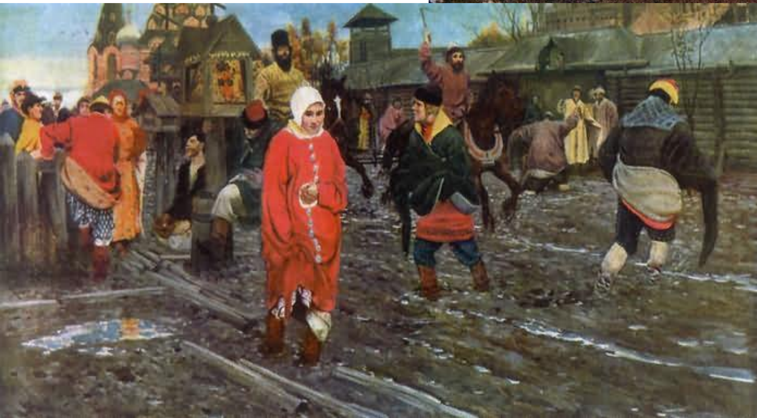
А.Рябушкин “Московская улица XVII века в праздничный день”. (1901)