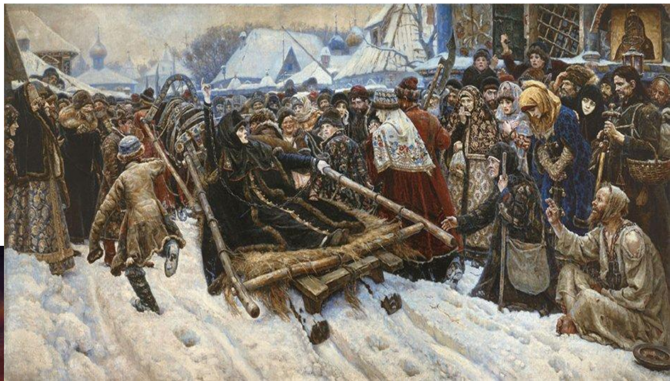
В. Суриков «Боярыня Морозова» (1883)