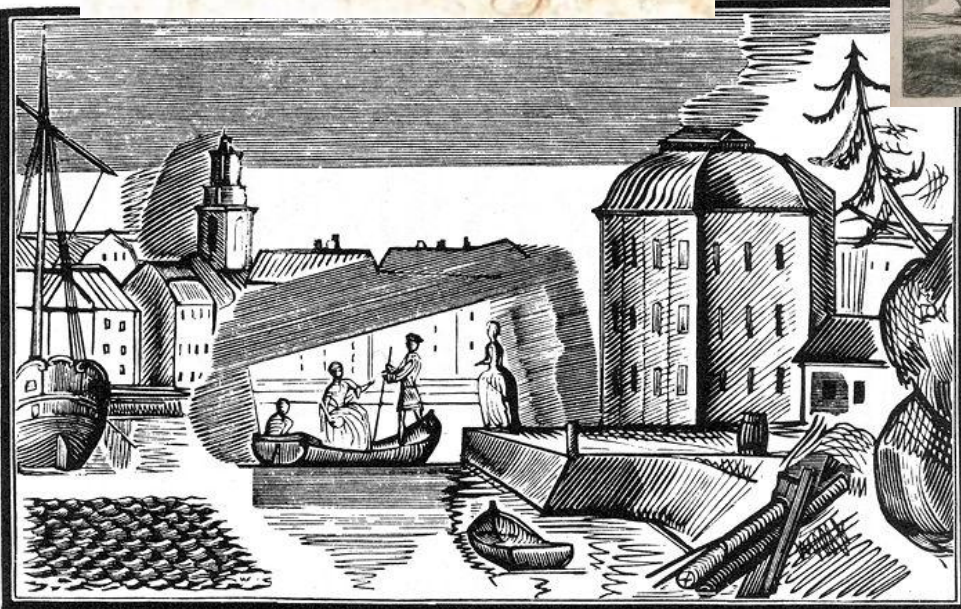
В. Фаворский. Гравюра иллюстрация к роману П. Муратова «Эгерия»(1921)