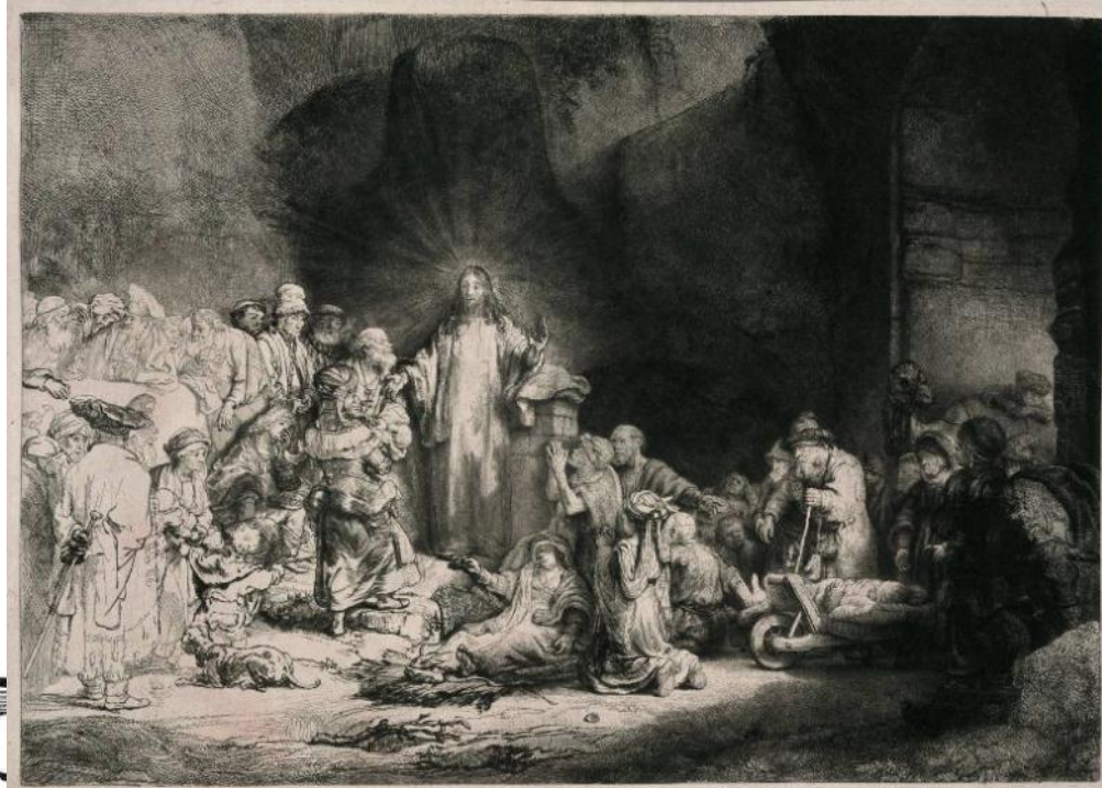
Рембрандт. Офорт «Явление Христа» (1648)