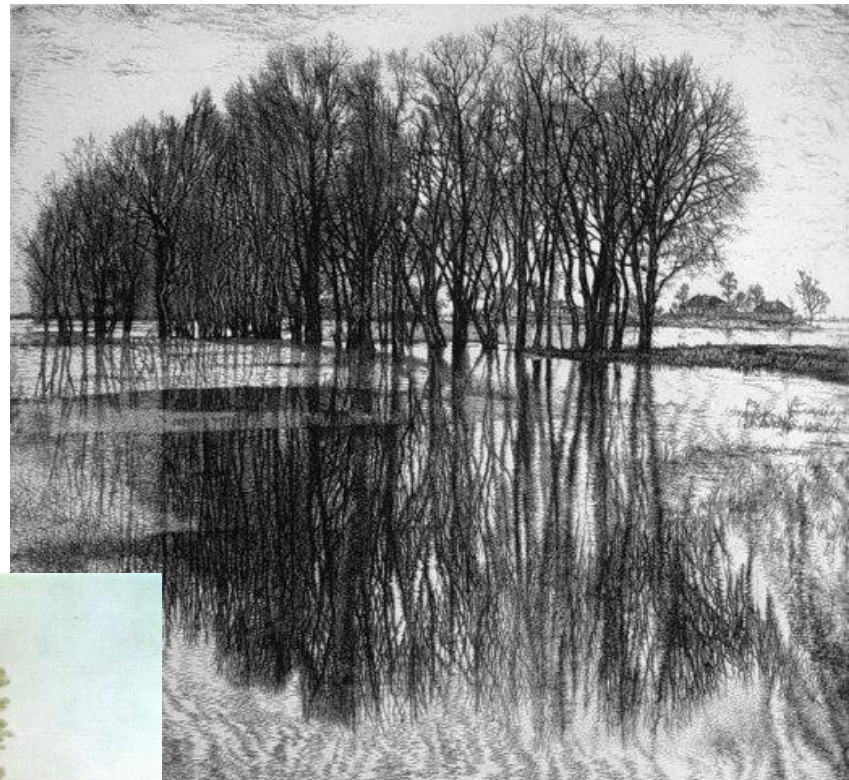
С. Никереев «Весенний разлив» (1999)