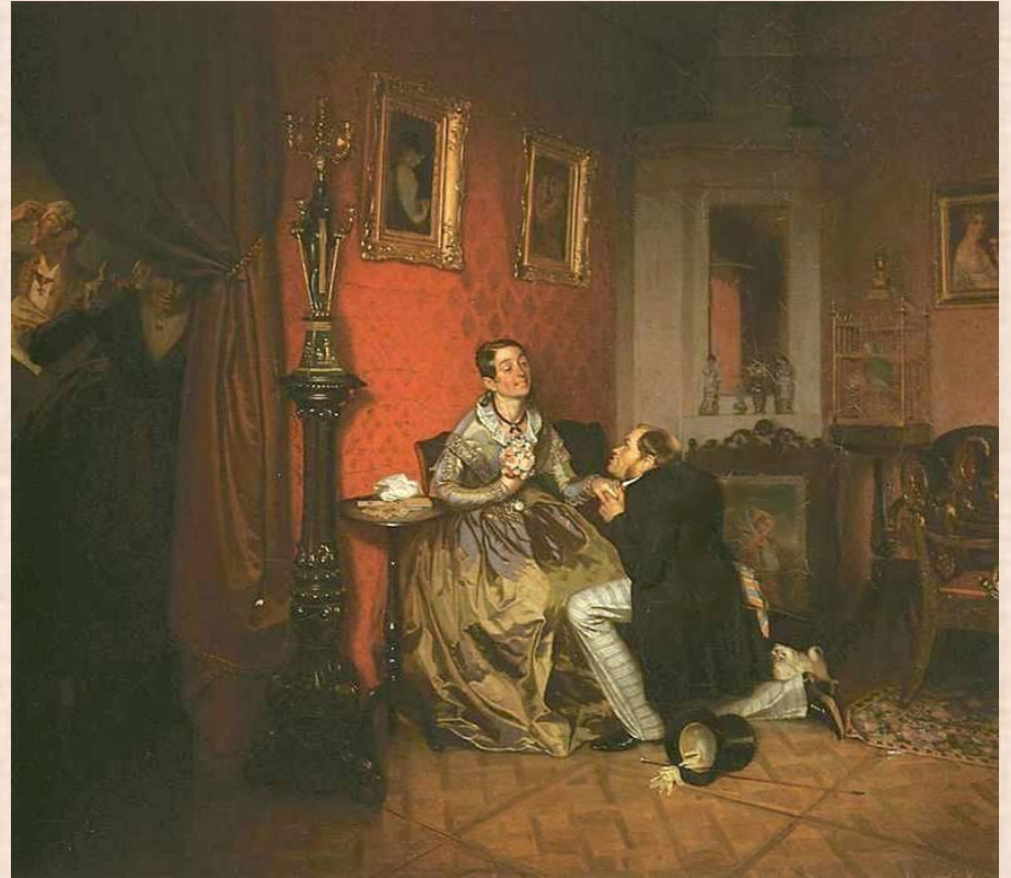
П.Федотов «Разборчивая невеста»