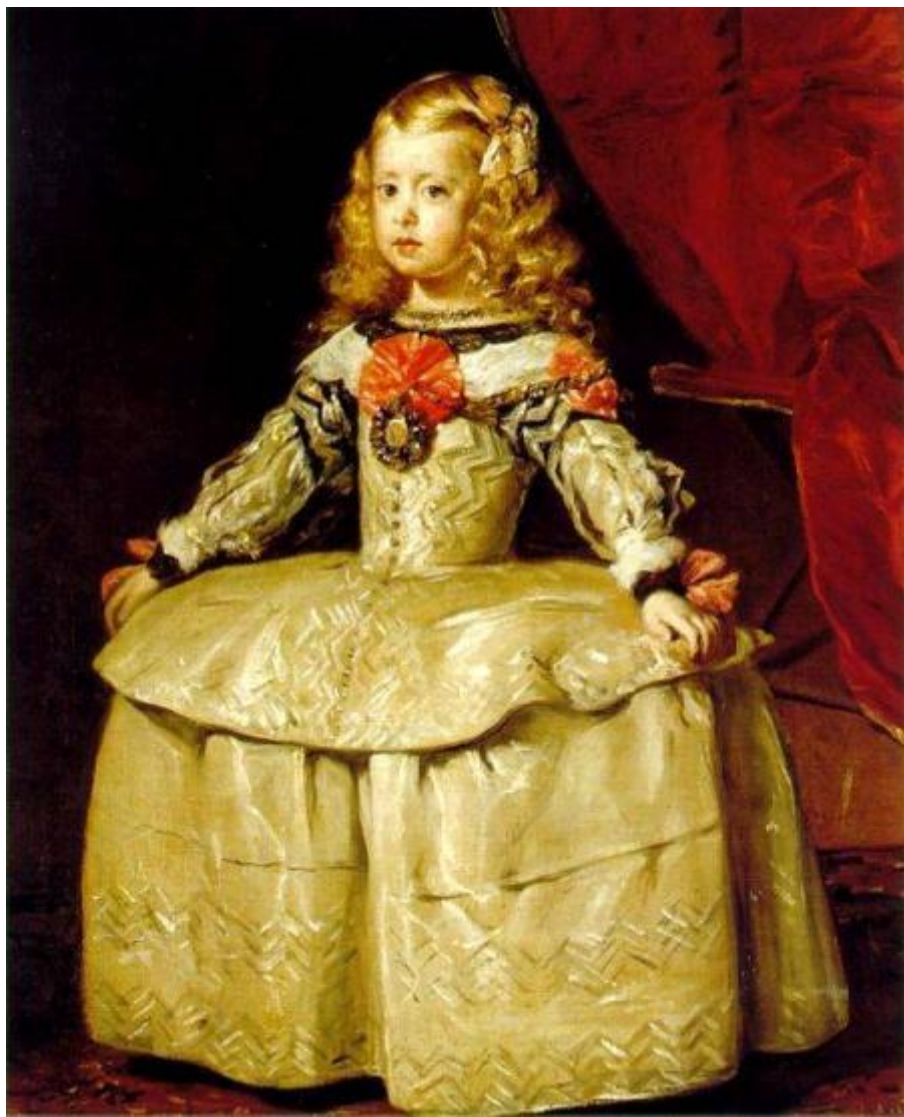
Веласкес. «Портрет инфанты Маргариты». Масло (1654)