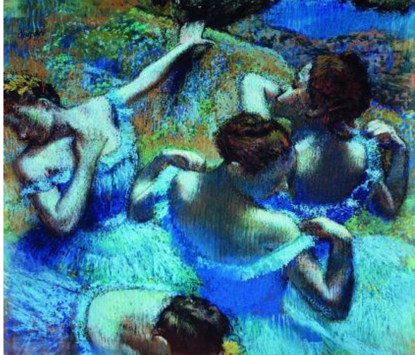
Э. Дега. «Голубые танцовщицы». Пастель (1865)