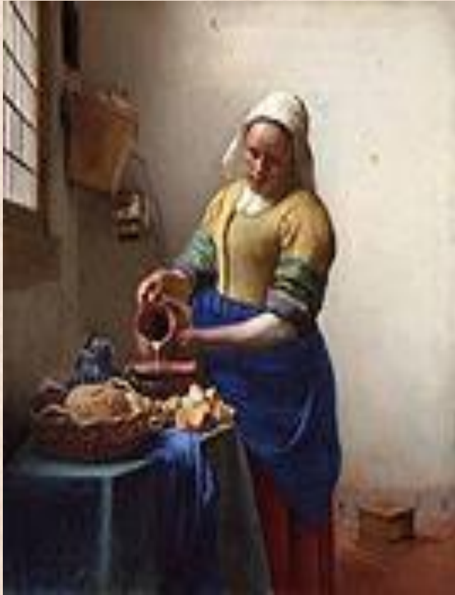
Я. Вермеер «Служанка с кувшином»

Бытовой жанр – жанр изобразительного искусства, посвященный повседневной жизни людей