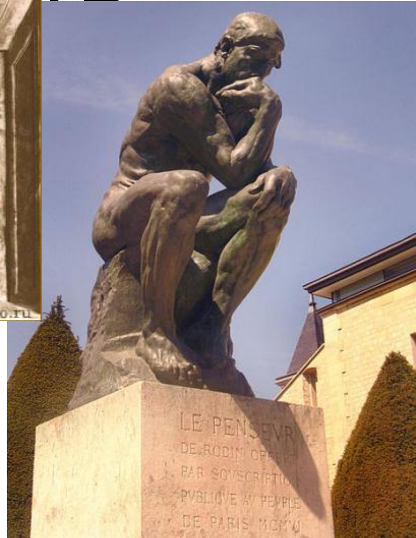
О.Роден «Мыслитель». Бронза