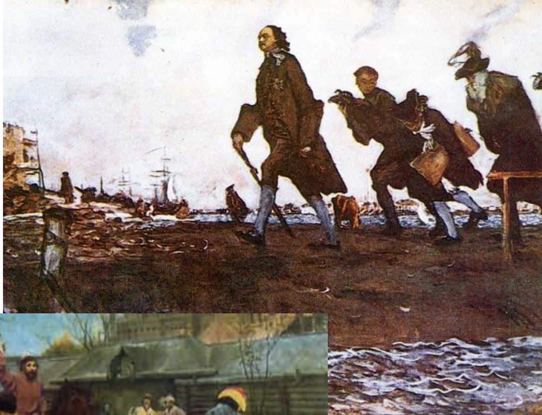
В. Серов «Петр I» (1907)