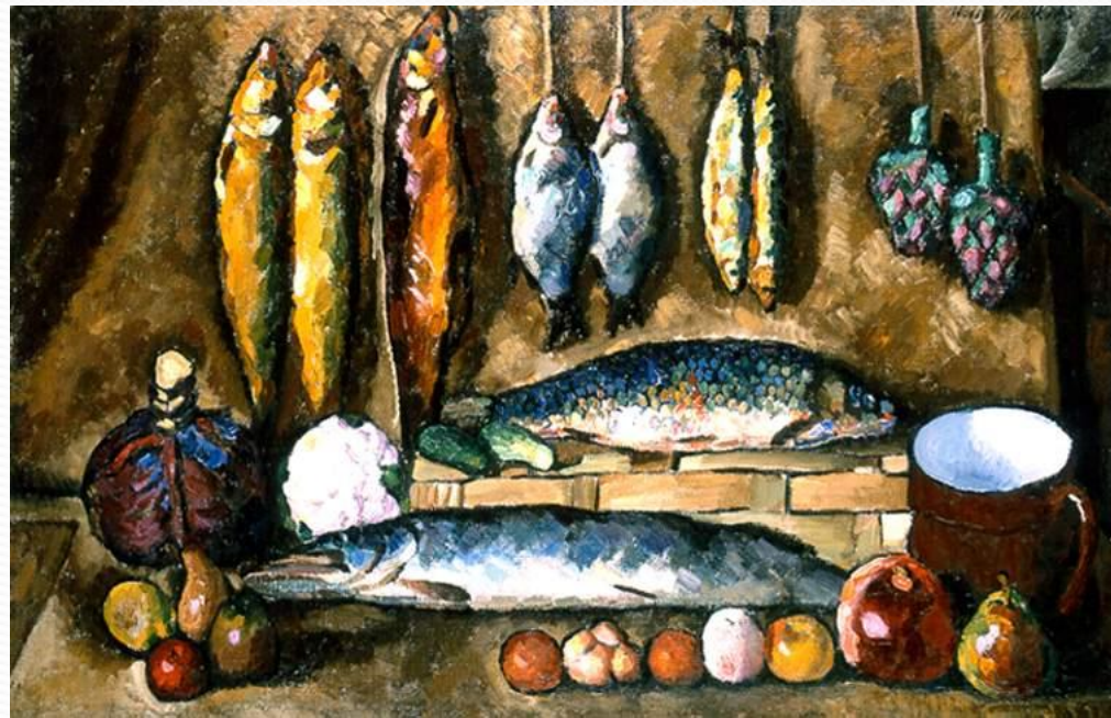
И. Машков «Натюрморт с рыбой»