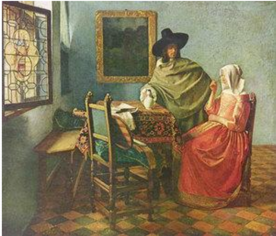
Вермер «Бокал вина»