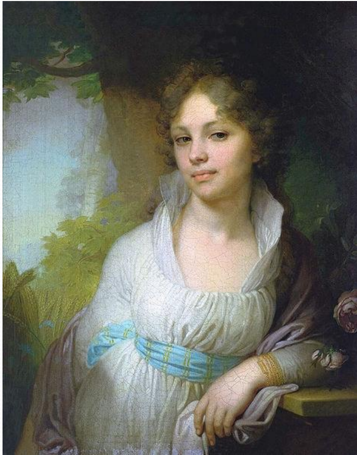
В.А. Боровиковский Портрет М. И. Лопухиной