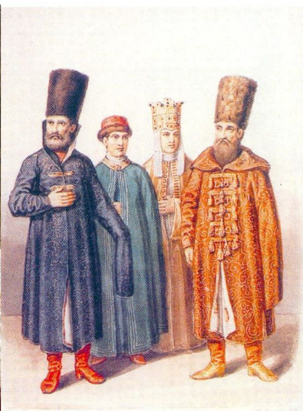
Константин Маковский- «Молодая боярыня»