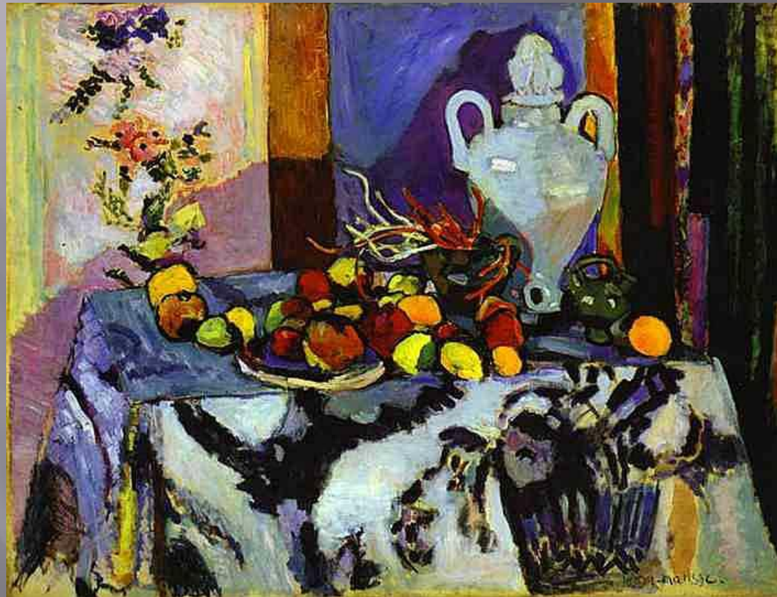
А. Матисс. Голубой натюрморт. 1907

...выбор красок основан на наблюдении натуры, «на опыте моих чувств».