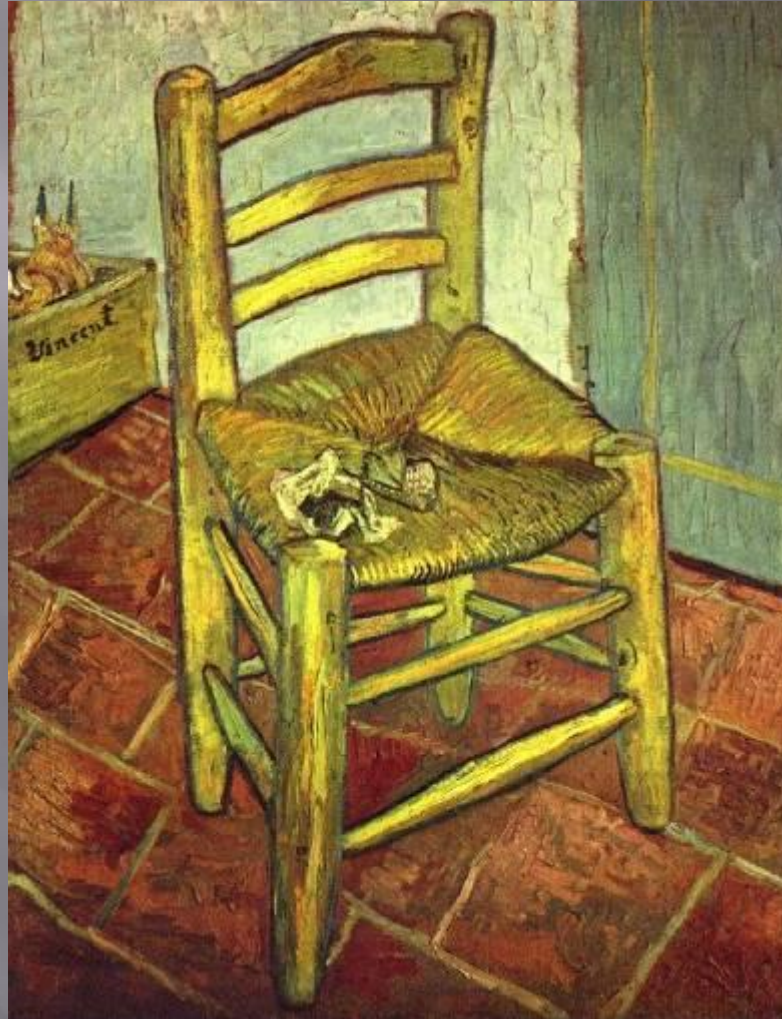
В. Ван Гог. Стул Винсента с трубкой. 1888

«...краски палитры живописца не обязаны совпадать с красками природы»