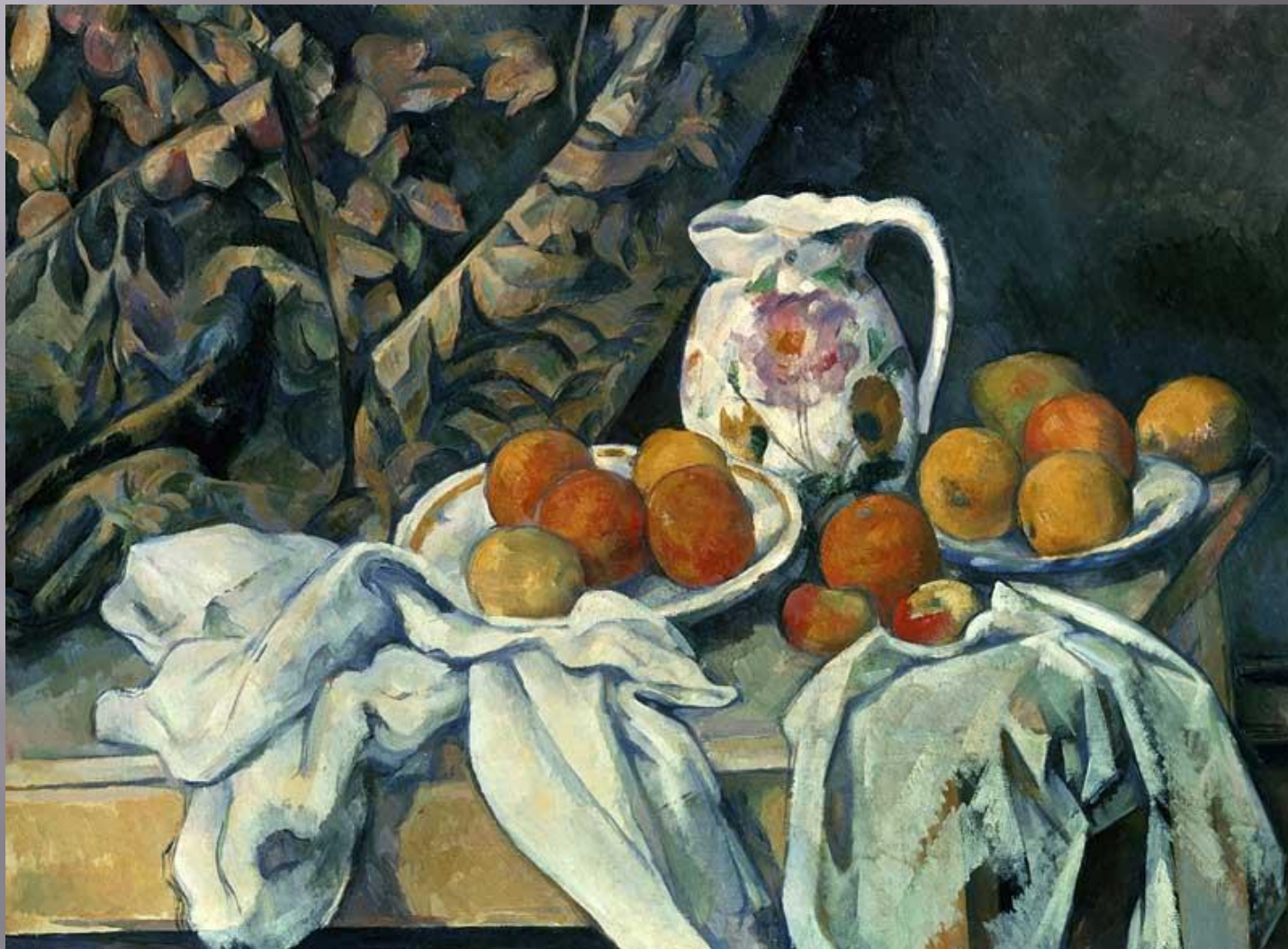
П. Сезанн. Натюрморт с драпировкой. 1895

«Художнику надо научиться строить форму цветом»