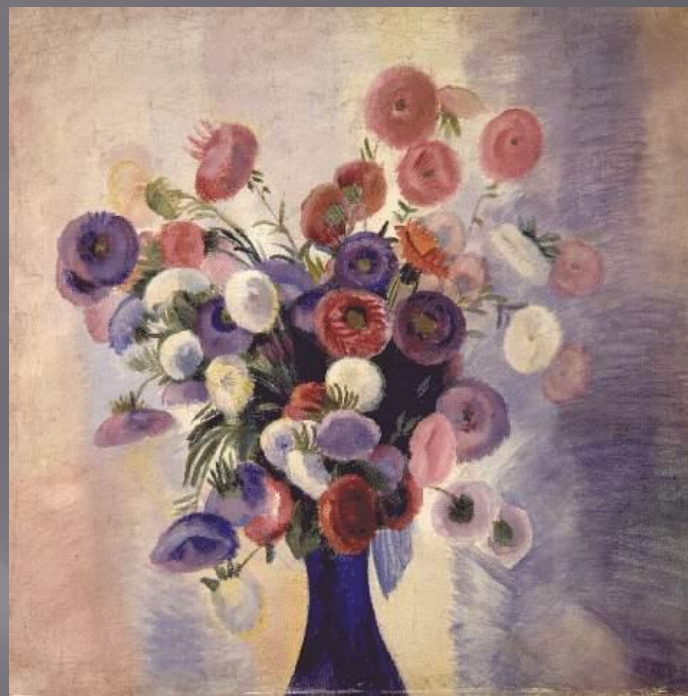
П.В. Кузнецов. Цветы Бухары. 1913