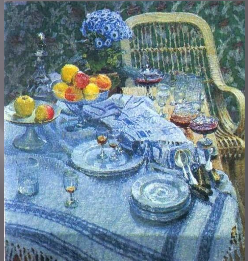
И. Э. Грабарь. Неприбранный стол. 1907