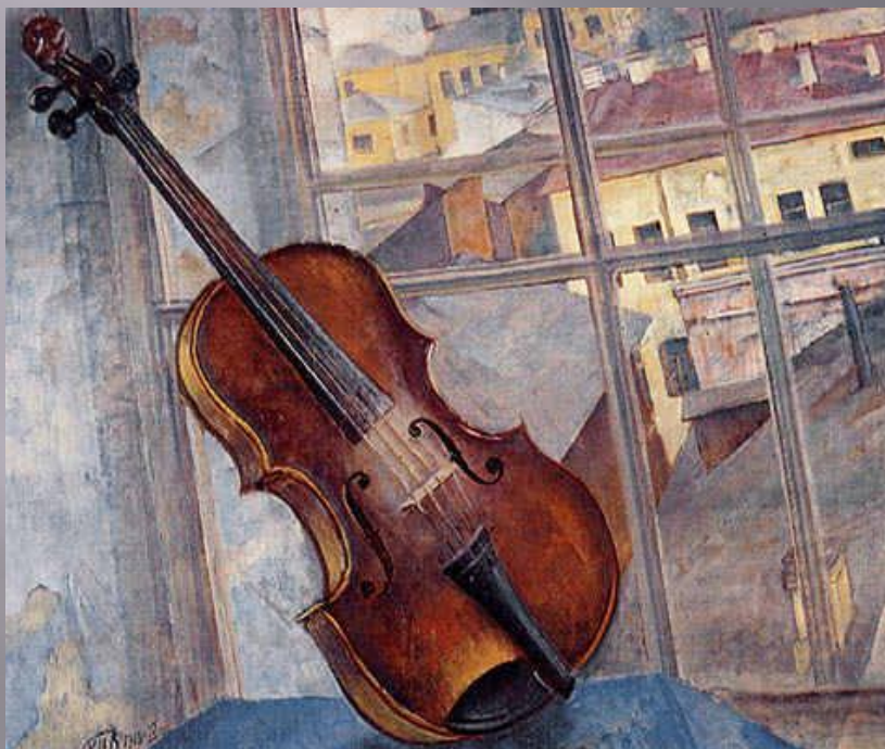
К.С. Петров-Водкин. Натюрморт со скрипкой. 1918