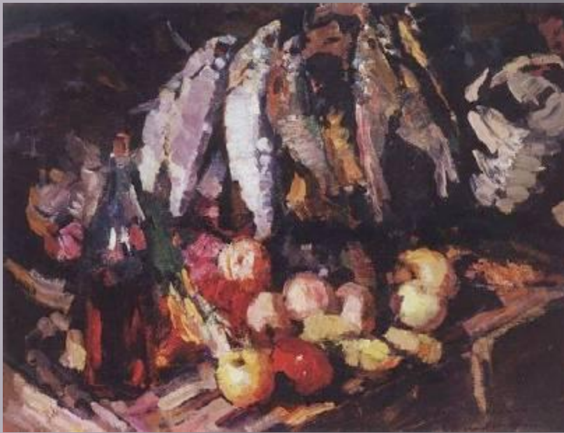
К.А. Коровин. Рыбы, вино и фрукты