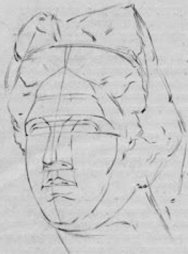
Рис. 25. Третья стадия рисования античной головы