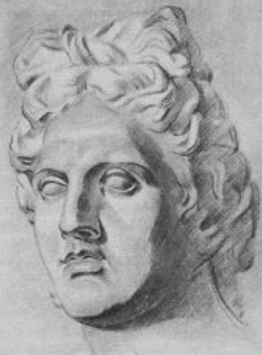
Рис. 28. Шестая стадия рисования античной головы