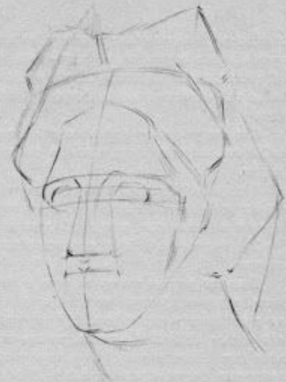
Рис. 24. Вторая стадия рисования античной головы