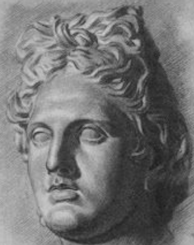
Рис. 29. Седьмая стадия рисования античной головы