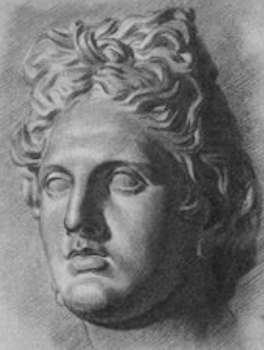
Рис. 29. Седьмая стадия рисования античной головы