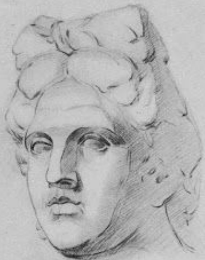
Рис. 27. Пятая стадия рисования античной головы