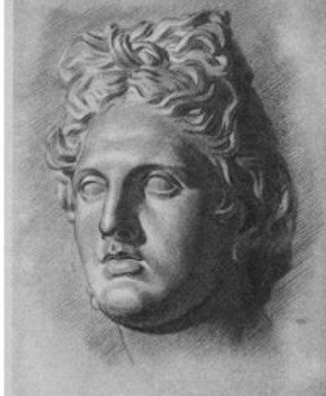
Рис. 29. Седьмая стадия рисования античной головы