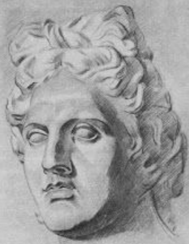
Рис. 28. Шестая стадия рисования античной головы