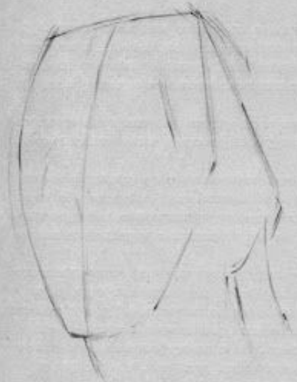
Рис. 23. Первая стадия рисования античной головы