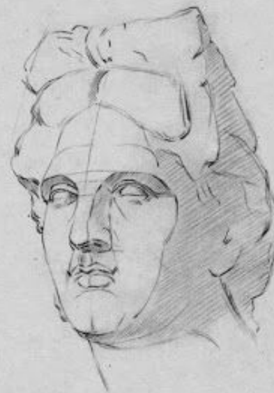
Рис. 26. Четвертая стадия рисования античной головы