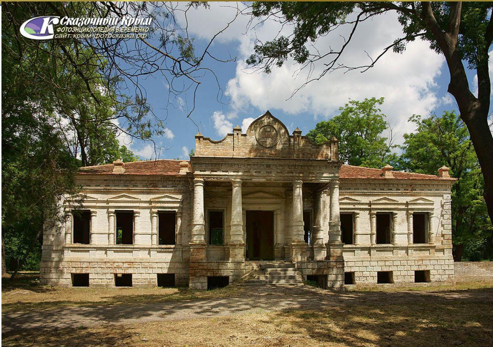
УСАДЬБА ШАТИЛОВА В С.ЦВЕТУЩЕЕ НИЖНЕГОРСКОГО РАЙОНА