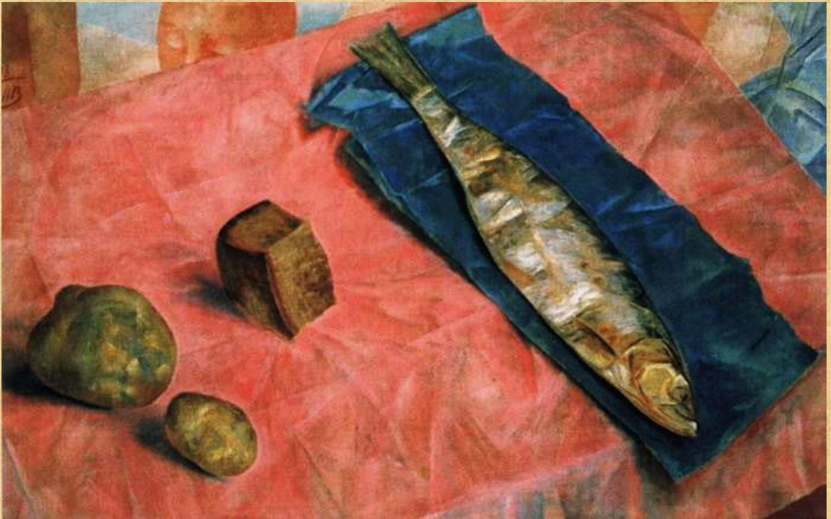
К. С. Петров-Водкин. «Селедка» . 1918 г.