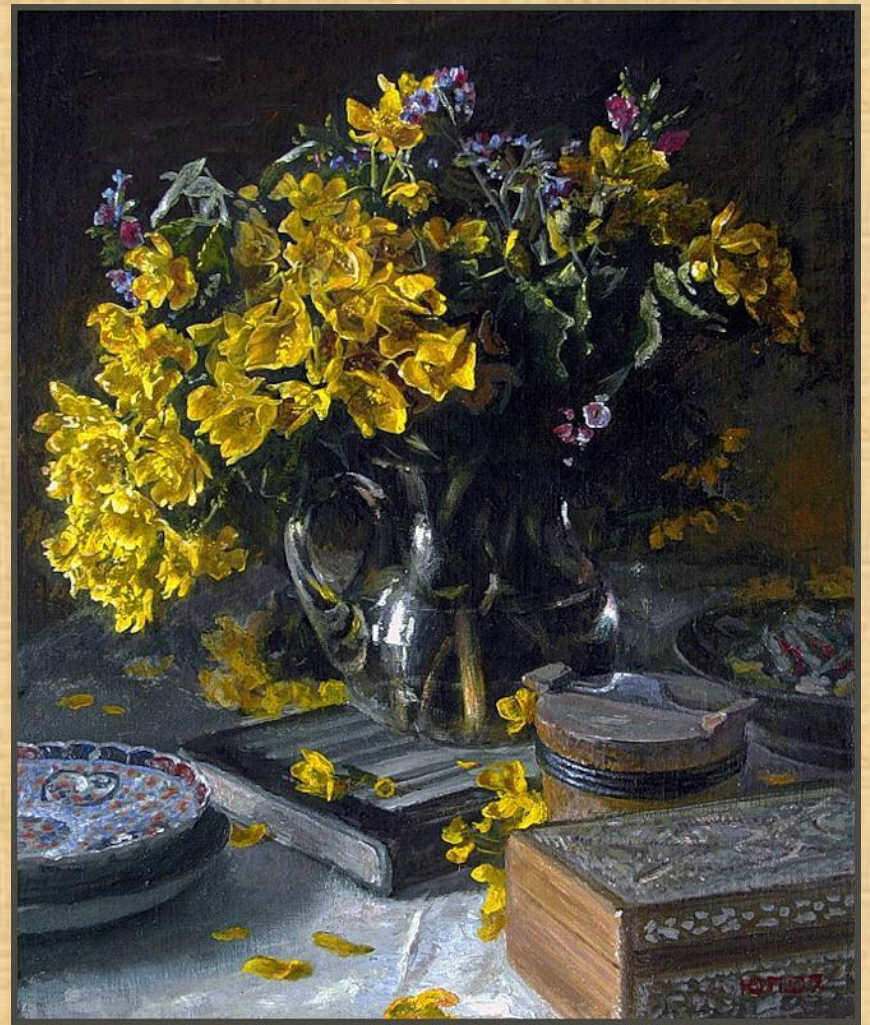
Пример реалистичного натюрморта