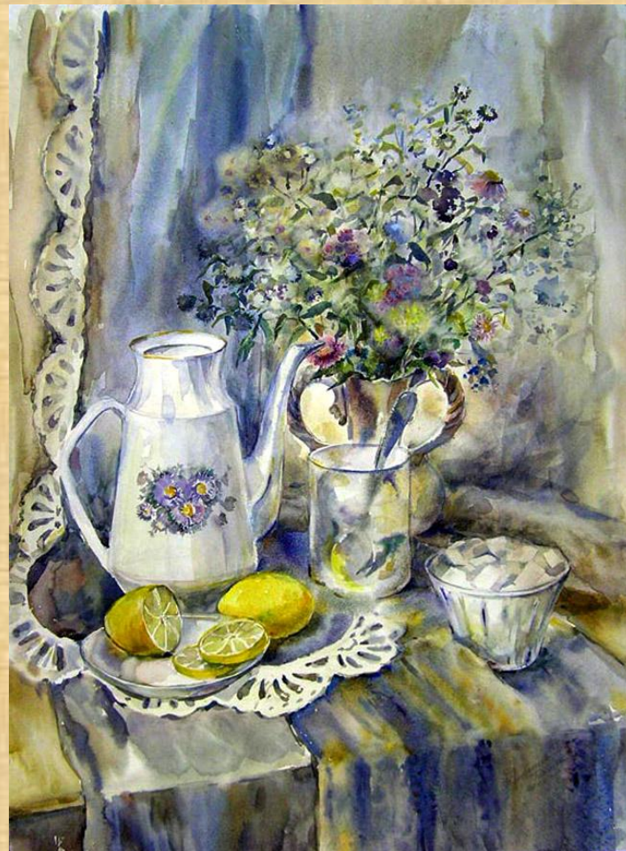
Пример натюрморта в интерьере