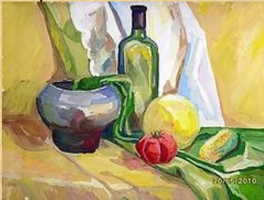
Пример учебной работы в зеленых тонах