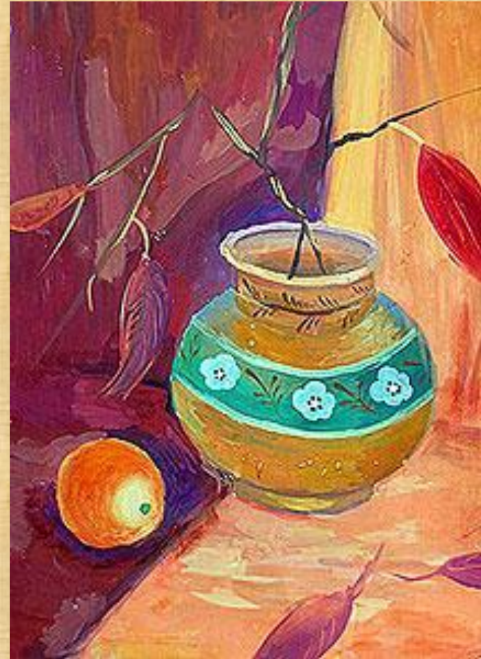
Учебная работа. Натюрморт в теплых тонах