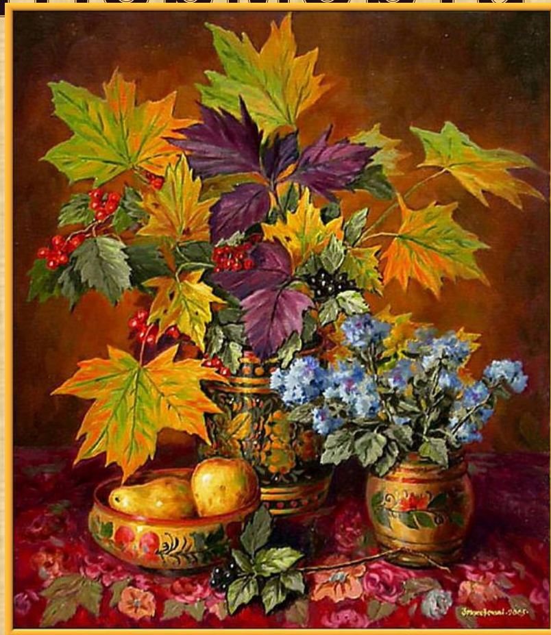
Пример сюжетно-тематического натюрморта. Тема: осень