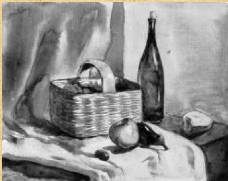
Учебный натюрморт. Этапы работы