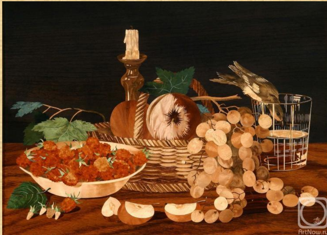
И. Ф. Хруцкий. «Плоды и птичка». Холст, масло. 1833 г.

(франц. nature morte — "мертвая натура") — жанр изобразительного искусства, в котором изображаются предметы неодушевленной природы, соединенные художником в отдельную группу и представляющие собой целостную композицию.