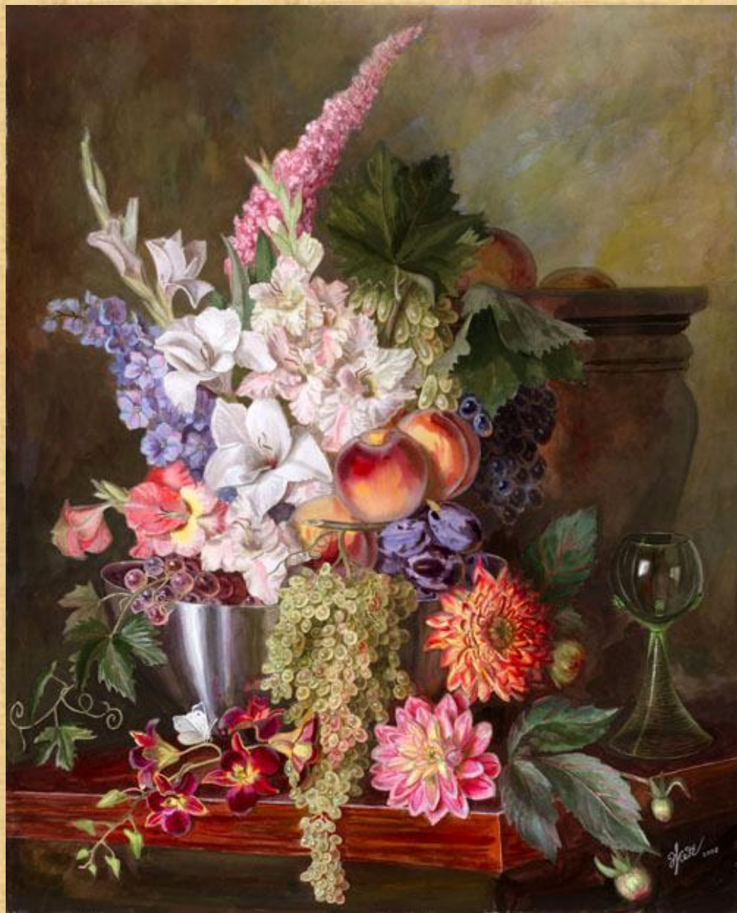
Натюрморт в голландском стиле. Автор неизвестен. Холст, масло. 2008 г.