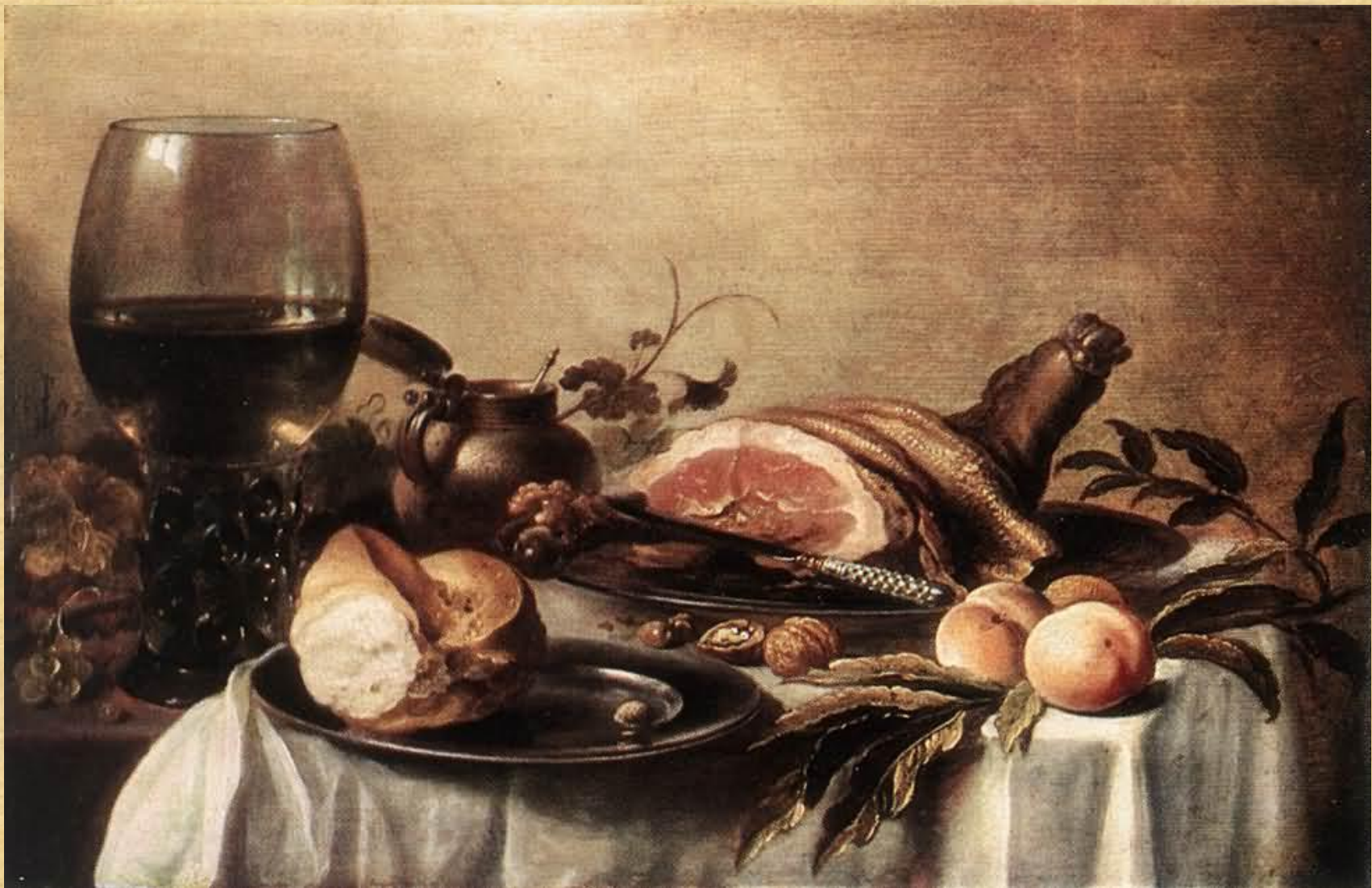
П. Клаас. Завтрак с ветчиной. 1647. Санкт-Петербург, Эрмитаж