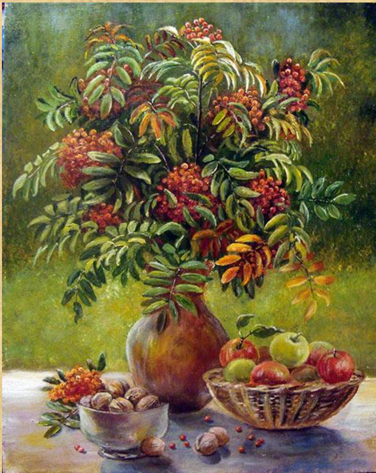
Пример натюрморта в пейзаже