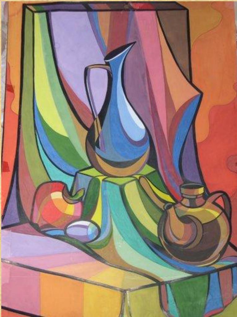
Пример декоративного натюрморта