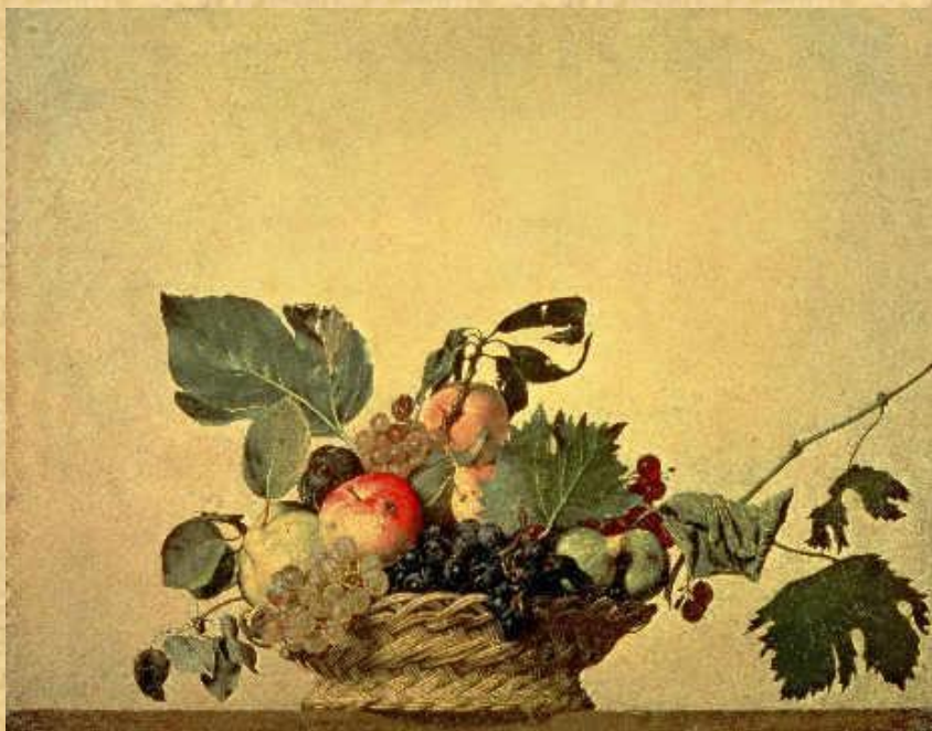
Микеланджело Меризи де Караваджо. «Корзина с фруктами». 1597 г.