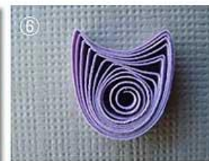
круг с выемкой