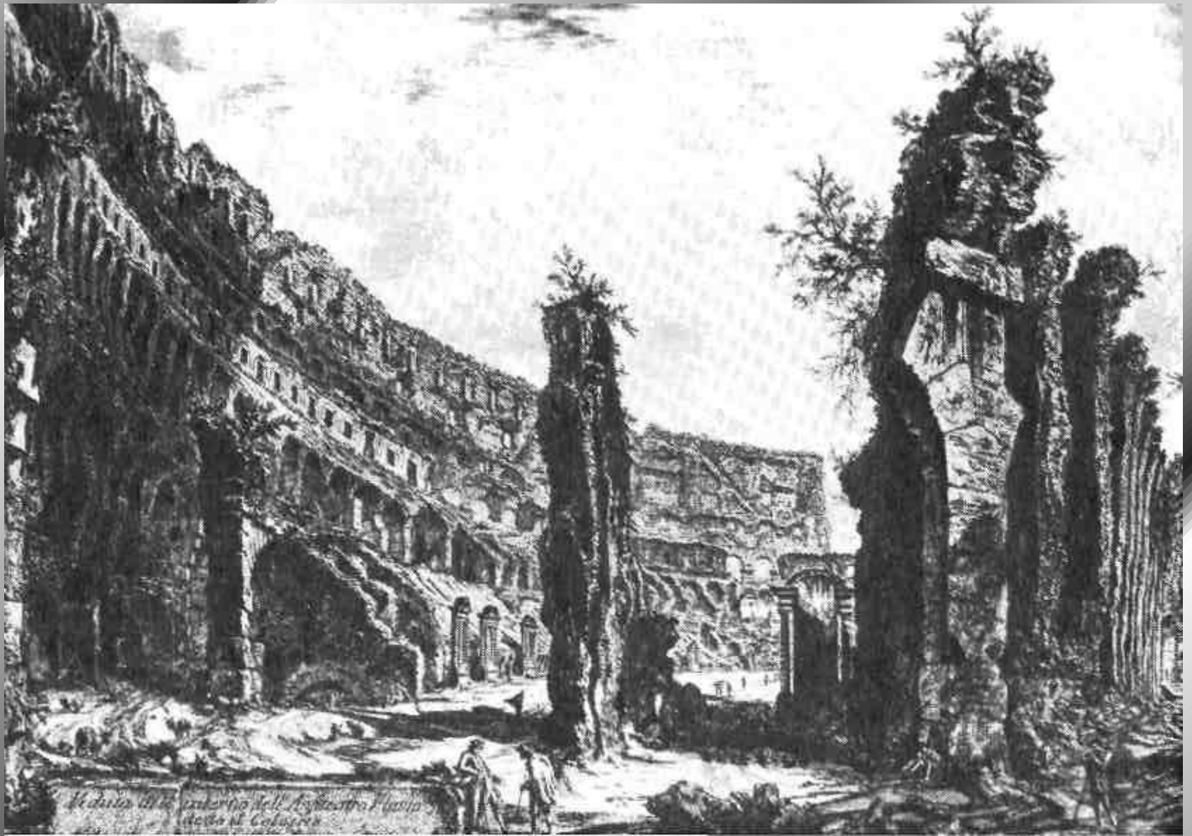
Veduta all'interno dell'Amfiteatro Flavio detto il Colosseo