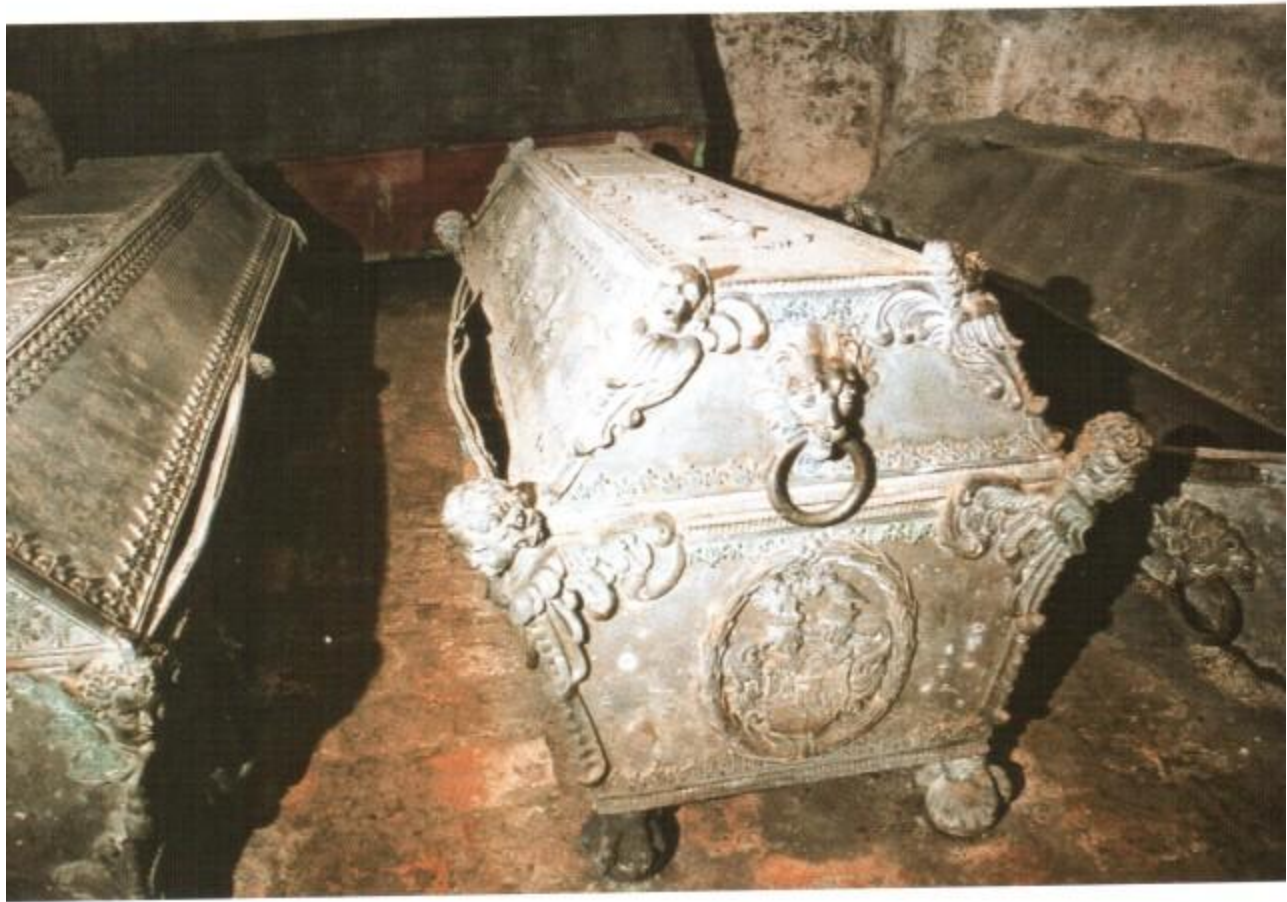
Figure 1: A heavy, ornate metal chest or safe, likely made of iron or steel, resting on a stone floor in a dark, enclosed space.