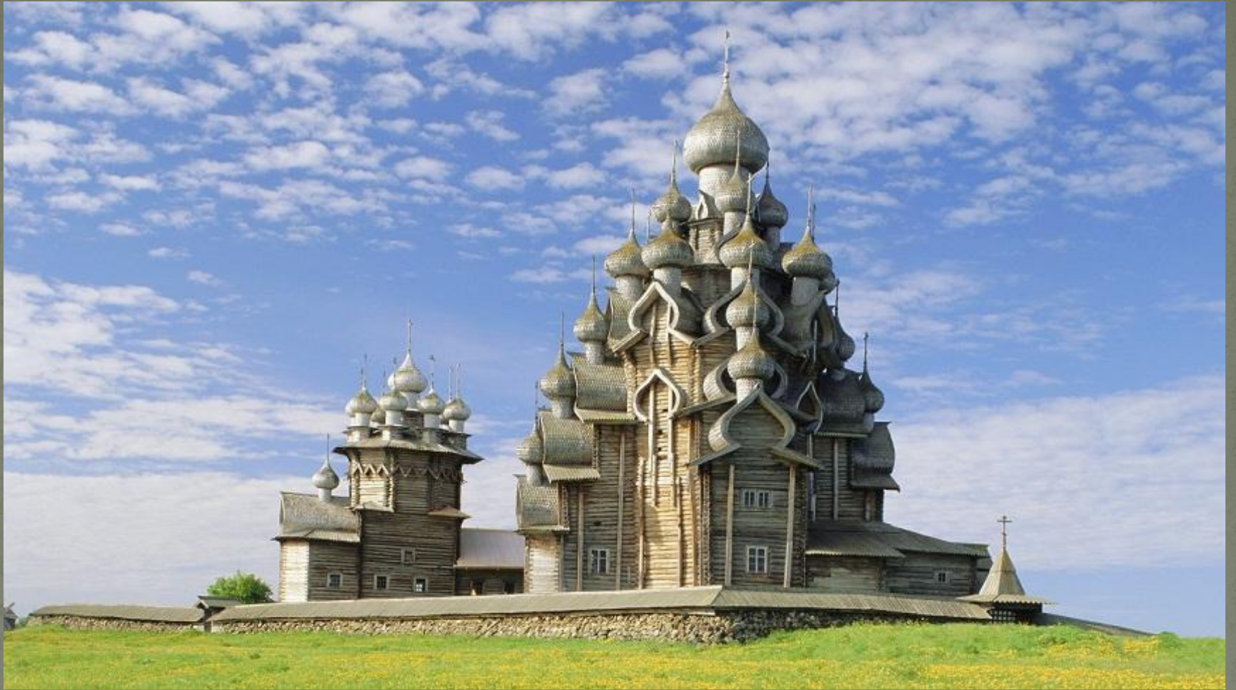
Церковь Преображения Господня на о. Кижии, 1714г.