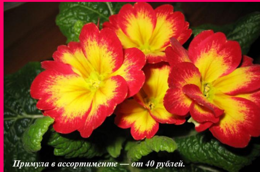
Примула в ассортименте — от 40 рублей.