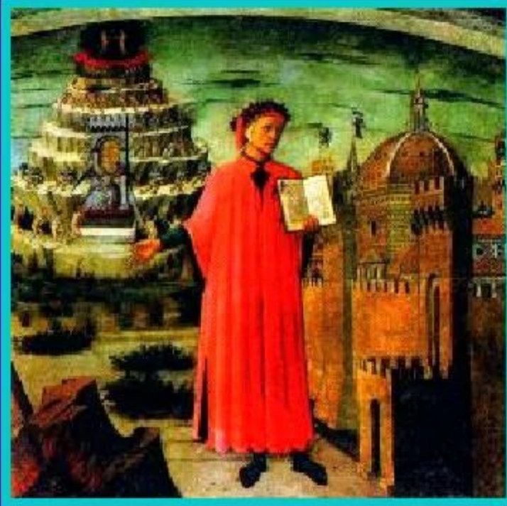
Доменико де Микелино. Данте и три царства.

Самым выдающимся поэтом Средневековья стал Данте Алигьери. Родившись во Флоренции он окончил городскую школу и затем всю жизнь продолжал учиться.