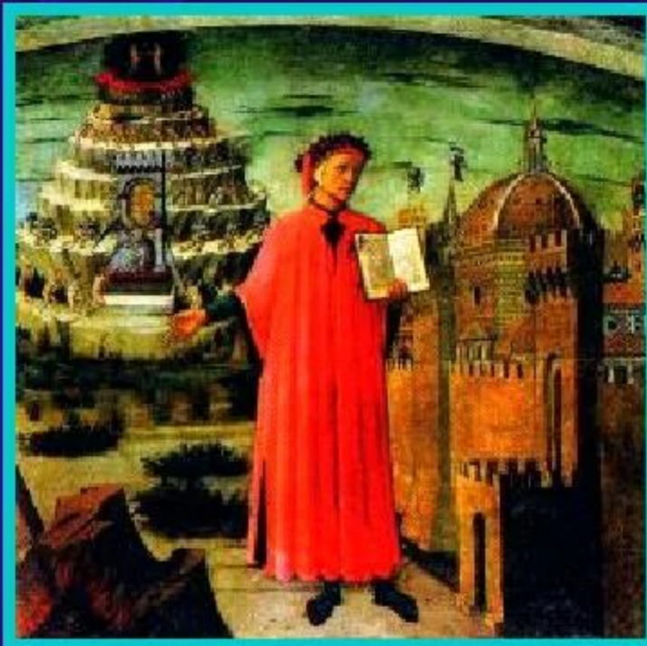
Доменико де Микелино. Данте и три царства.

Самым выдающимся поэтом Средневековья стал Данте Алигьери. Родившись во Флоренции он окончил городскую школу и затем всю жизнь продолжал учиться.