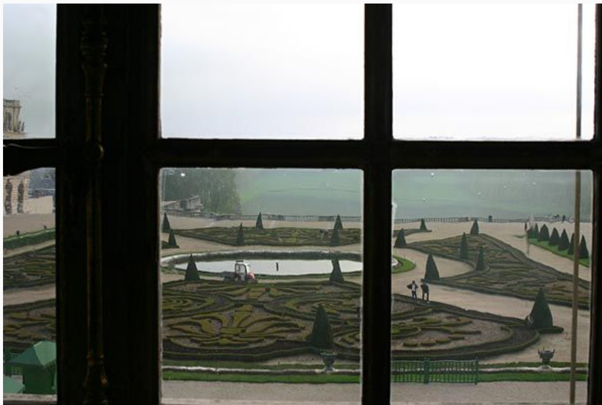
Вид из окна Версальского дворца