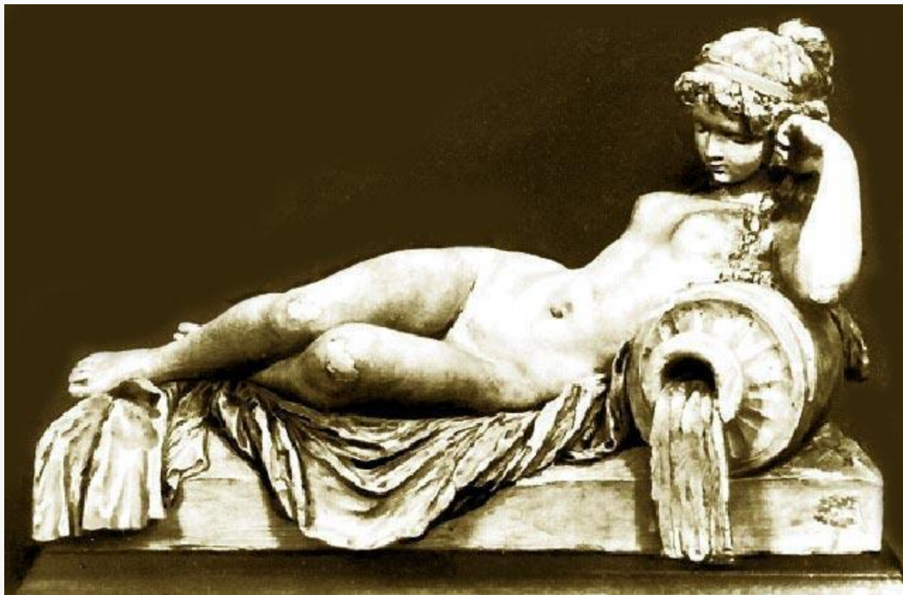
Клодион «Речная нимфа»