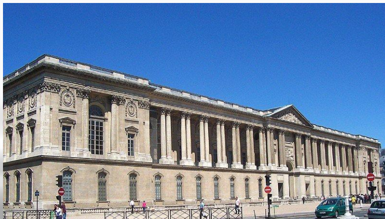
Лувер. Восточный фасад