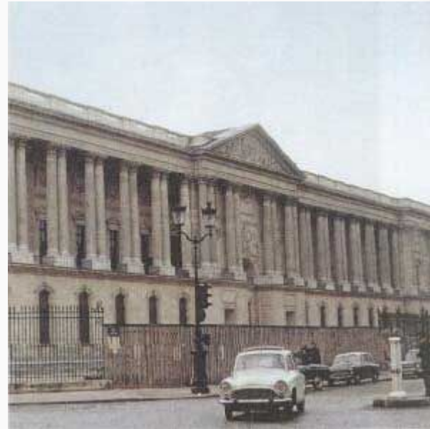
Лувр. Восточный фасад. Арх.Клод Перро