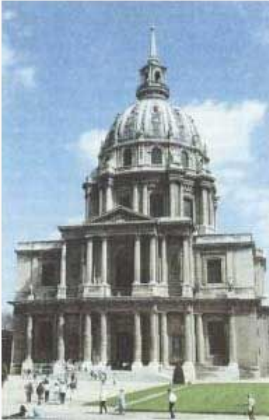
Собор Дома Инвалидов арх. Мансар