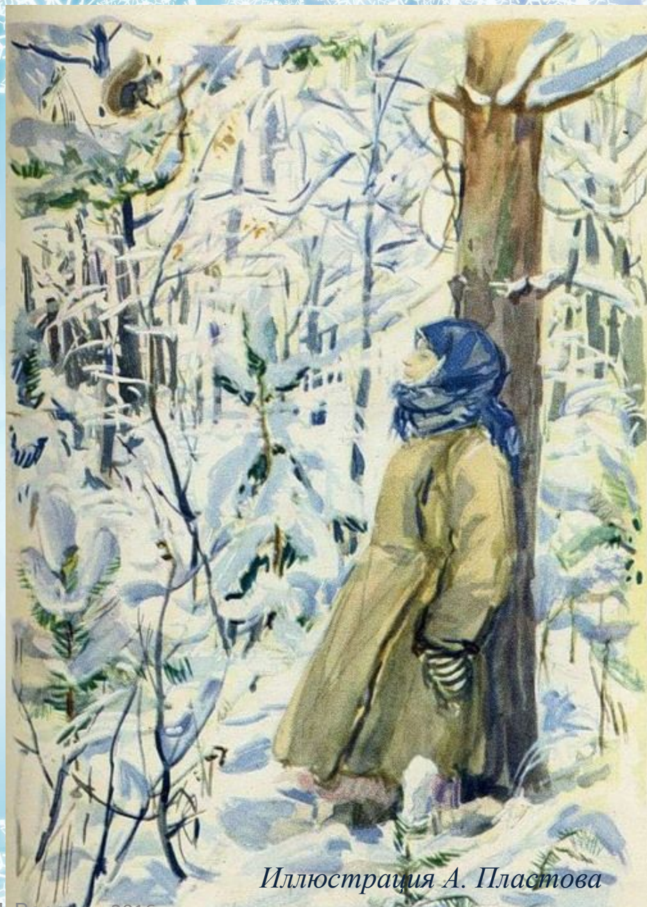
Иллюстрация А. Пластова

«А Дарья стояла и стыла в своем заколдованном сне».