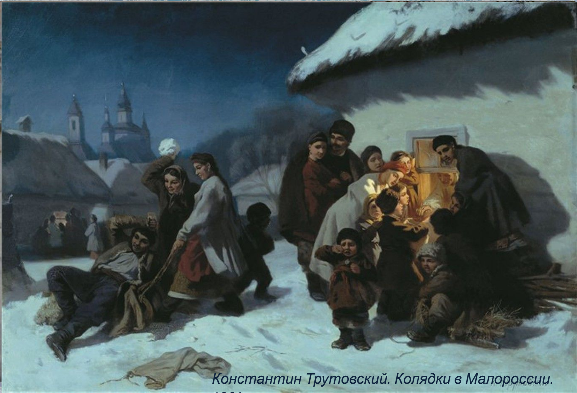
Константин Трутовский. Колядки в Малороссии.