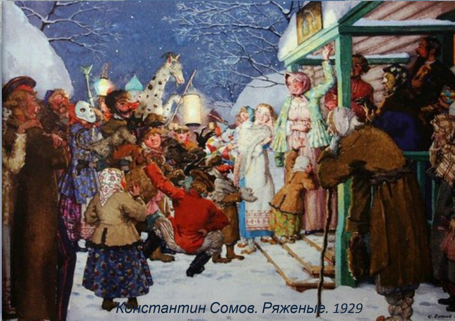
Константин Сомов. Ряженые. 1929

Чем больше зимой снега, тем больше шансов на плодородный год . Аграрная истина, что прошла проверку тысячей урожаев. Снег — в ведении хозяина зимы. Вот на Руси в Святки — в Чистый четверг, накануне Рождества , в Васильев вечер и проводили обряд «кликанья Мороза». В разных губерниях свой день выбирали.