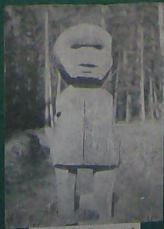
ЭНКЭН И „КУМАРЫЛ“ СУНТАРСКИЙ Р-Н.