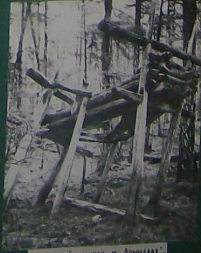
ШАМАНСКИЙ АРАПАС И „АРАМААХ“ МЕГИНО-КАНГАЛАСКИЙ Р-Н.