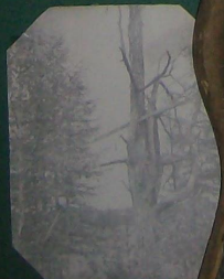
КУОНЯ И „ХУТААХА“, МЕГИНО- КАНГАЛАСКИЙ Р-Н.