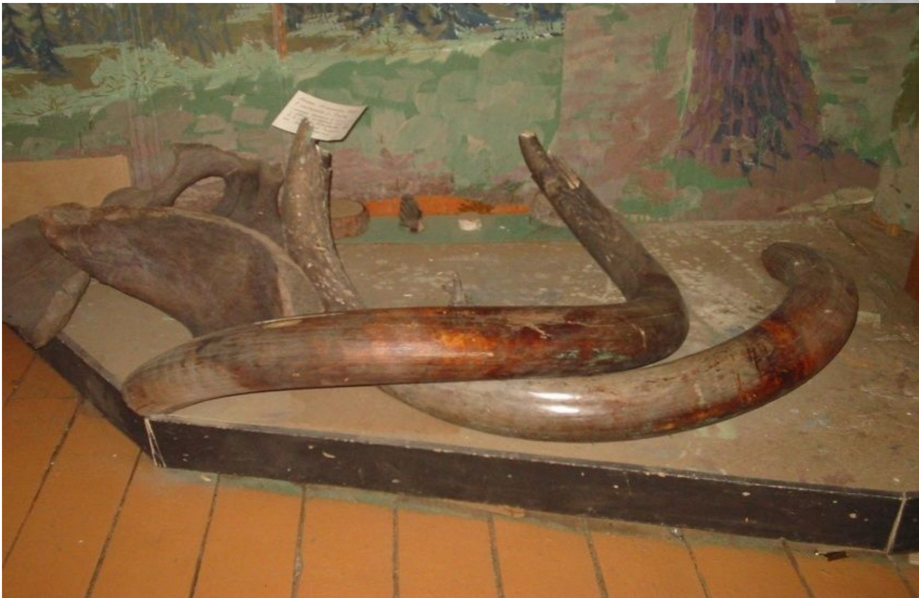
Мамонт аһыта, нозорог, бизон унгохтара