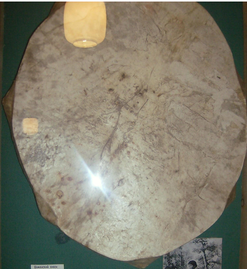
ШАМАНСКИЙ БУВЕН И УДАРНИК-БЫЛАБАХ