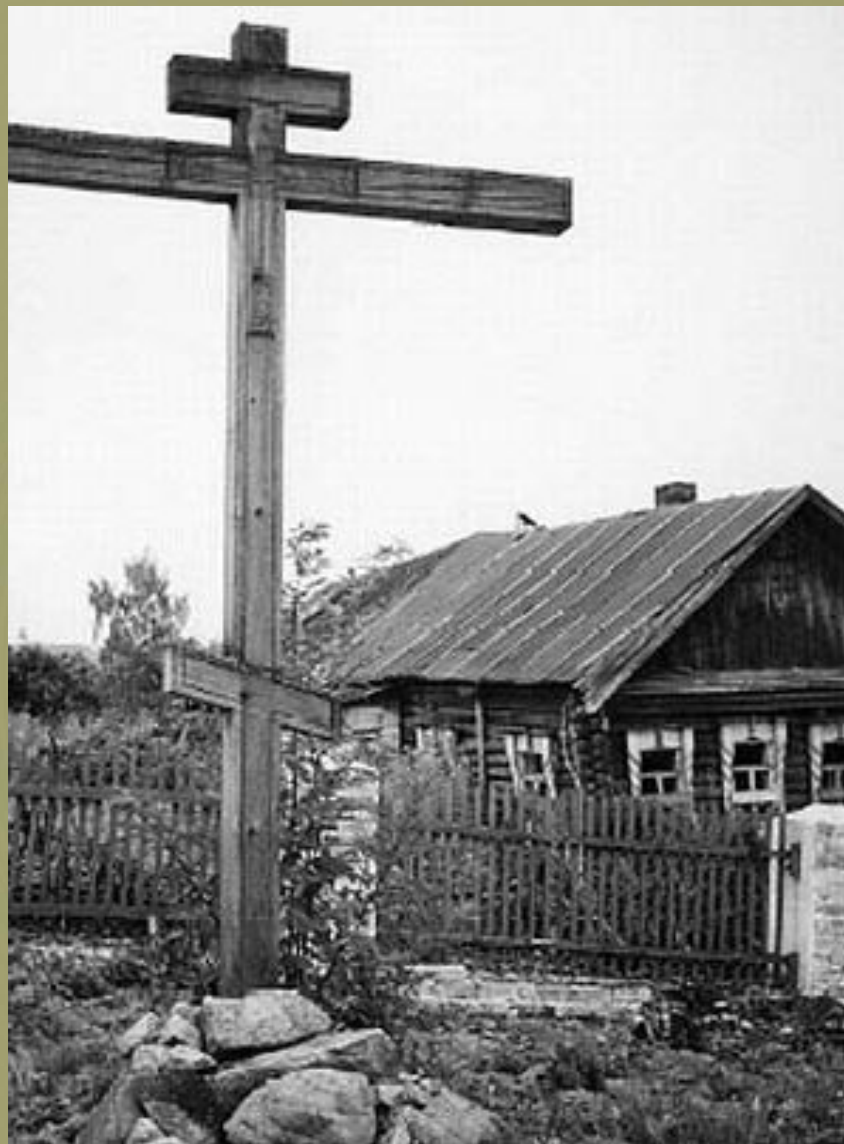
Деревянный крест в Домнине, на месте могилы Ивана Сусанина