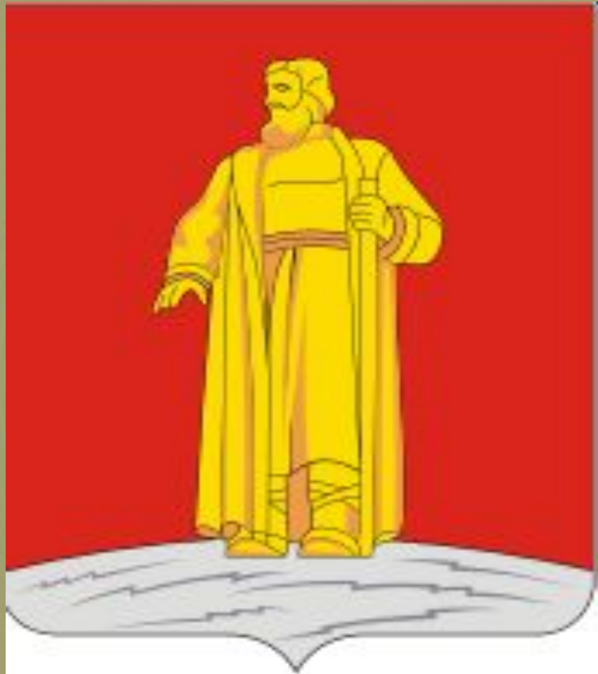
Герб Сусанинского района Костромской области