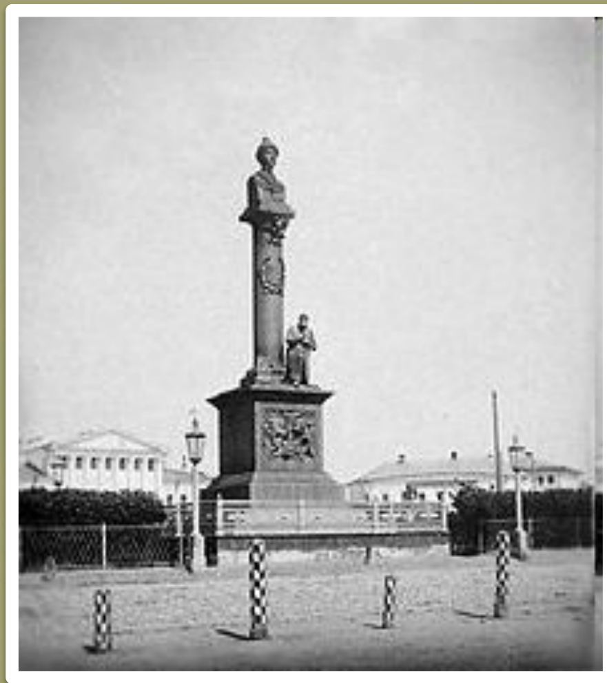
Памятник царю Михаилу Фёдоровичу и крестьянину Ивану Сусанину в Костроме (1851-1918)