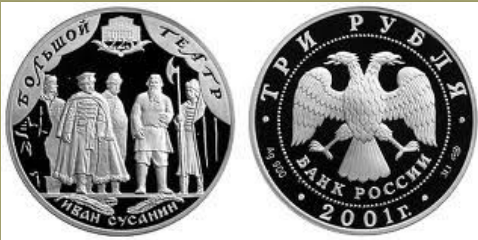
Монета Банка России — Серия: «Искусство», 225-летие Большого театра, Иван Сусанин, 3 рубля, реверс (2001)