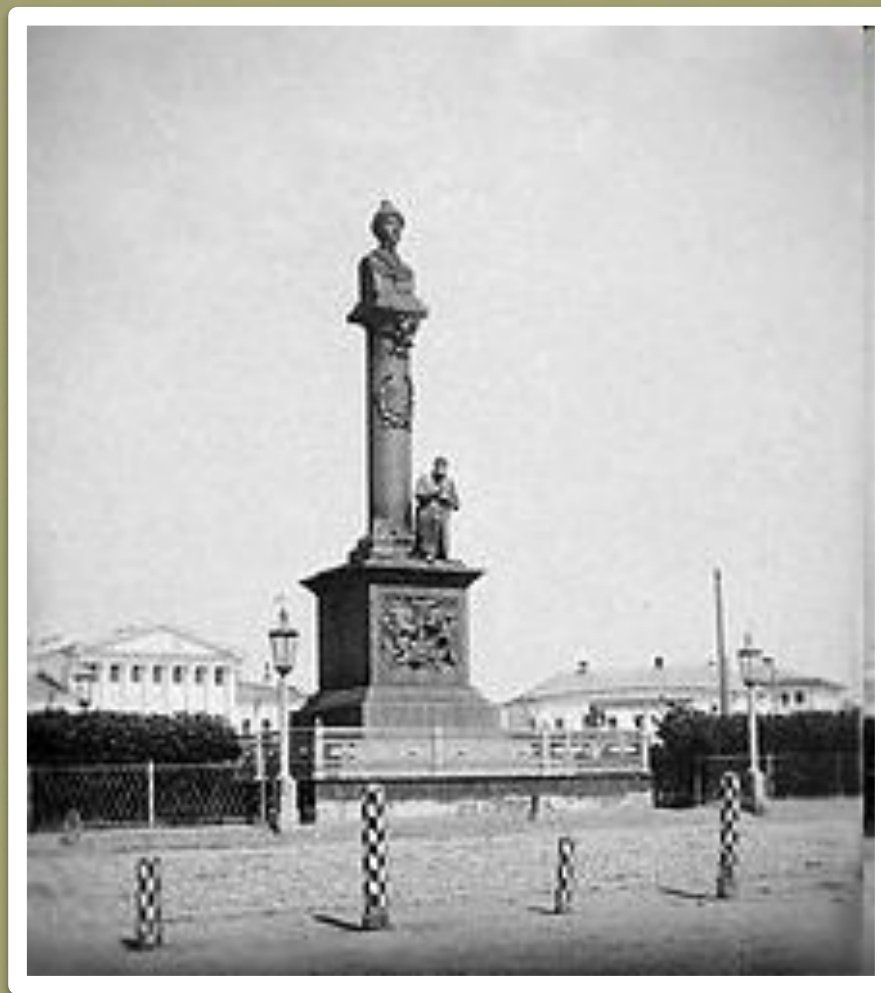
Памятник царю Михаилу Фёдоровичу и крестьянину Ивану Сусанину в Костроме (1851-1918)