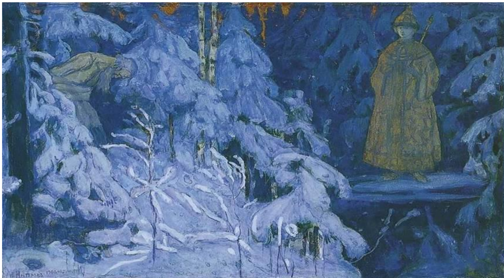
М. В. Нестеров «Видение Ивану Сусанину образа Михаила Фёдоровича», 1906