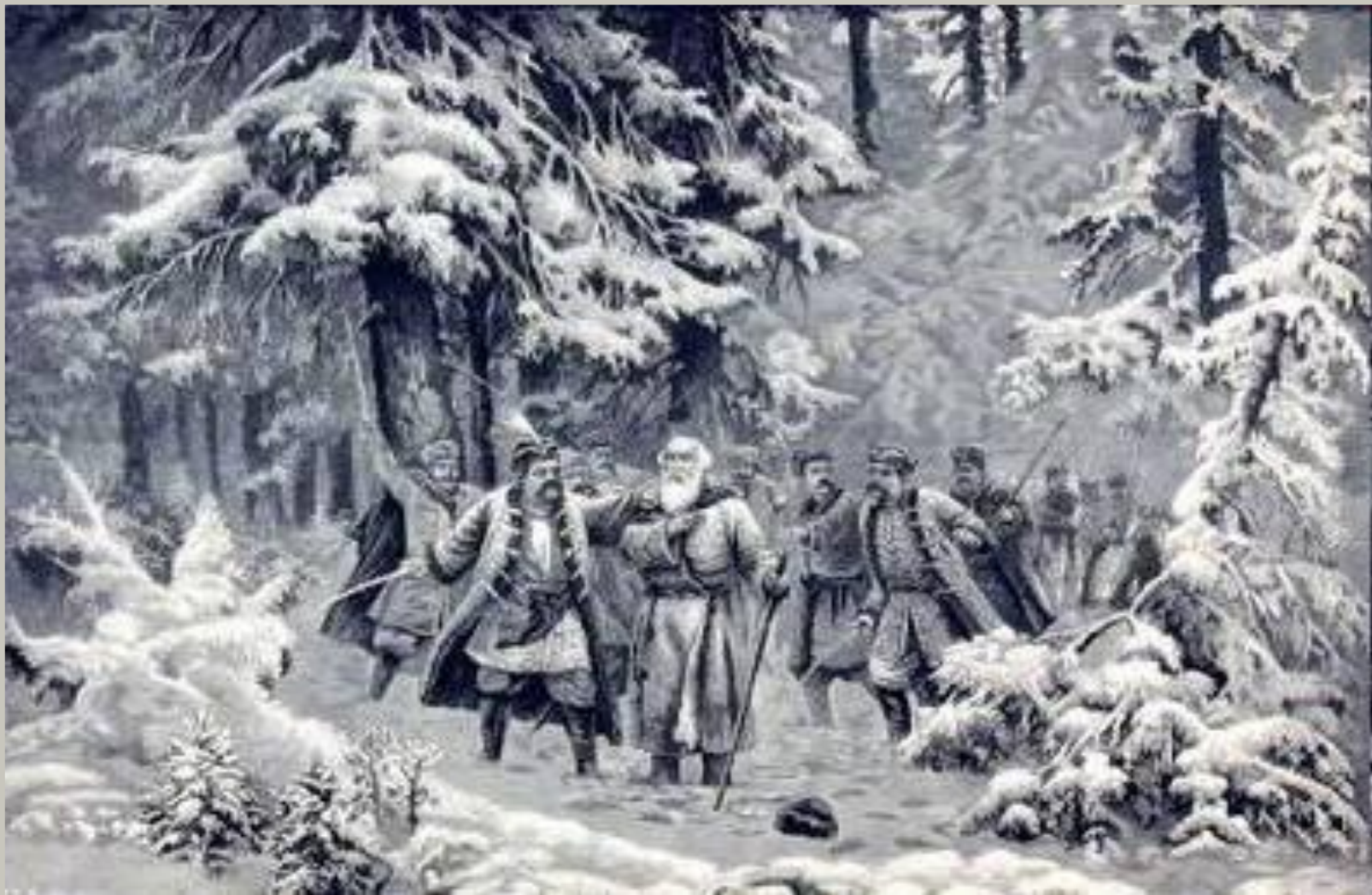
Гибель Ивана Сусанина. Картина XIX века