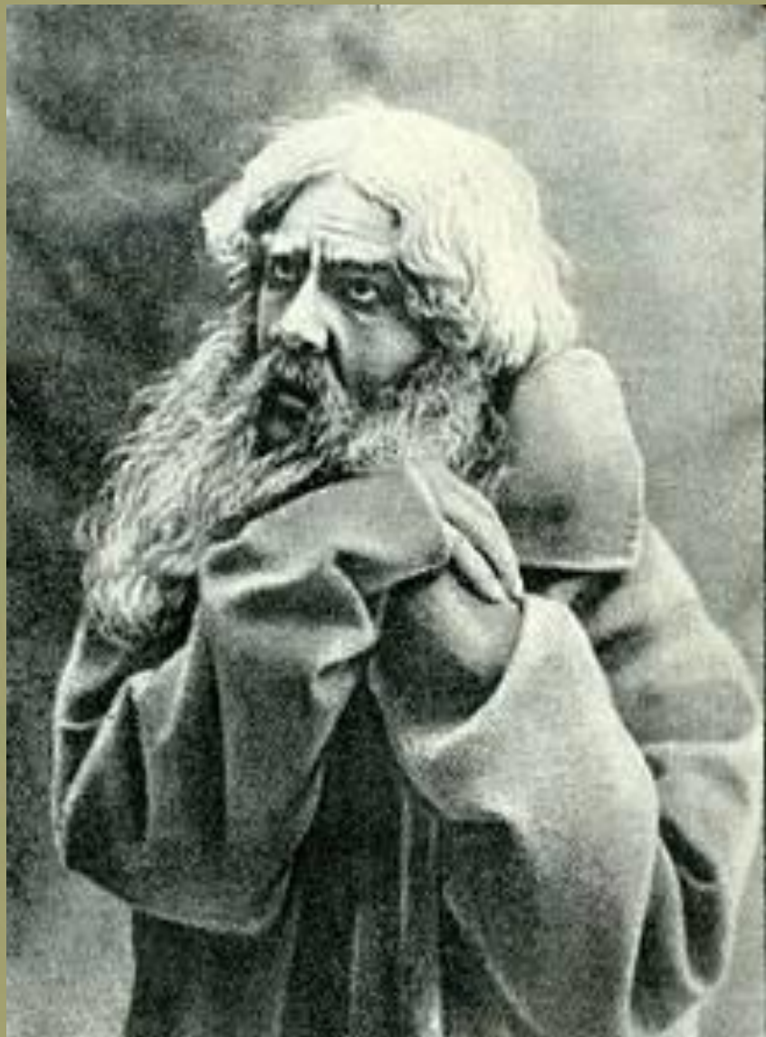
Ф. И. Шаляпин в опере «Жизнь за царя», Мариинский театр, Петербург, 1900-е