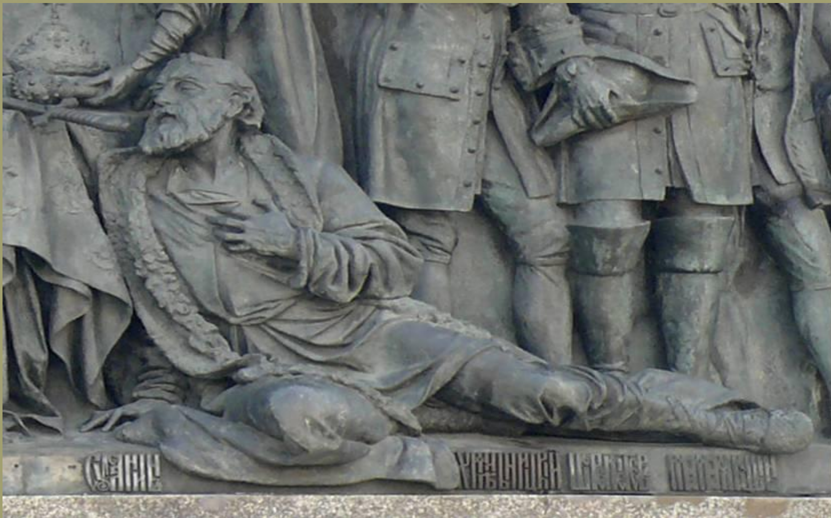
Иван Сусанин на Памятнике «1000-летие России» в Великом Новгороде (1862)