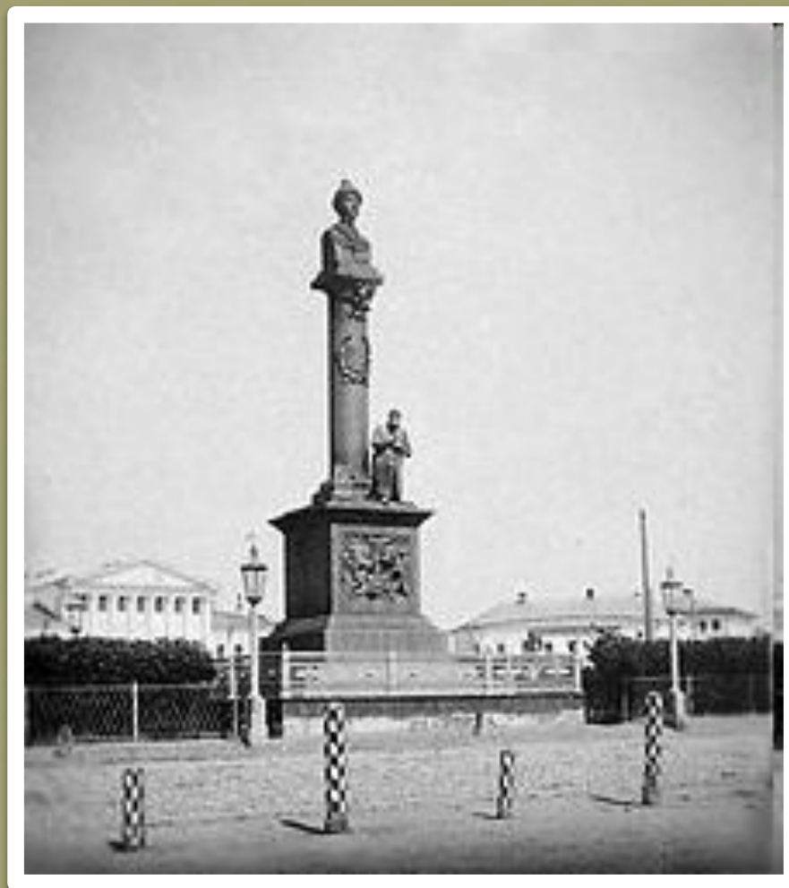
Памятник царю Михаилу Фёдоровичу и крестьянину Ивану Сусанину в Костроме (1851-1918)