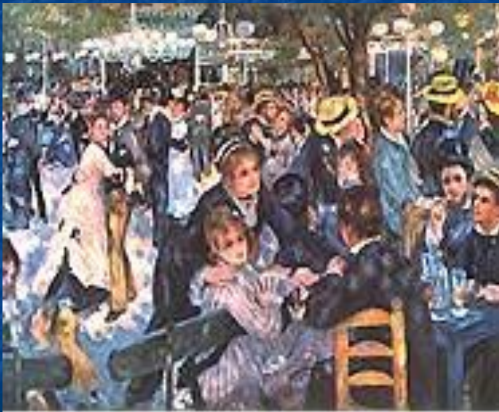
«Бал в Мулен де ла Галет». 1876.