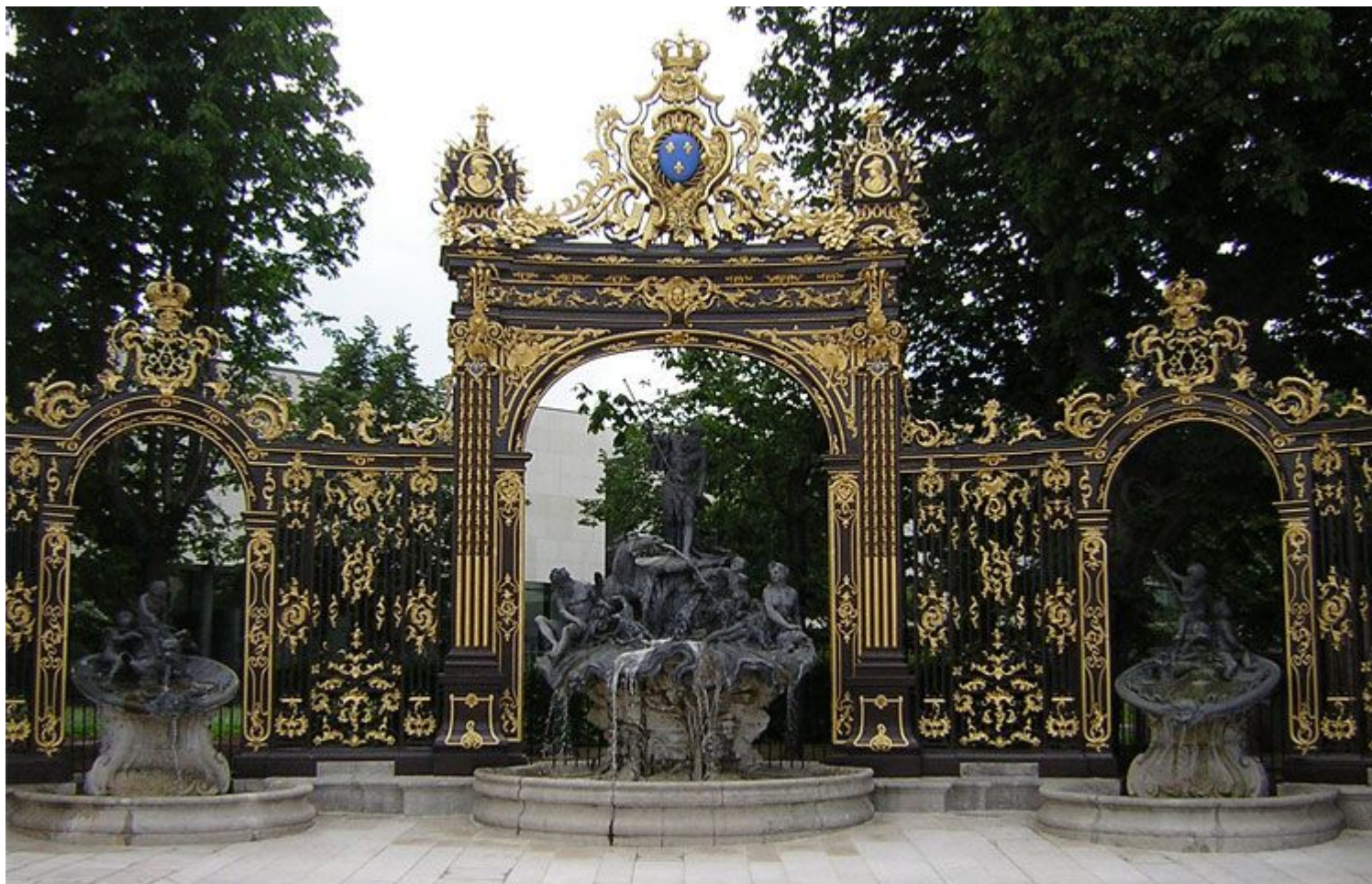
Ж. Ламур. Фонтан и решетки на Королевской площади.

БАРОККО (От итал. Бароссо (португальские моряки обозначали бракованные жемчужины неправильной формы) - причудливый, странный, вычурный) - один из главенствующих стилей в европейской архитектуре и искусстве конца XVI - середины XVIII вв.