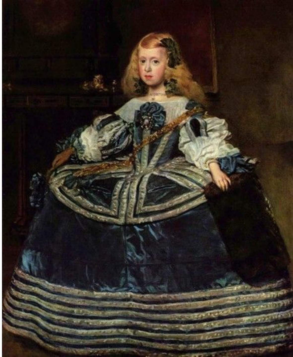
Веласкес. Портрет инфанты Маргариты